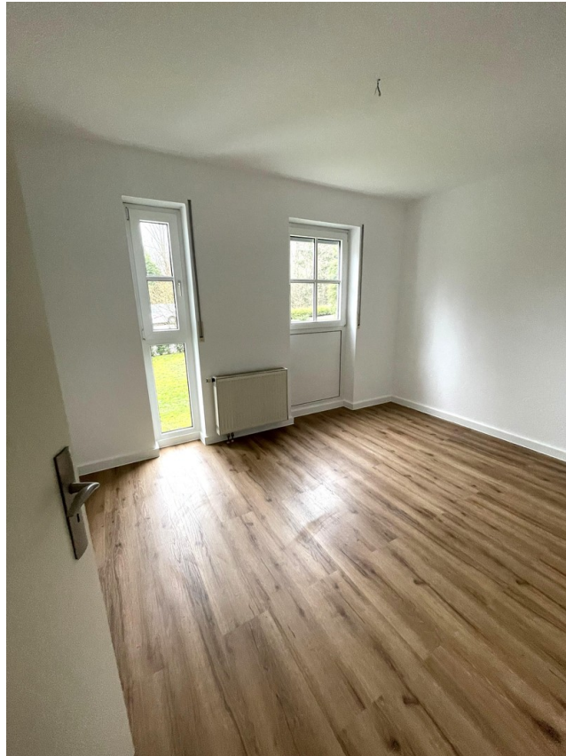
2. Zimmer, vielfältig nutzbar