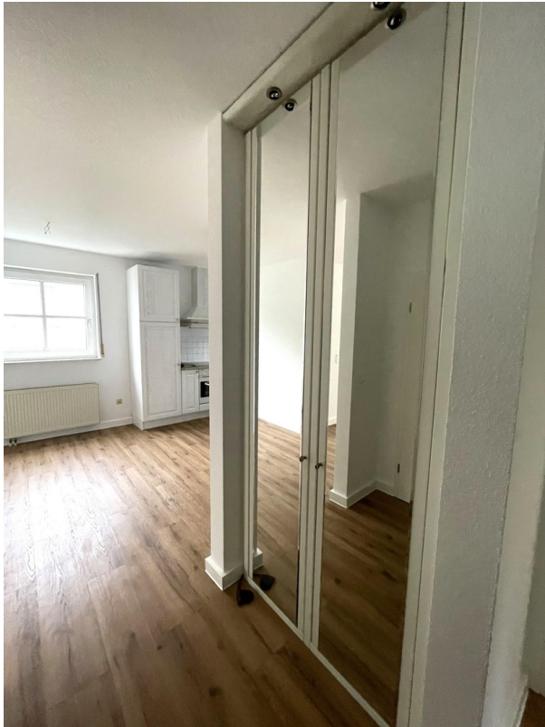
Diele mit Blick ins Esszimmer