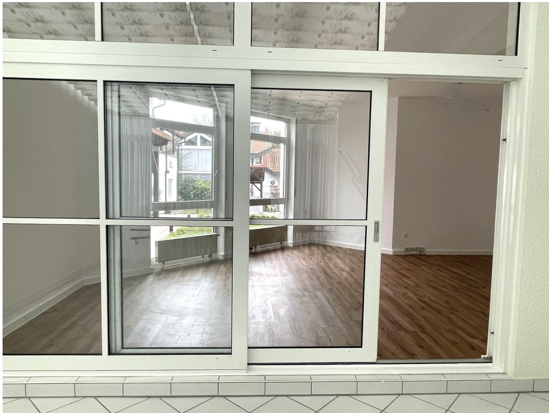
Blick vom Wintergarten in WZ