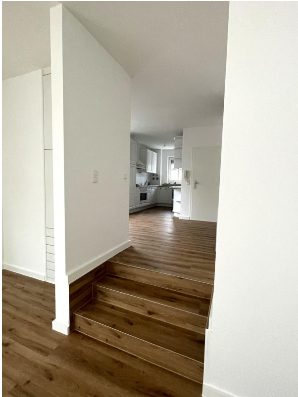
Durchgang zur Küche