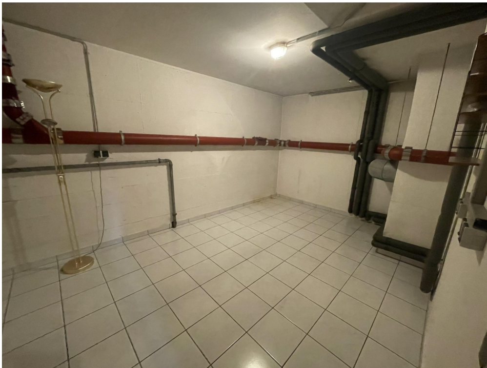
Kellerraum mit WLAN