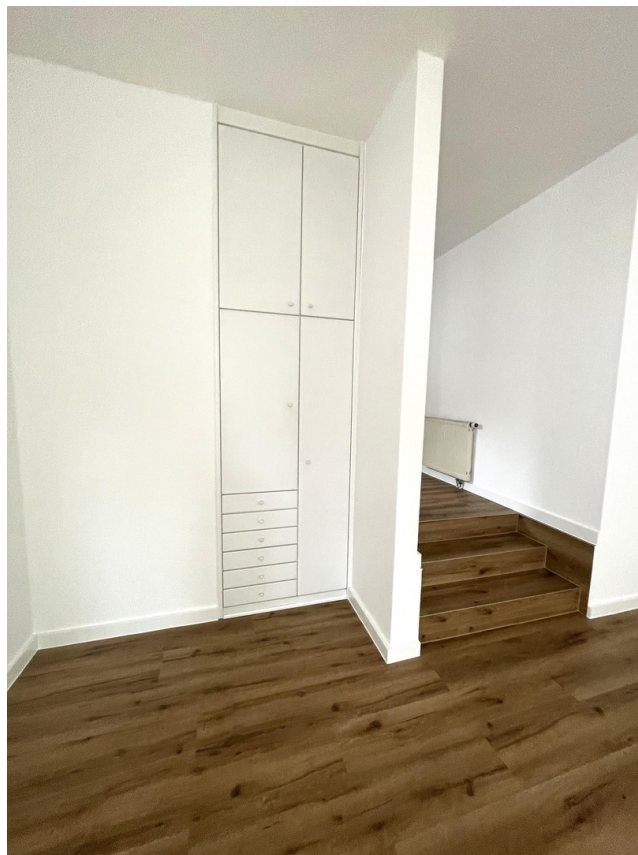
Treppe zum Esszimmer