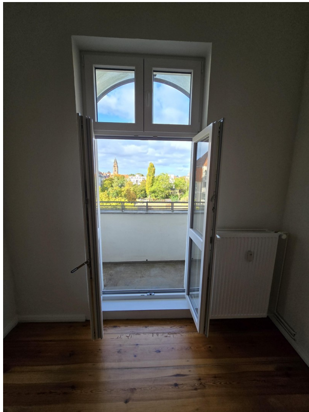
Zimmer 1 - Balkon