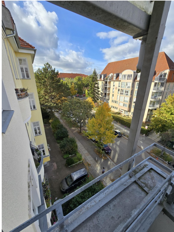
Blick vom Balkon 1