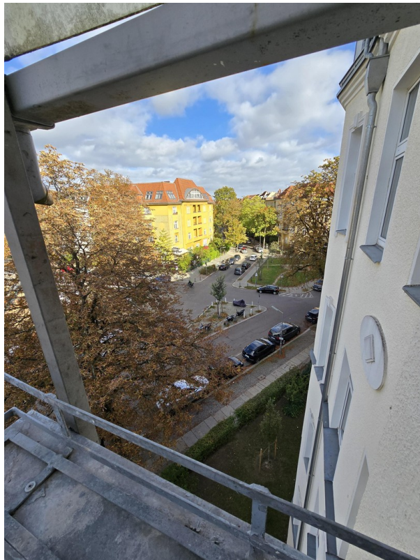
Blick vom Balkon 2