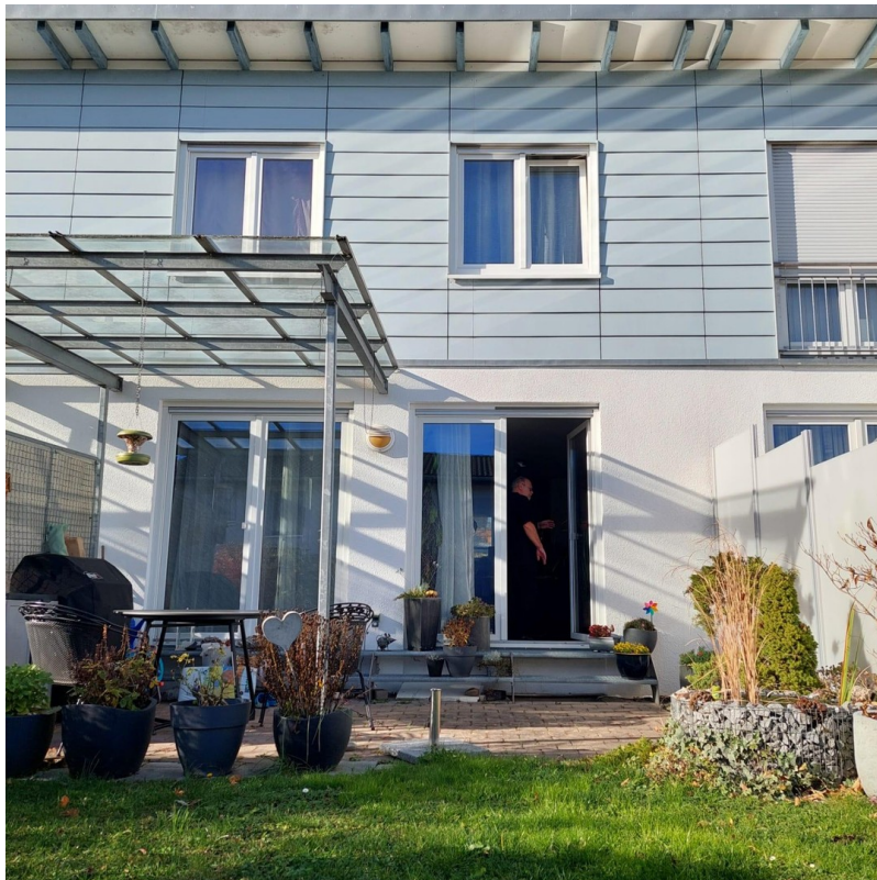
Haus mit überdachter Terrasse