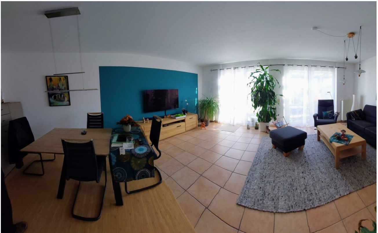
Panorama W + E