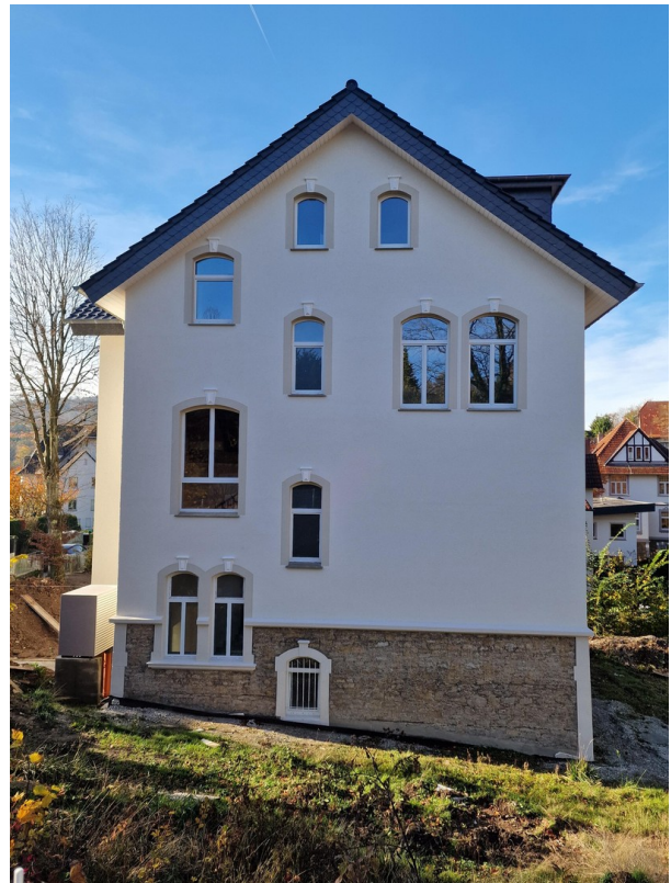
Ansicht von Ost