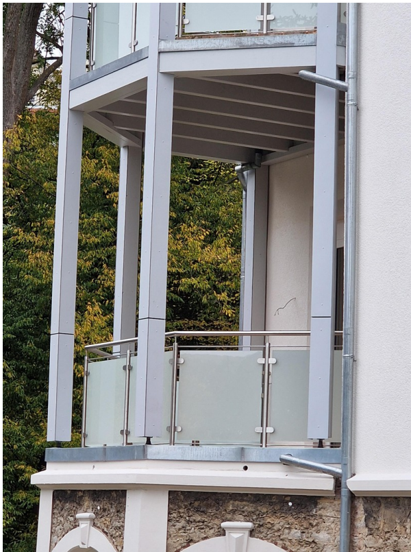
Balkon Erdgeschoss überdacht