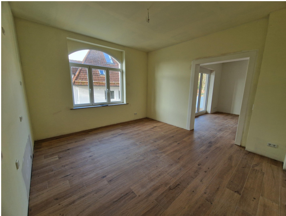
Küche / zum Wohnzimmer