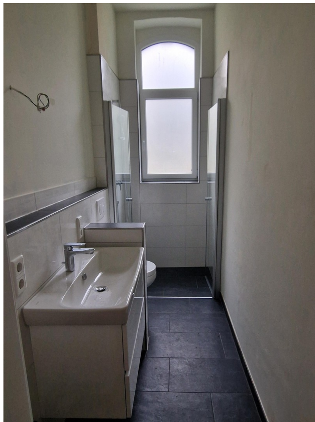
Bad mit ebenerdiger Dusche