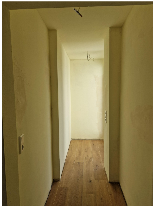
Garderobe, zur Terrasse