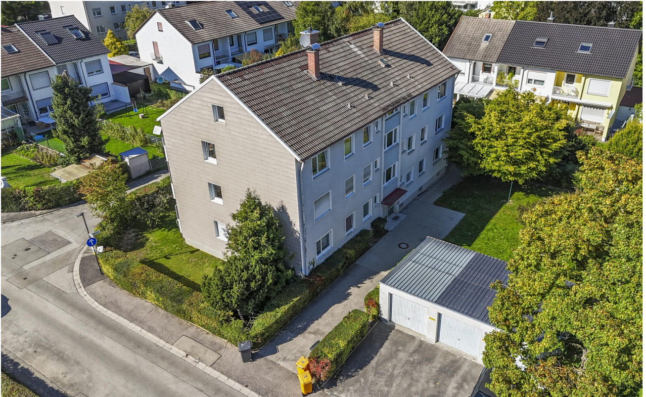
Garage direkt vor dem Haus