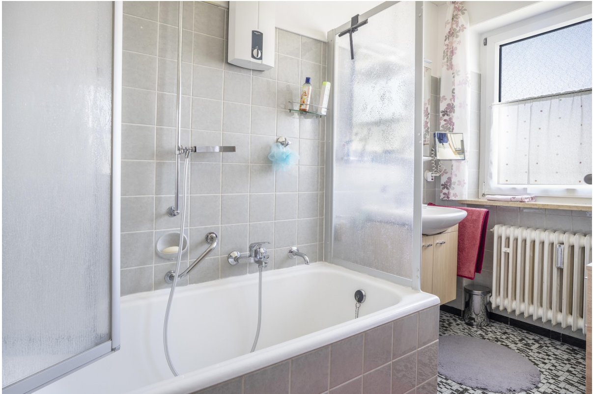
Bad mit Wanne