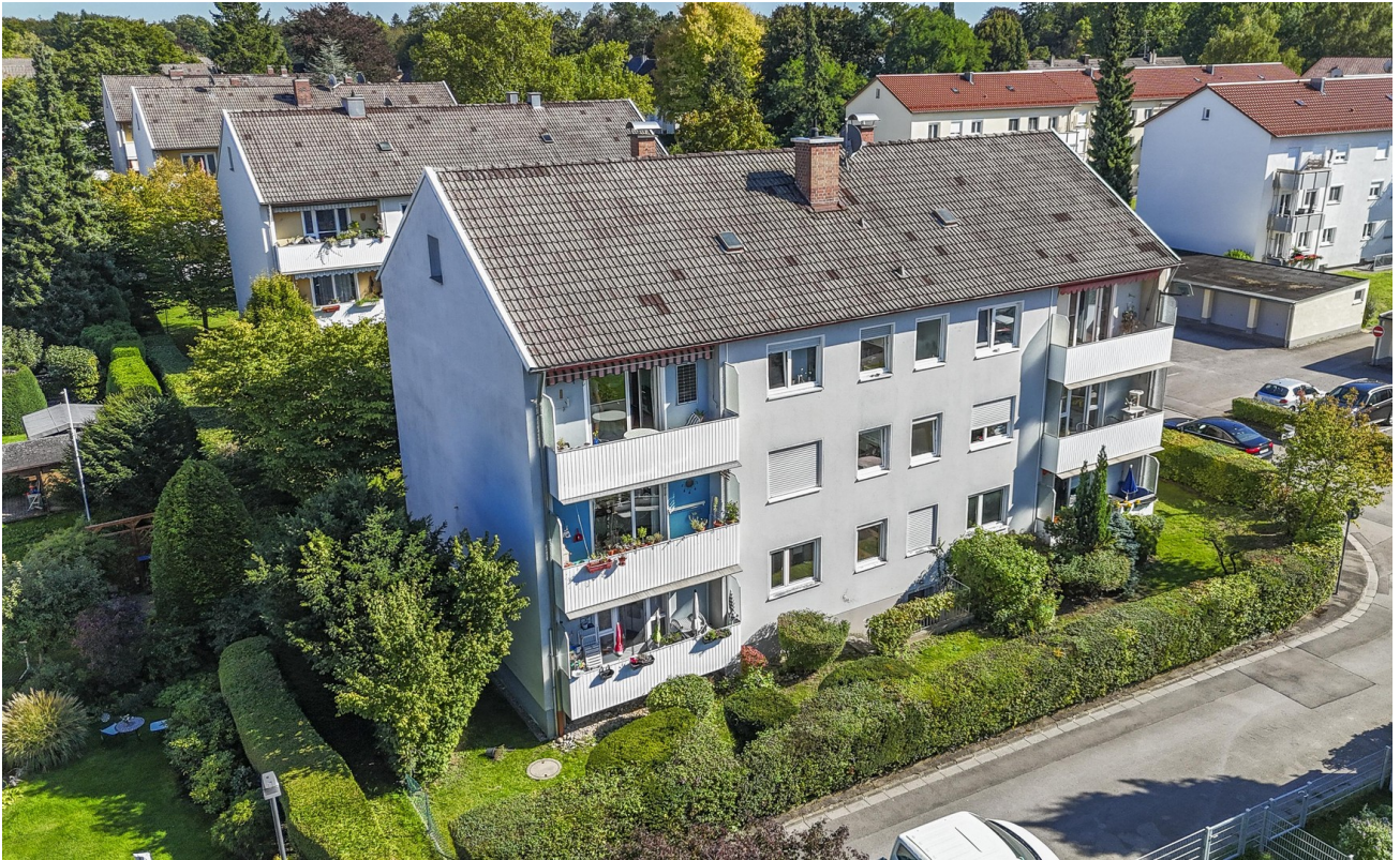
Haus mit Westbalkon