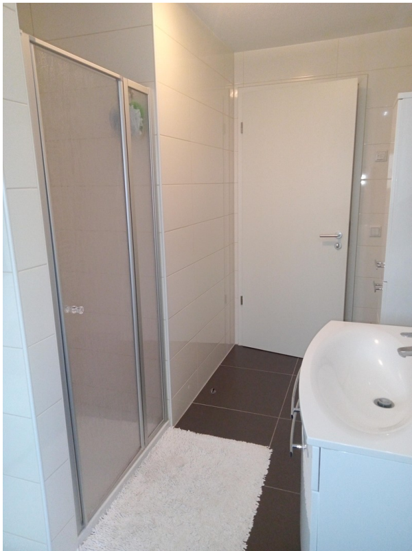
Badezimmer mit Dusche und Bad