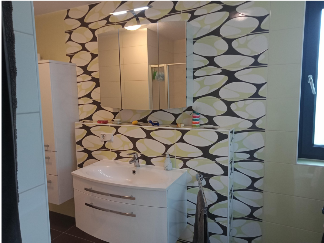
Badezimmer mit Dusche und Bad