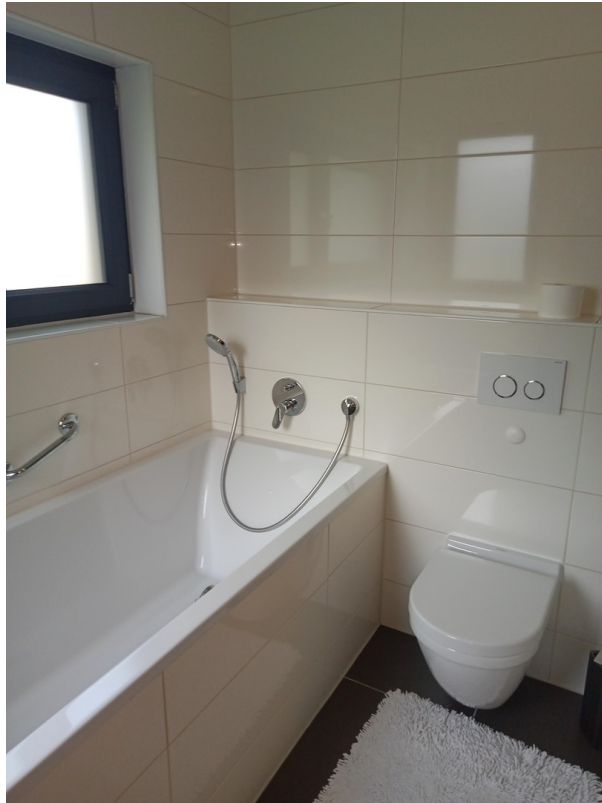
Badezimmer mit Dusche und Bad