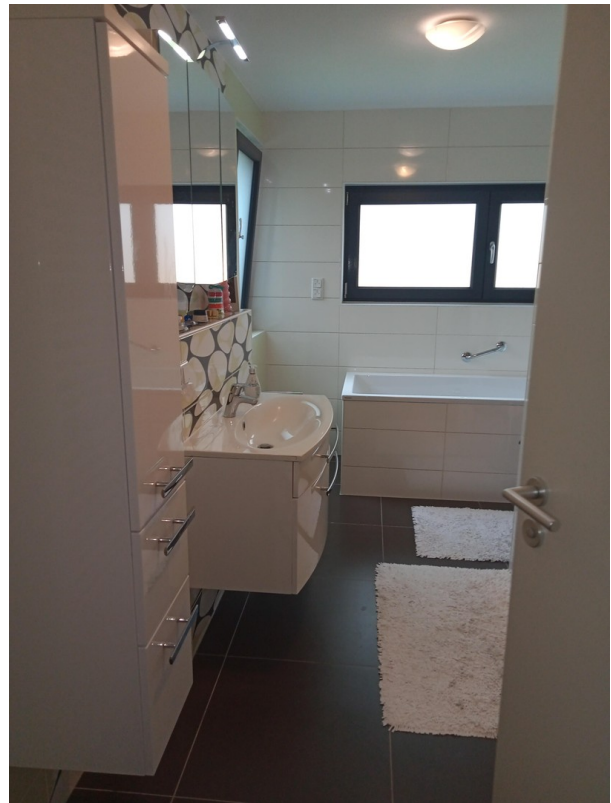
Badezimmer mit Dusche und Bad