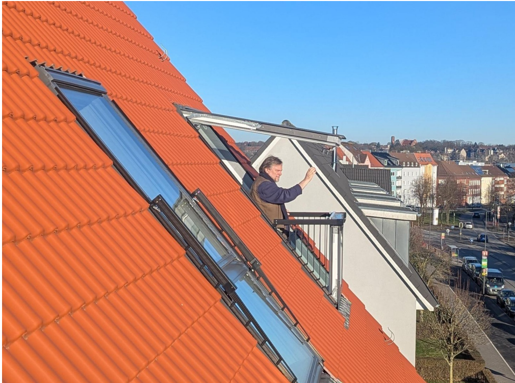
Fensterbalkon von außen