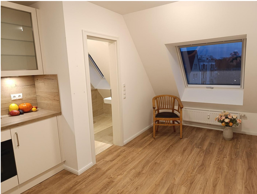
Wohnküche mit großem Fenster