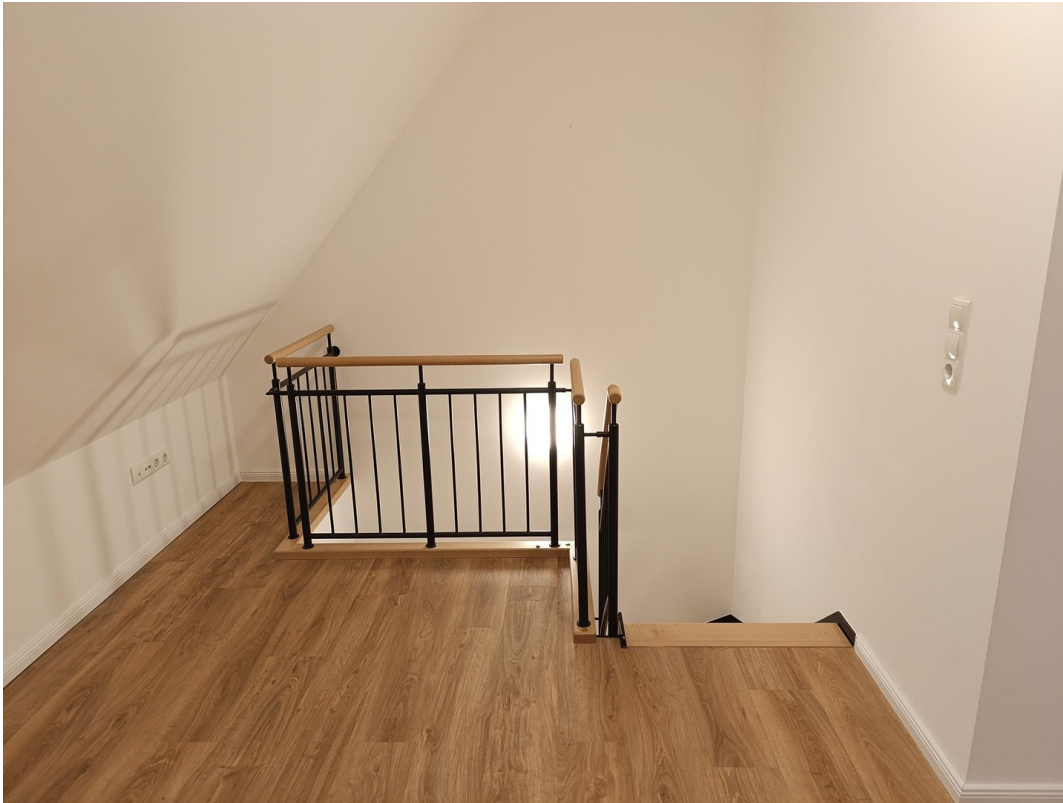
Treppe nach unten