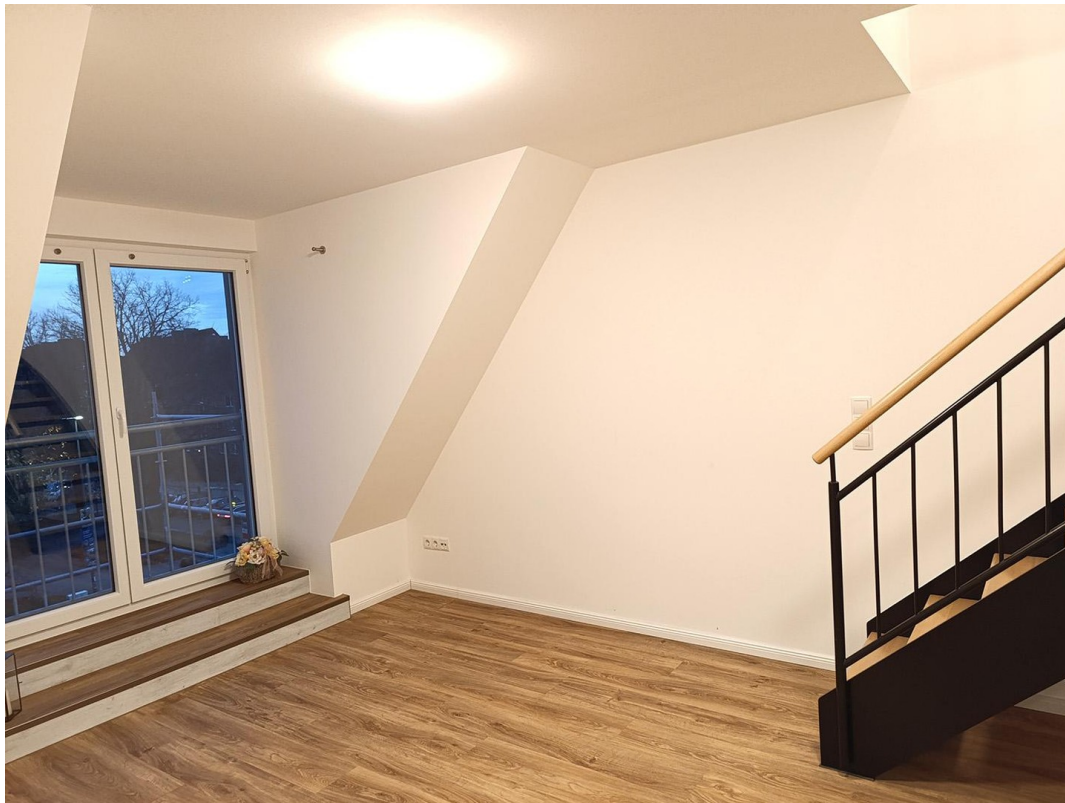
Wohnzimmer mit großer Gaube