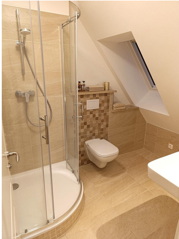
Panorama des Badezimmers