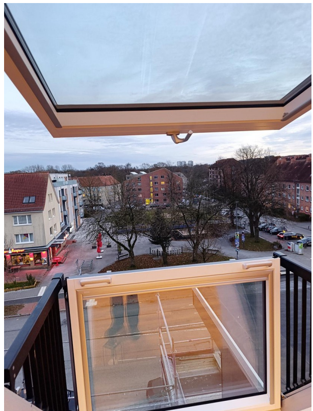
Fensterbalkon z.Tilsiter Platz