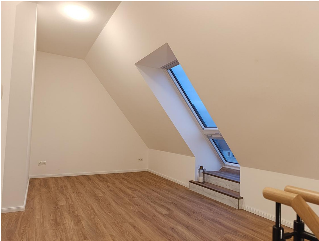
Schlafebene mit Fensterbalkon