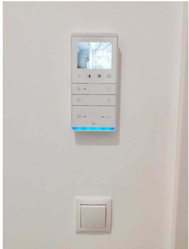
Gegensprechanlage im Flur