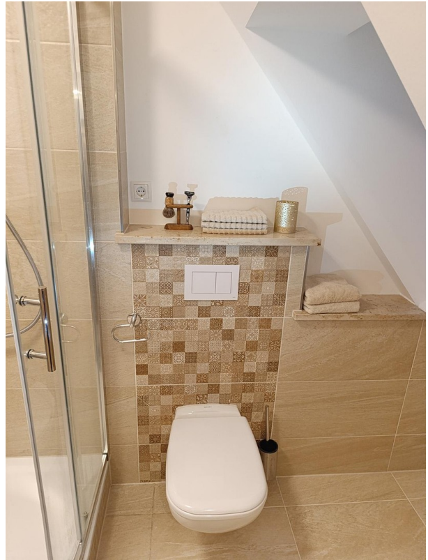
Badezimmer, elegantes WC