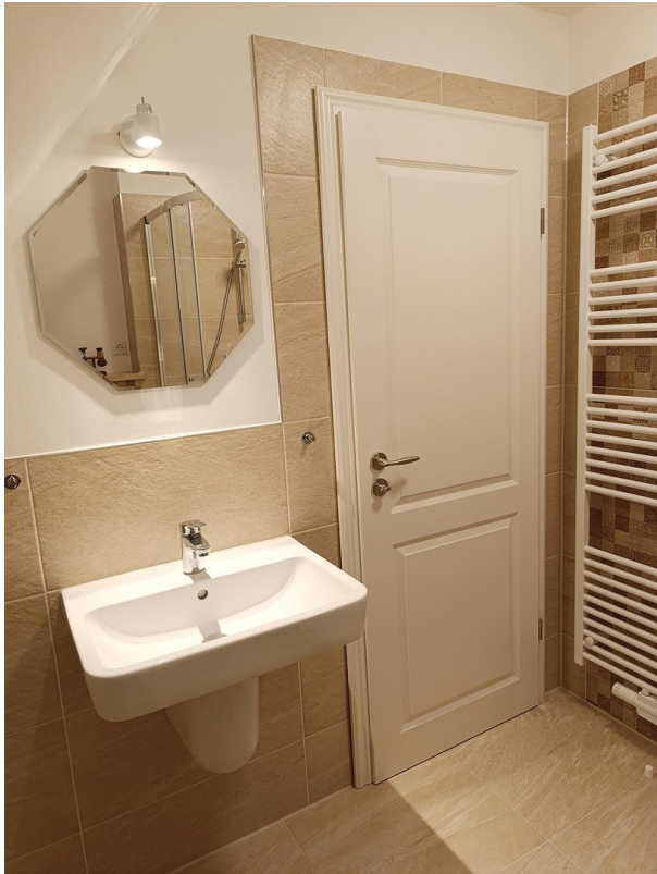
Bad mit Handtuchheizung