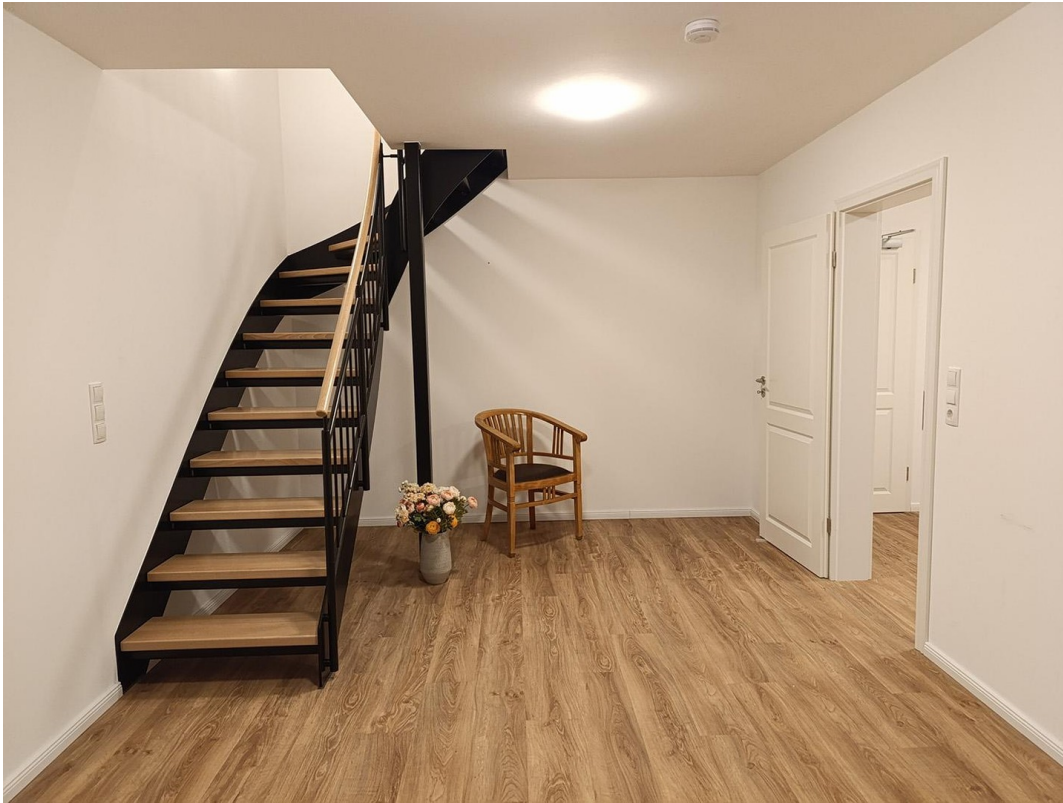
WZ mit Treppe zur oberen Ebene