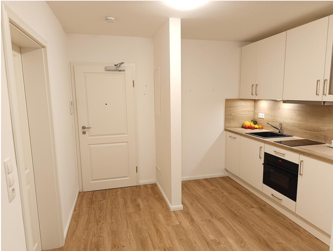
Blick zur Wohnungseingangstür