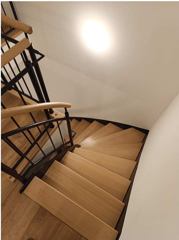
Treppe nach unten