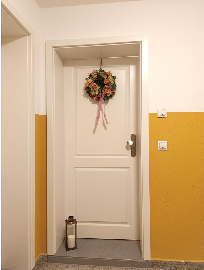
Eingang zur Maisonette-Wohnung