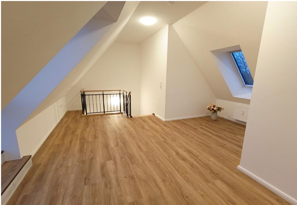
Schlafbereich Richtung Treppe