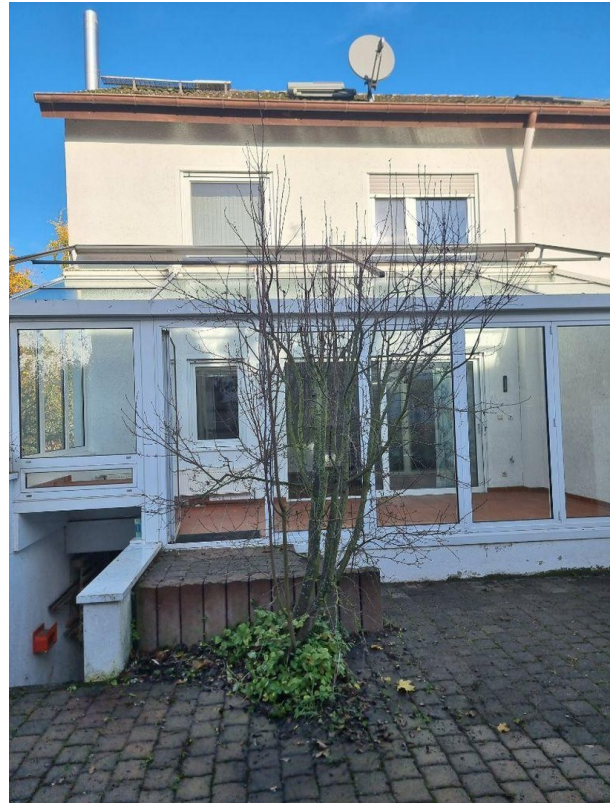
Wintergarten von Außen