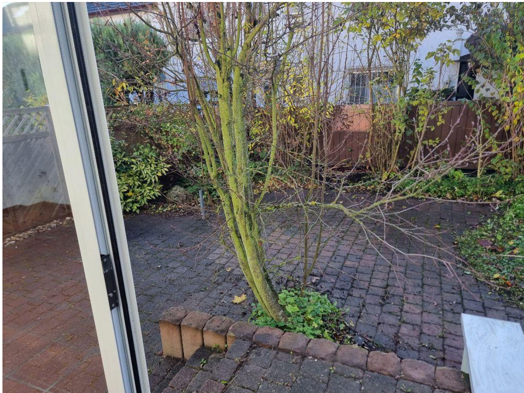
Garten Blick aus Wintergarten