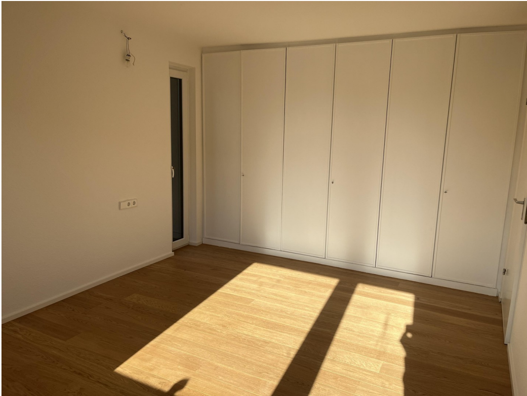
Schlafzimmer/Arbeitszimmer 1 1