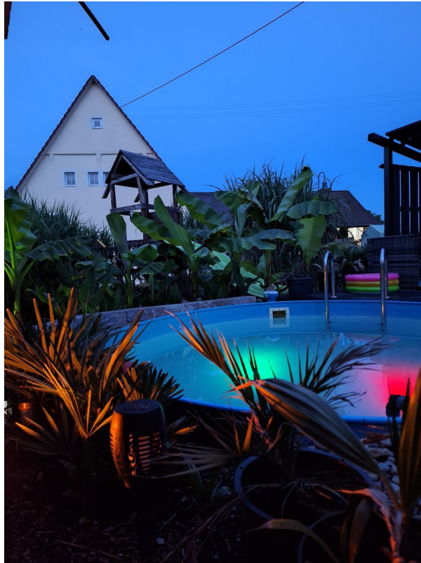
Urlaubsfeeling im Sommer