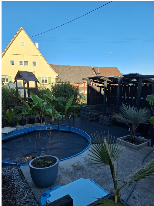
Pool mit Terasse