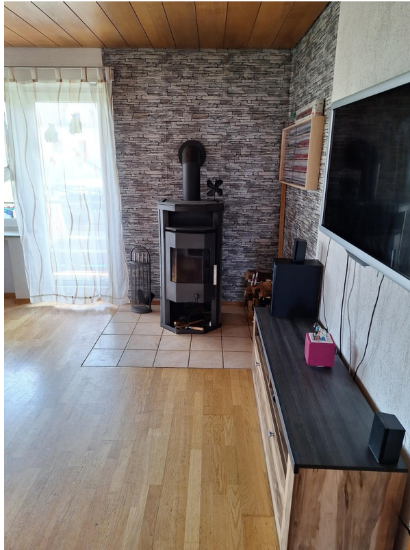
Holzofen im Wohnzimmer