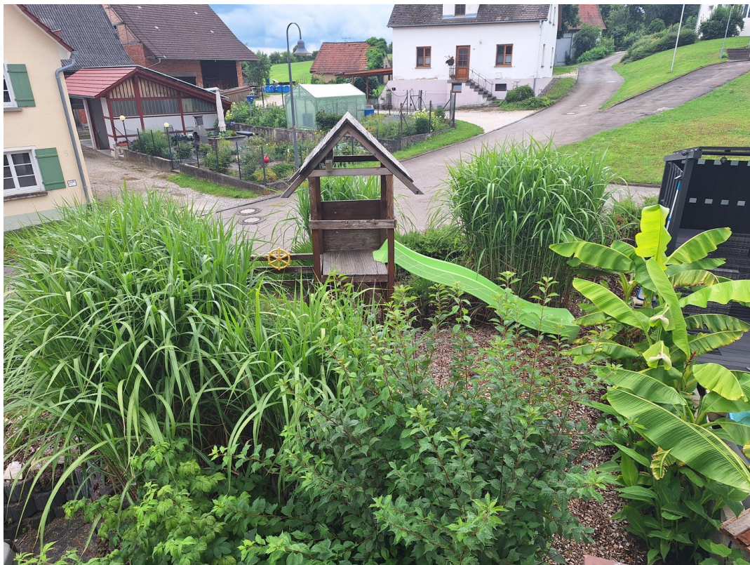
Garten ( kein Spielturm mehr)