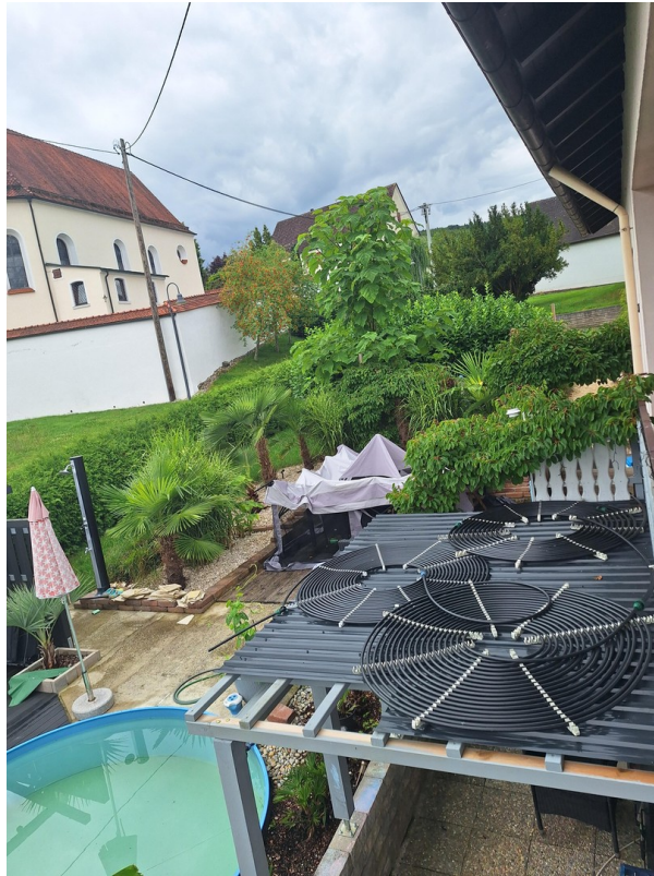
Terrasse mit Poolheizung