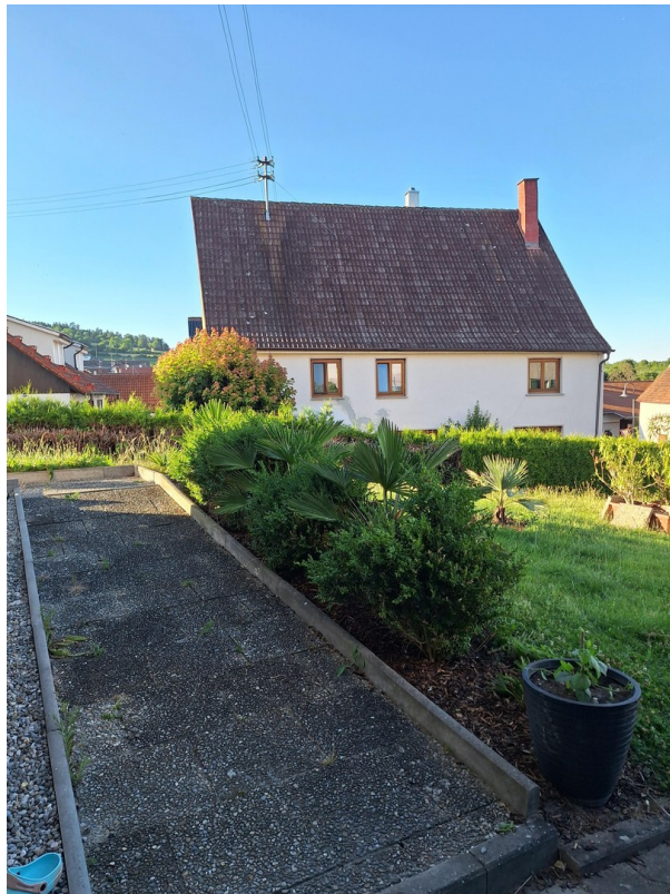
Zugang zum Hauseingang