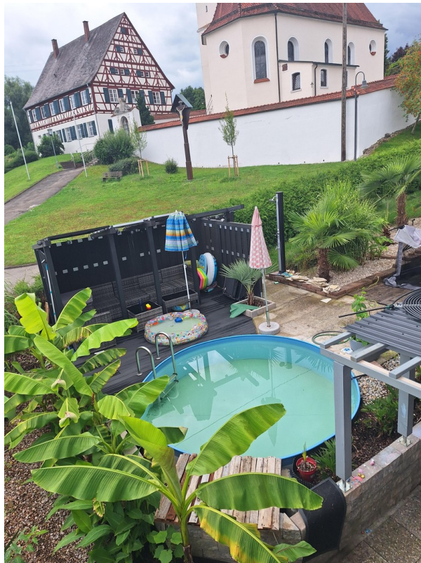
Sicht vom Balkon