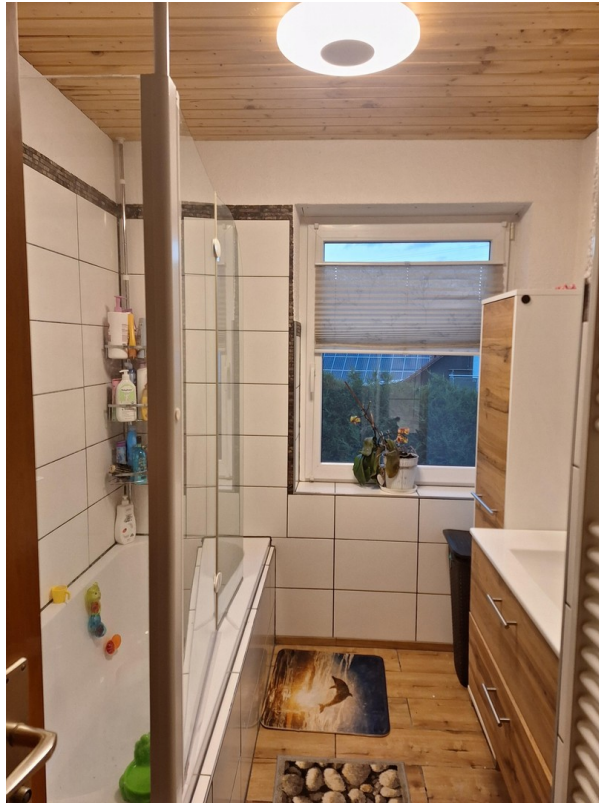
Bad mit Badewanne