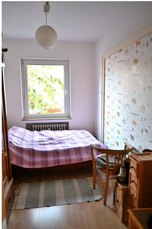
3. kleines Schlafzimmer