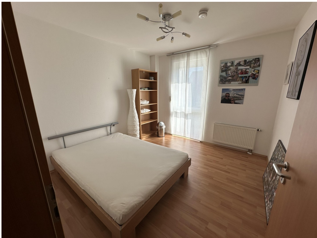
1. OG Kinderzimmer links