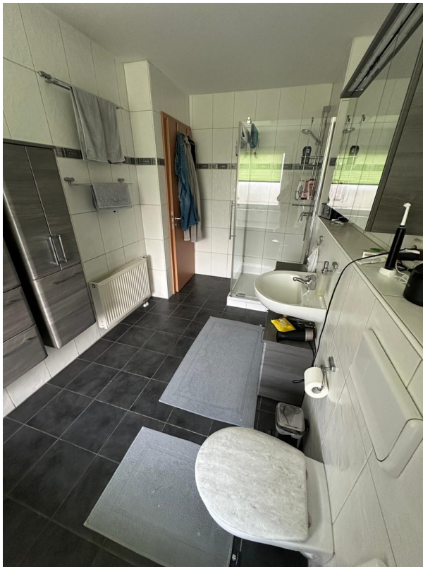
1. OG Badezimmer