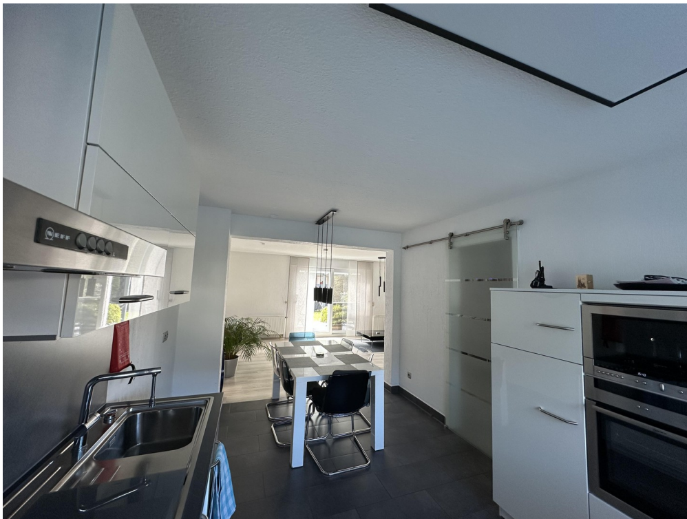
EG offene Wohn-Ess-Küche