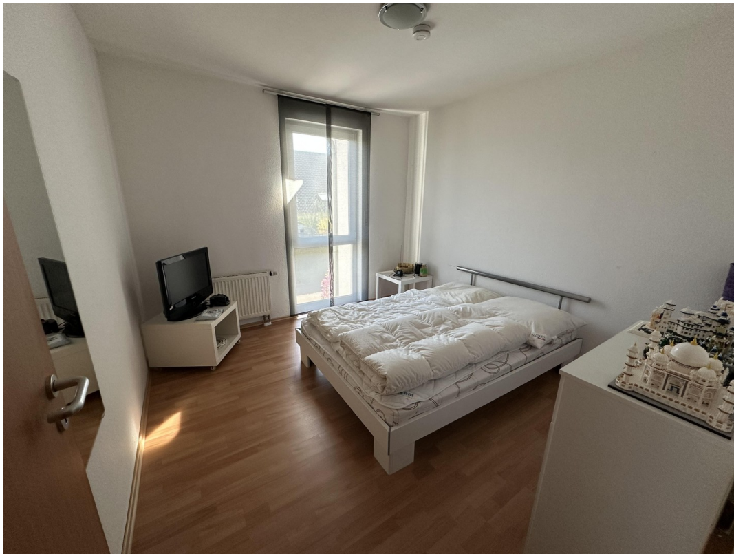
1. OG Kinderzimmer rechts