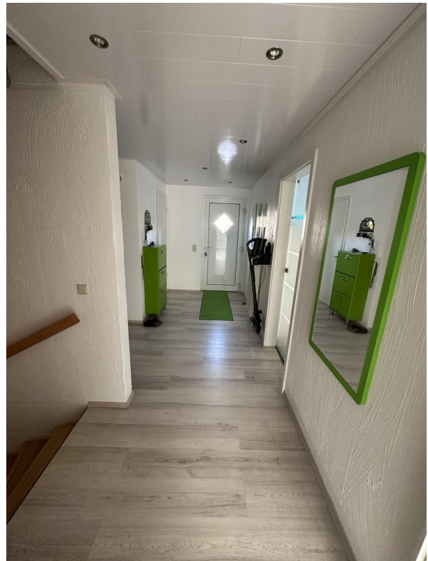
EG Eingang Flur