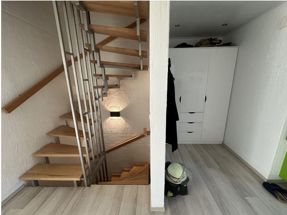
EG offenes Treppenhaus