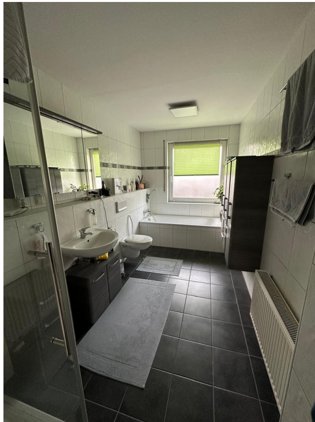
1. OG Badezimmer