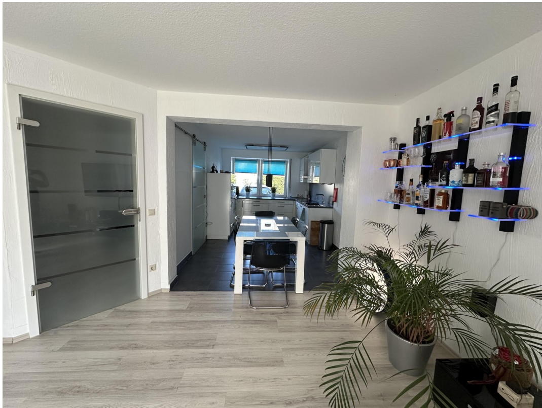
EG offene Wohn-Ess-Küche