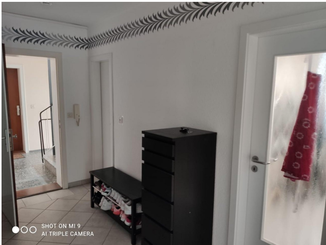
Flur mit Blick ins Treppenhaus