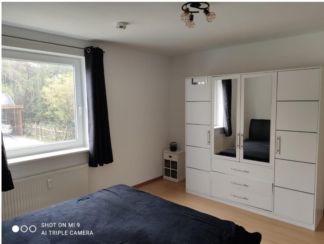
Schlafzimmer mit Fenster