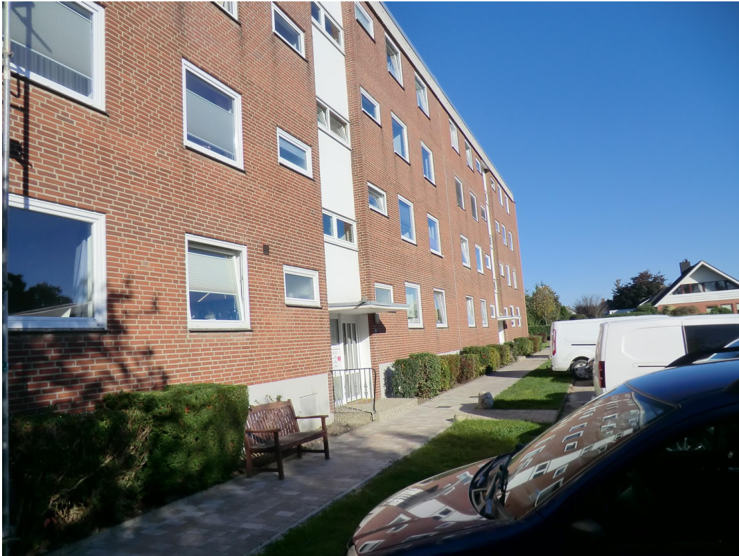
Ostansicht des Hauses