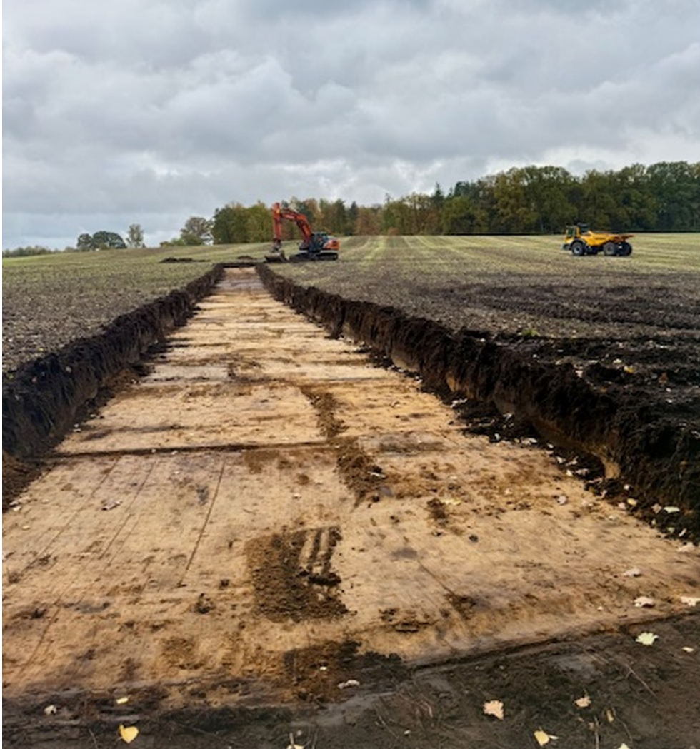
Beginn der Erschließung