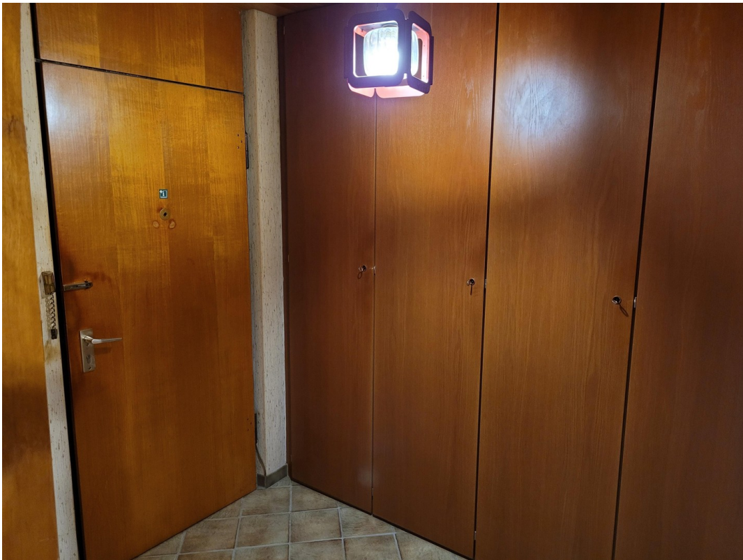
Diele mit Einbauschränk