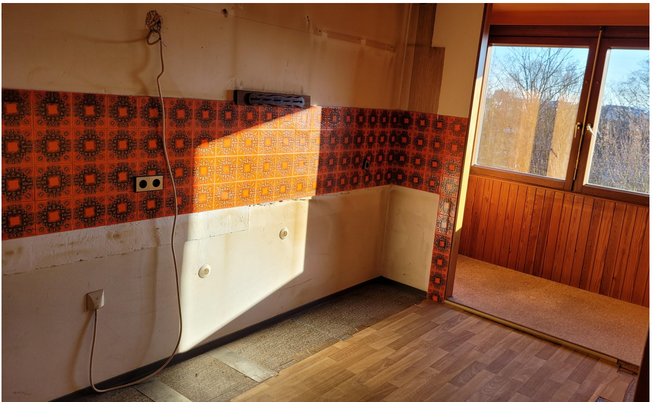
Küche mit Essplatz