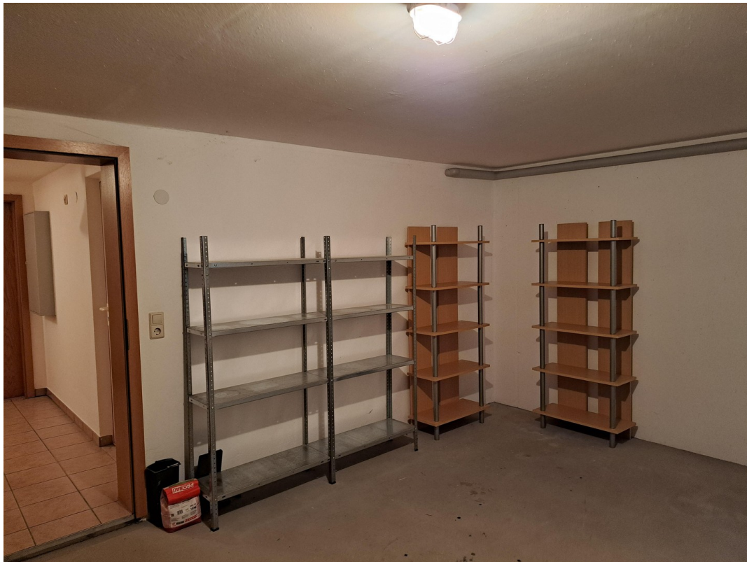
UG / Keller 2