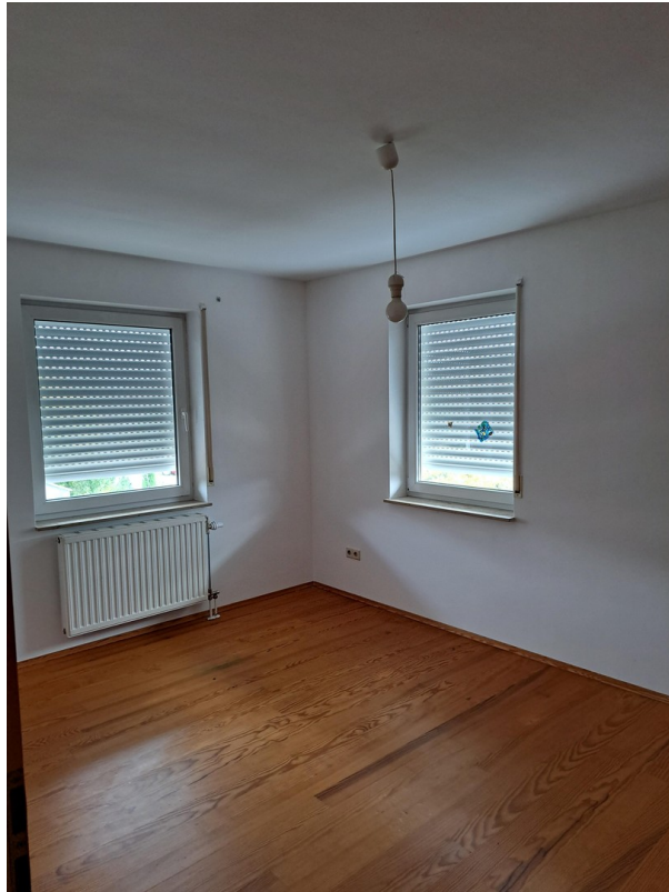
OG Zimmer 3