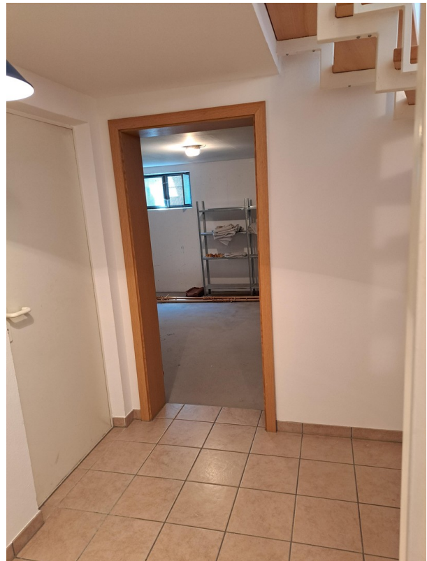
UG / Keller 2 und Heizungsraum