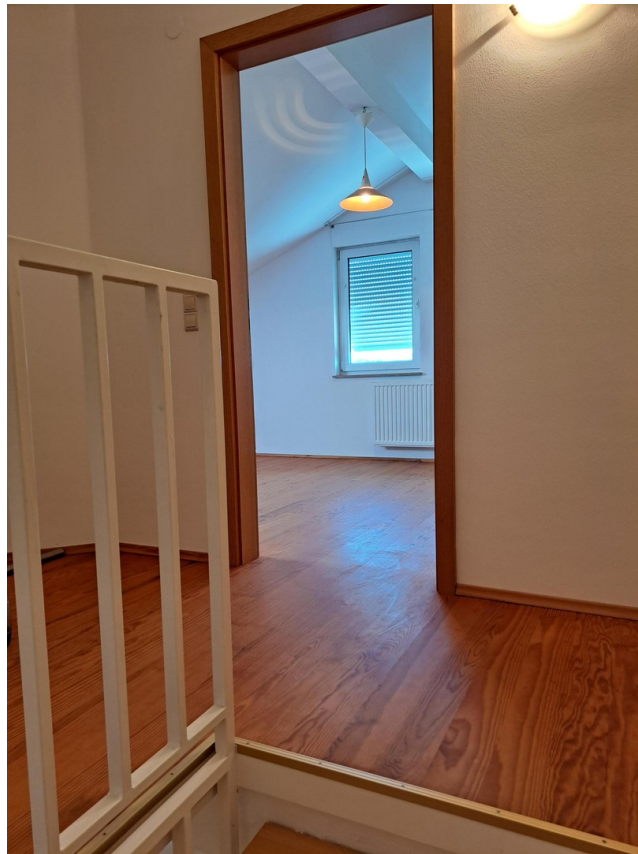
Dachgeschoss Zimmer 4