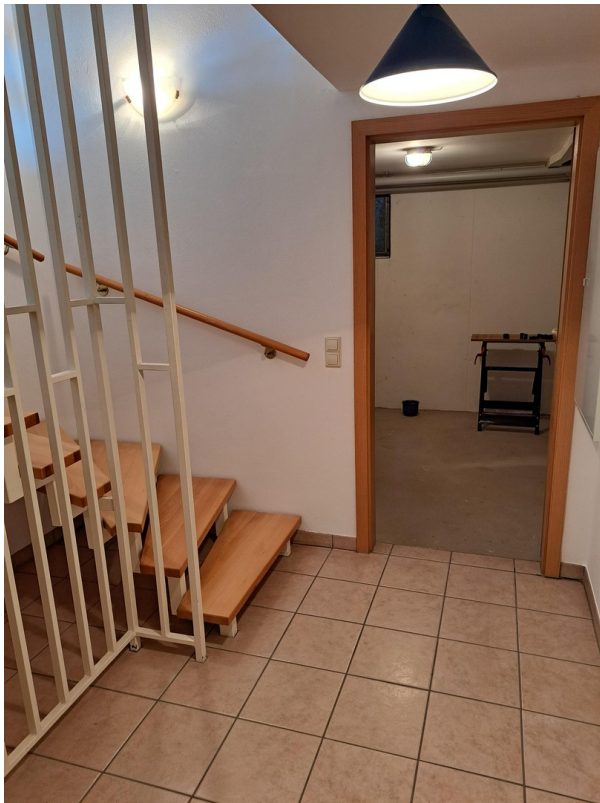
UG / Keller 1