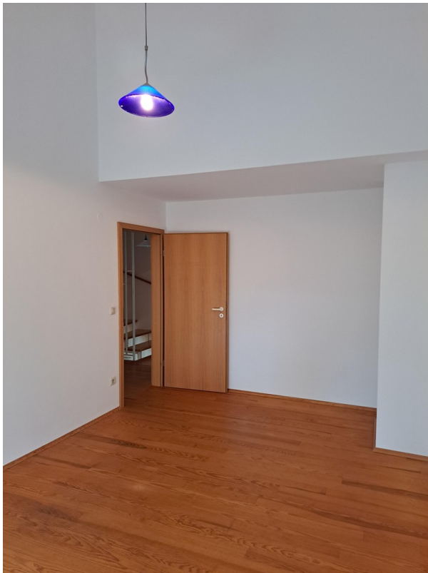
OG Zimmer 1 mit Balkonzugang