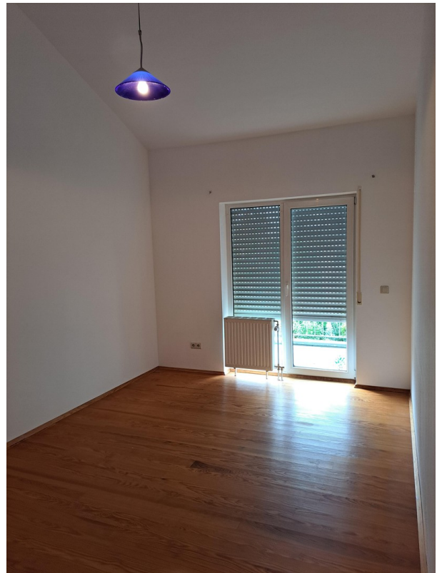
OG Zimmer 1 mit Balkonzugang