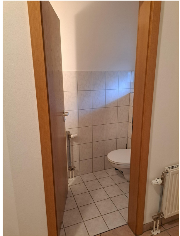
Eingangshalle und Gästetoilette