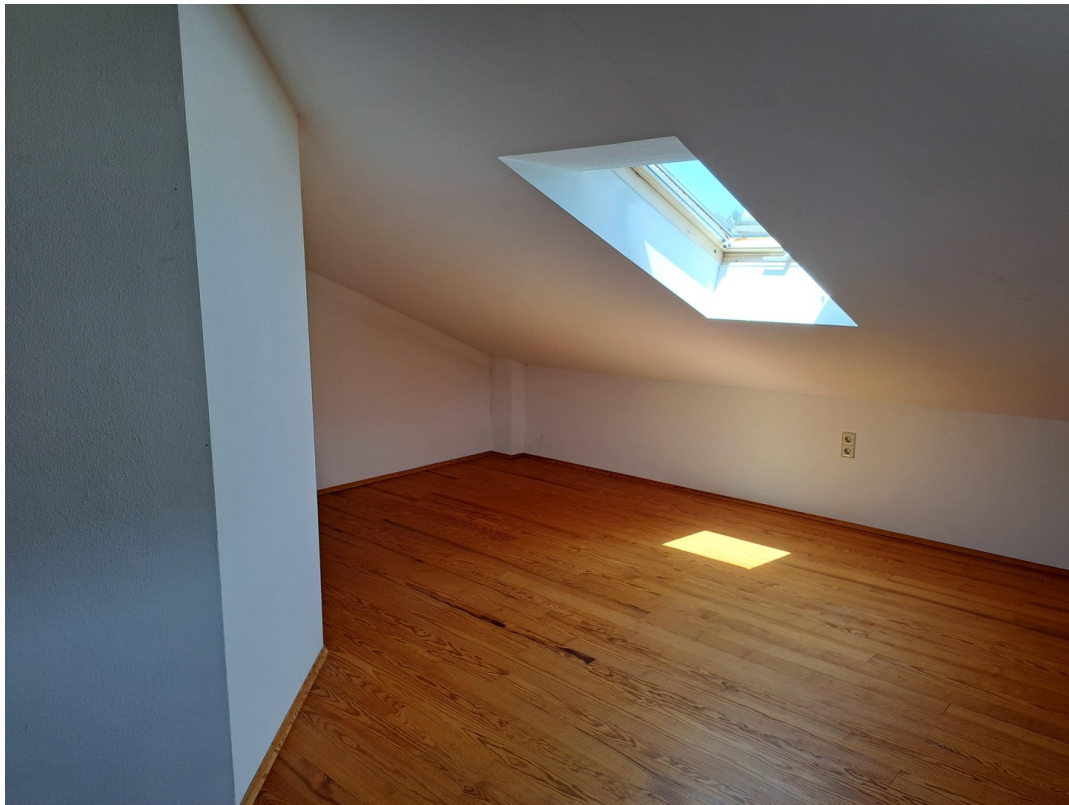
Dachgeschoss Zimmer 4