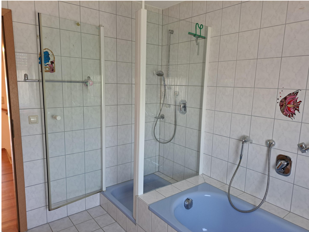
OG BAD & WC