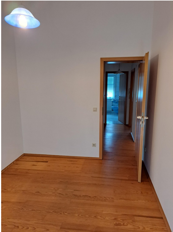
OG Zimmer 2 mit Balkonzugang