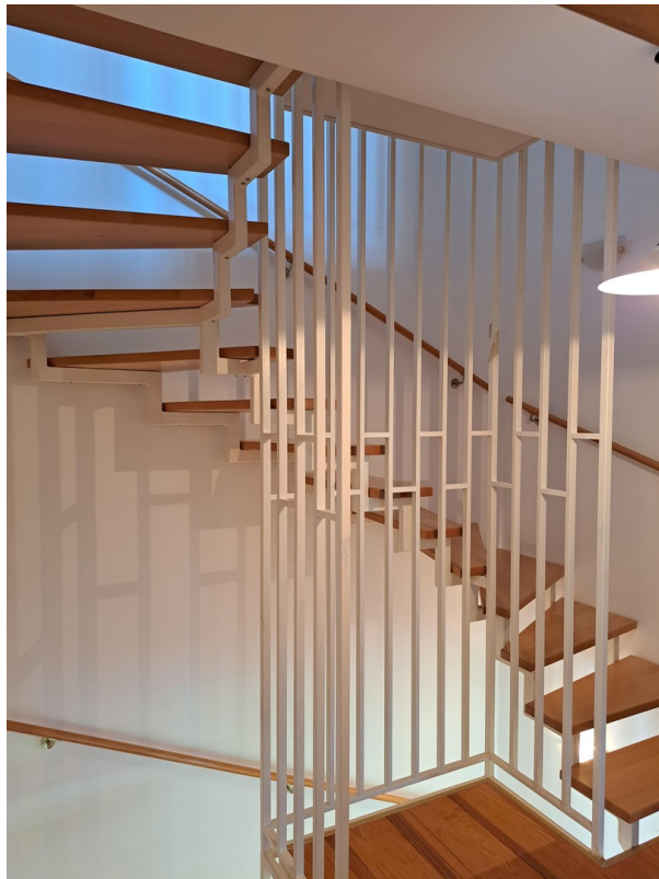
Treppe zum Dachgeschoss