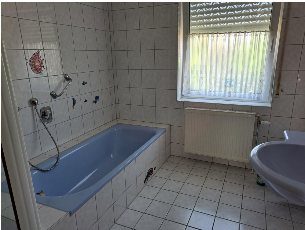
OG BAD & WC