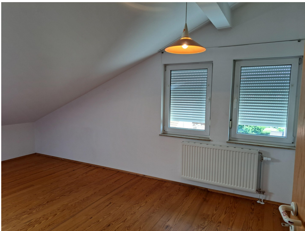
Dachgeschoss Zimmer 4