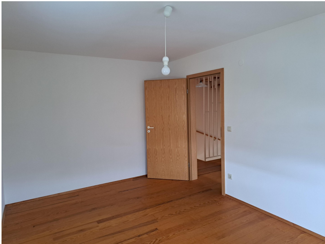
OG Zimmer 3