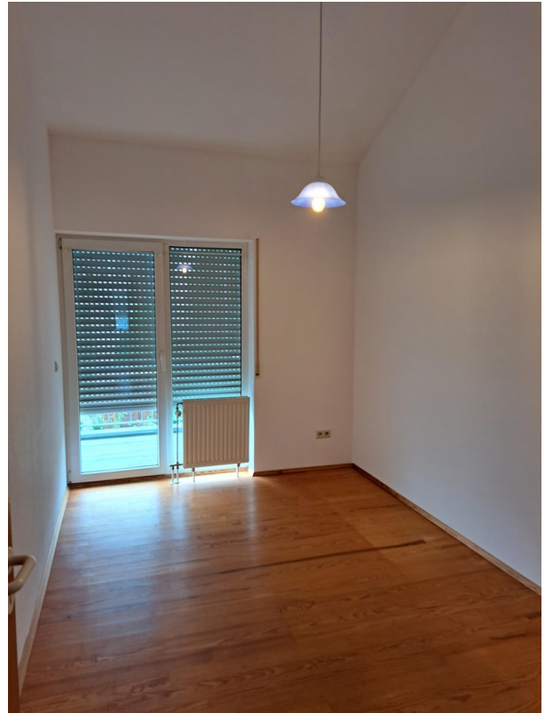
OG Zimmer 2 mit Balkonzugang