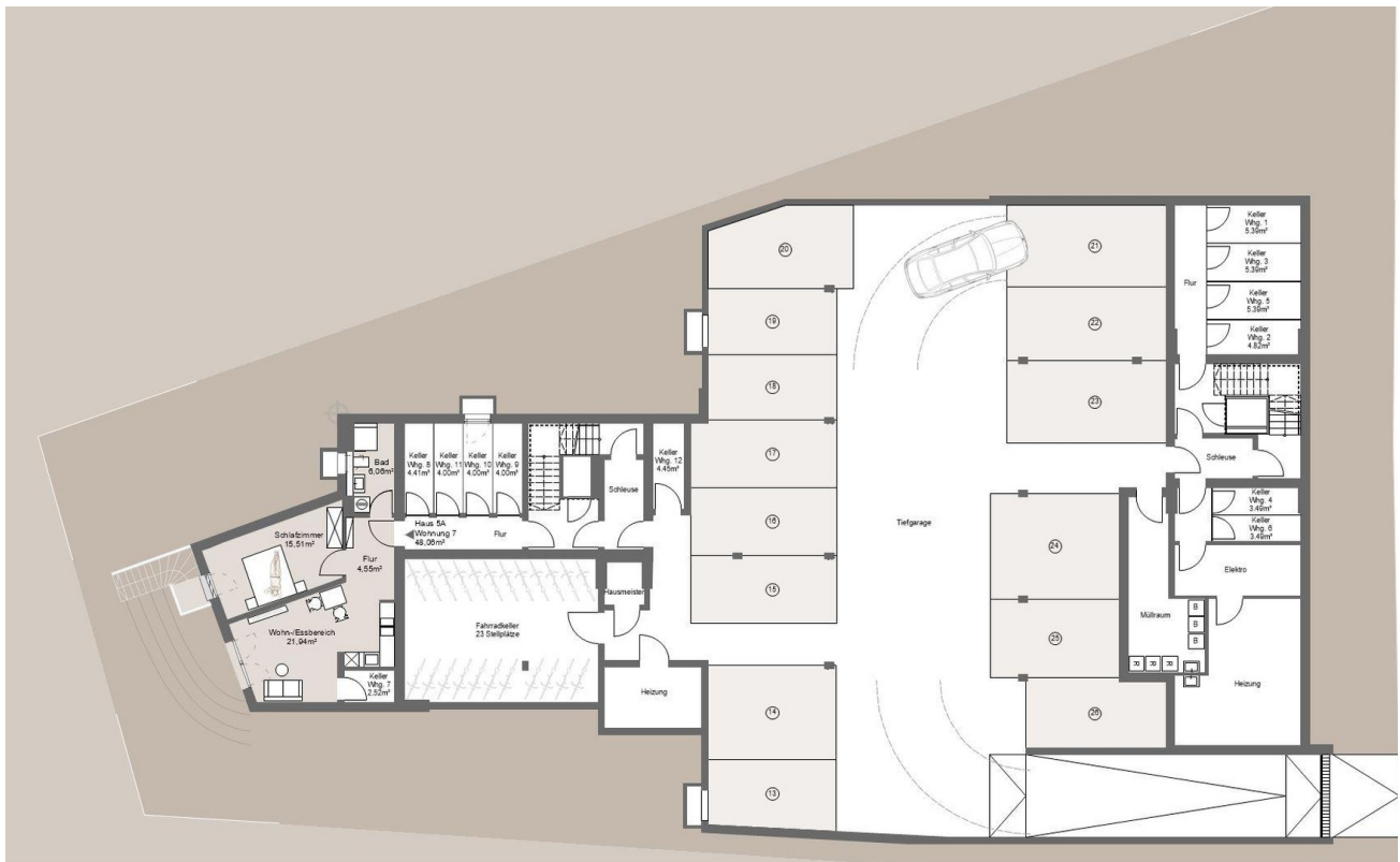
Tiefgarage und Abstellräume