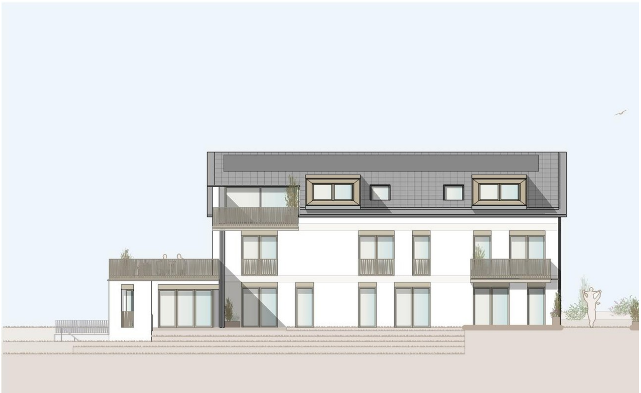
Ansicht Süd/Ost Haus 5a