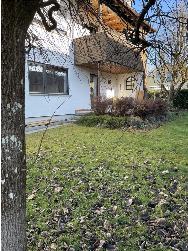
Gartenbereich mit Terrasse