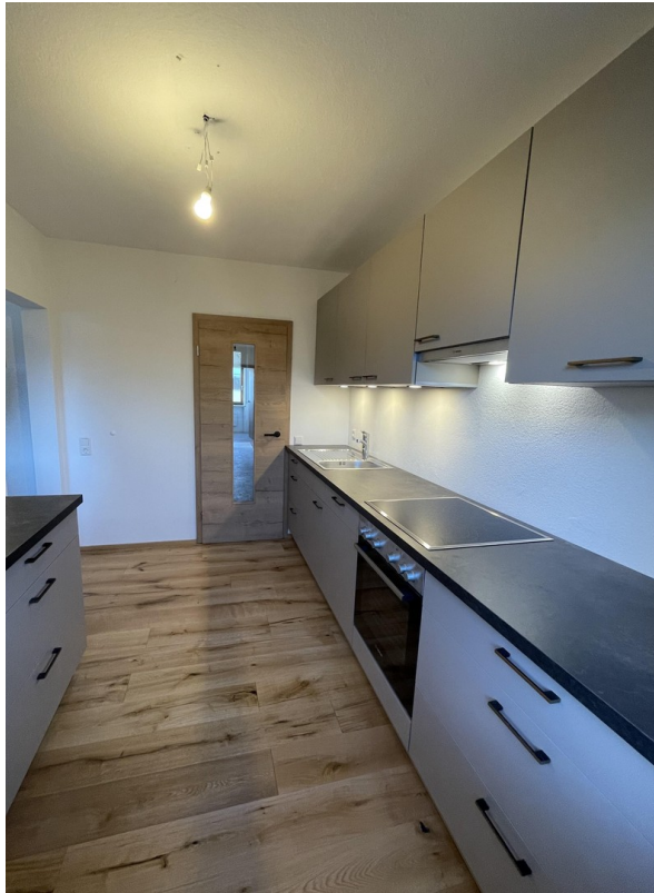
Küche inkl. Einbauküche