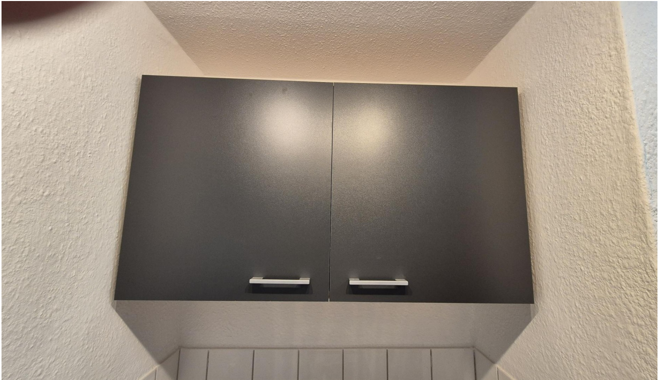
Detailansicht Küche II