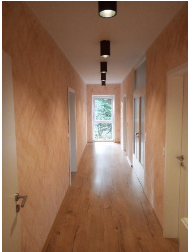
Flur zum Schlaftrakt