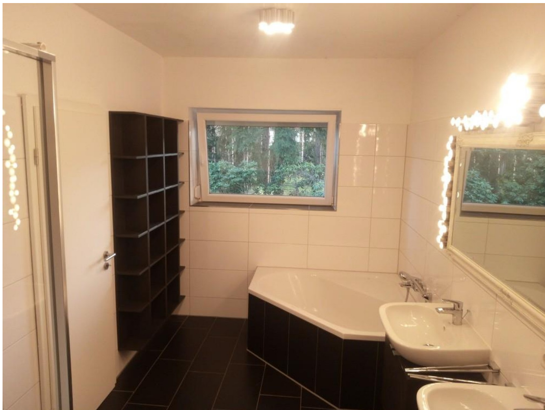
Tageslichtbad / Elternbad