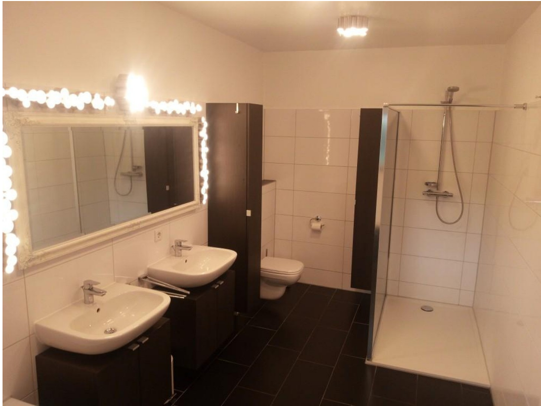
Tageslichtbad / Elternbad