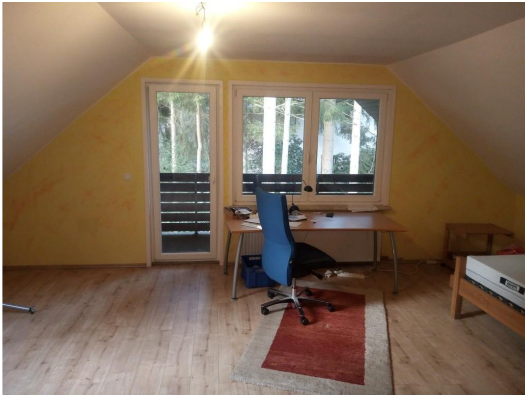
Zimmer West mit Loggia