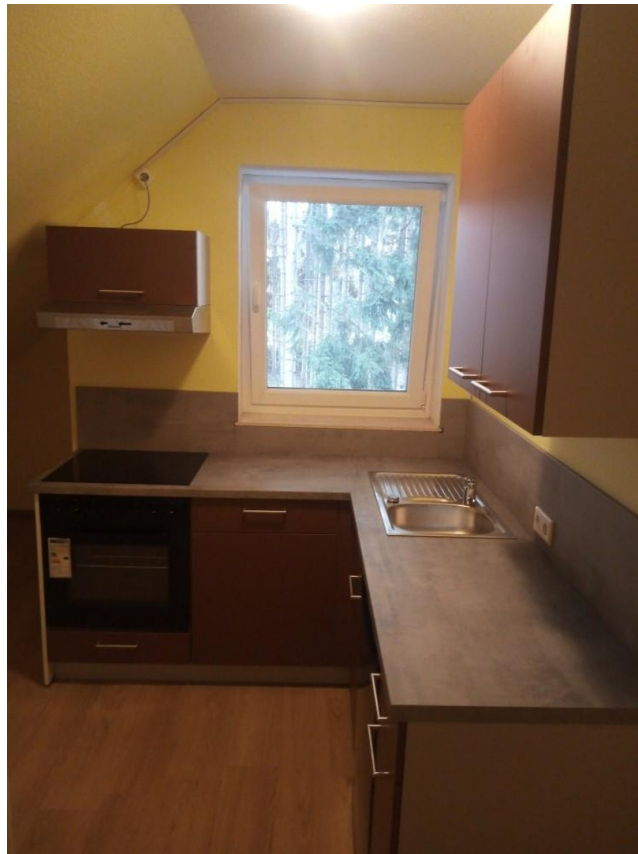
Küche mit Einbauküche neu