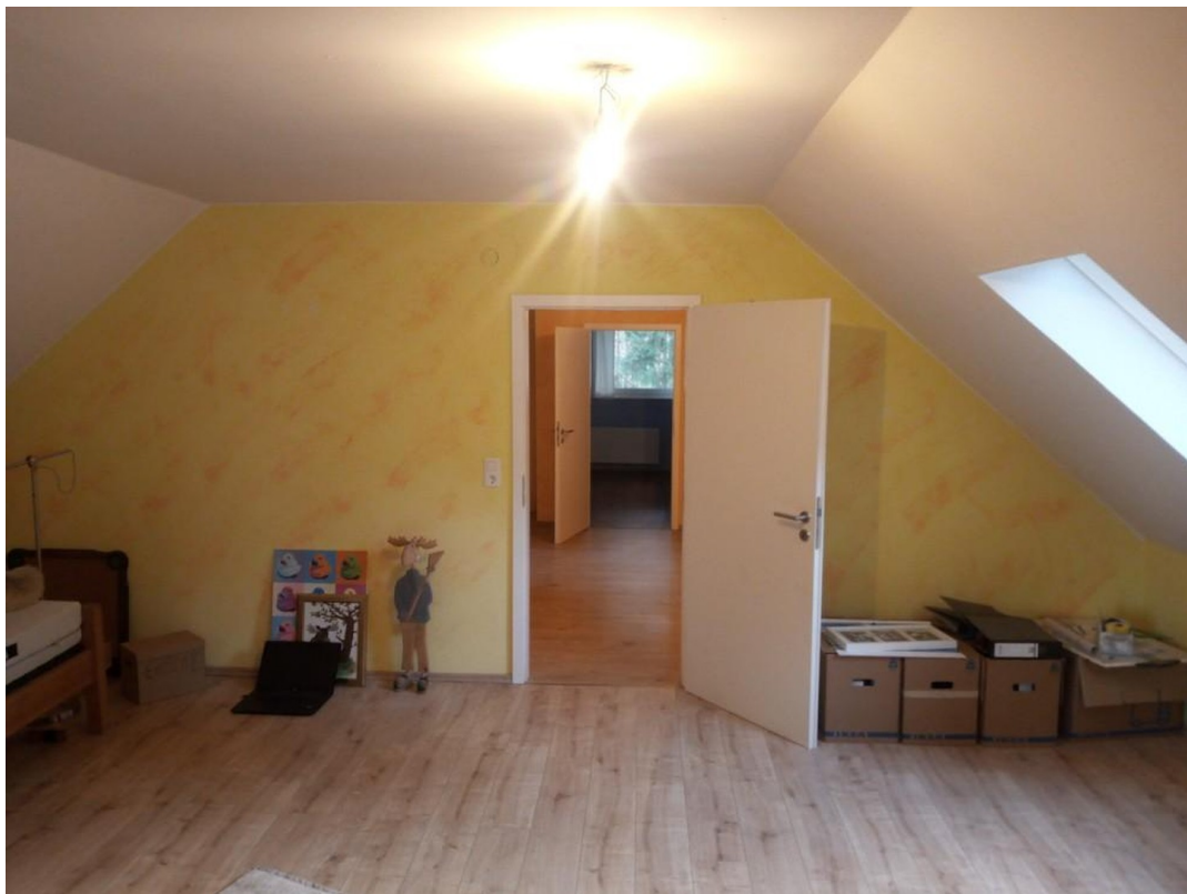
Zimmer West mit Dachfenster