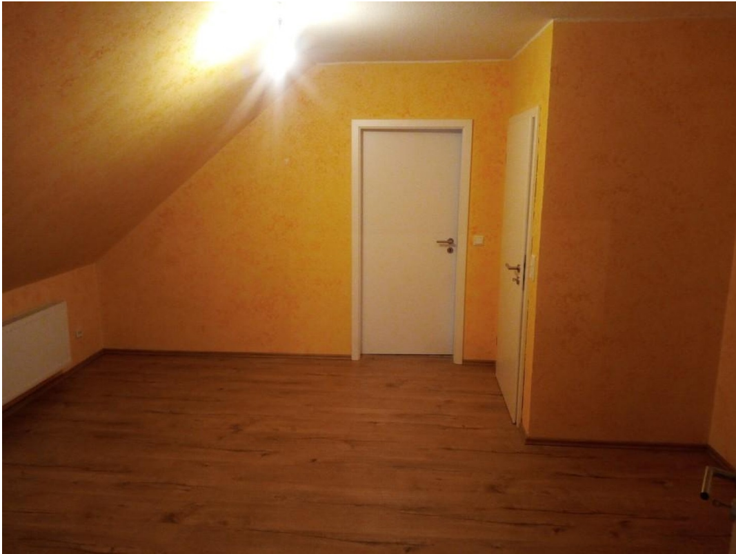
Flur/ Esszimmer 2