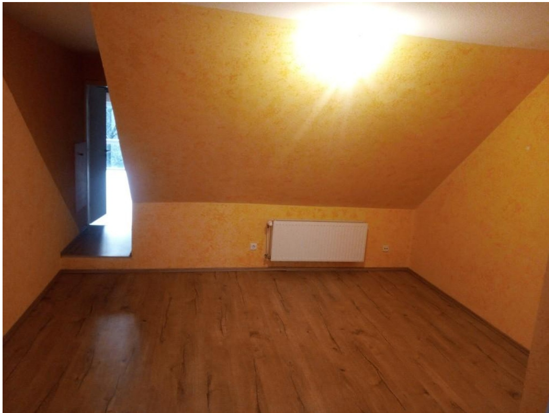
Flur/ Esszimmer 3