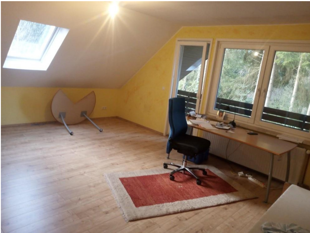
Zimmer West mit Loggia / Dachf