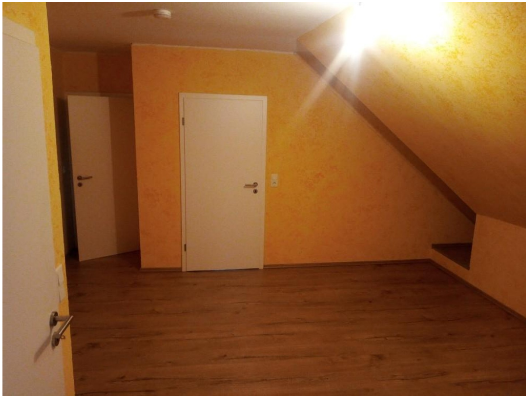
Flur/ Esszimmer 1