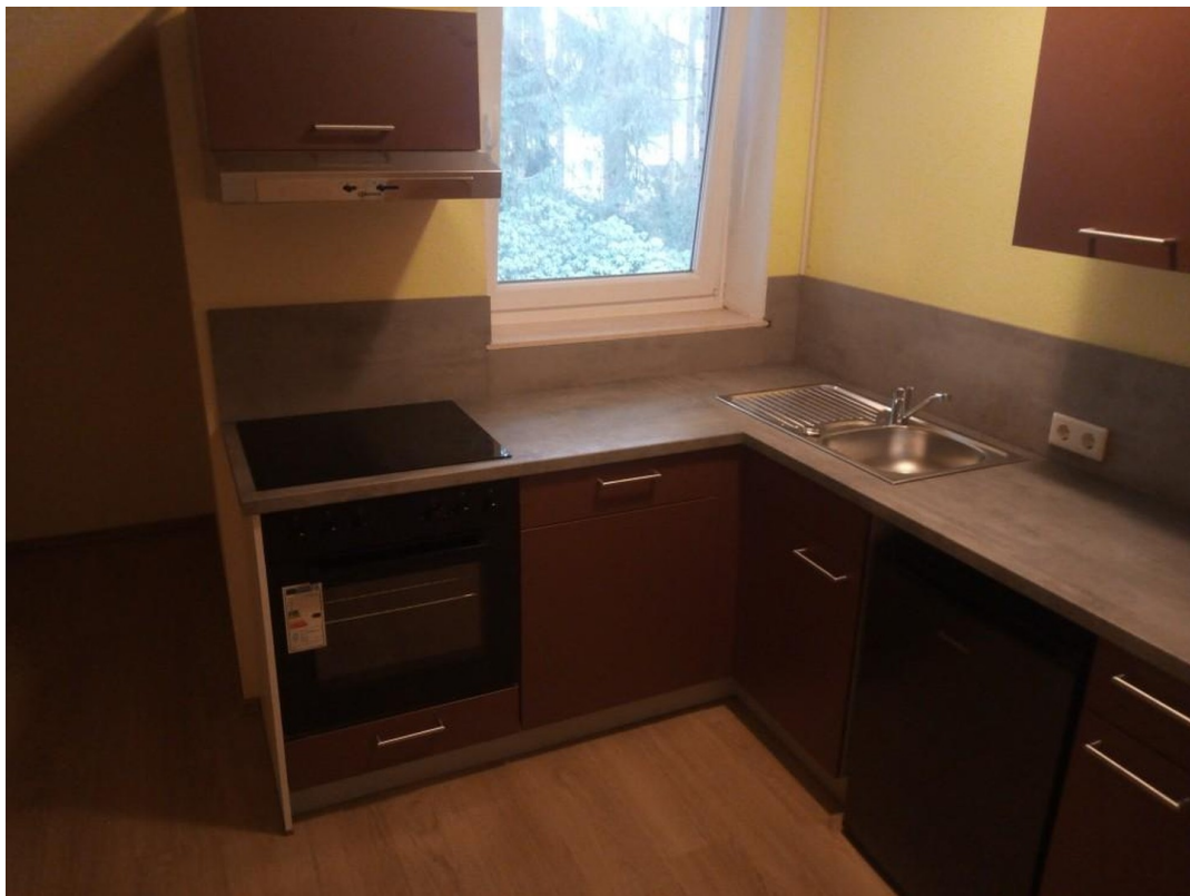
Küche mit Einbauküche neu