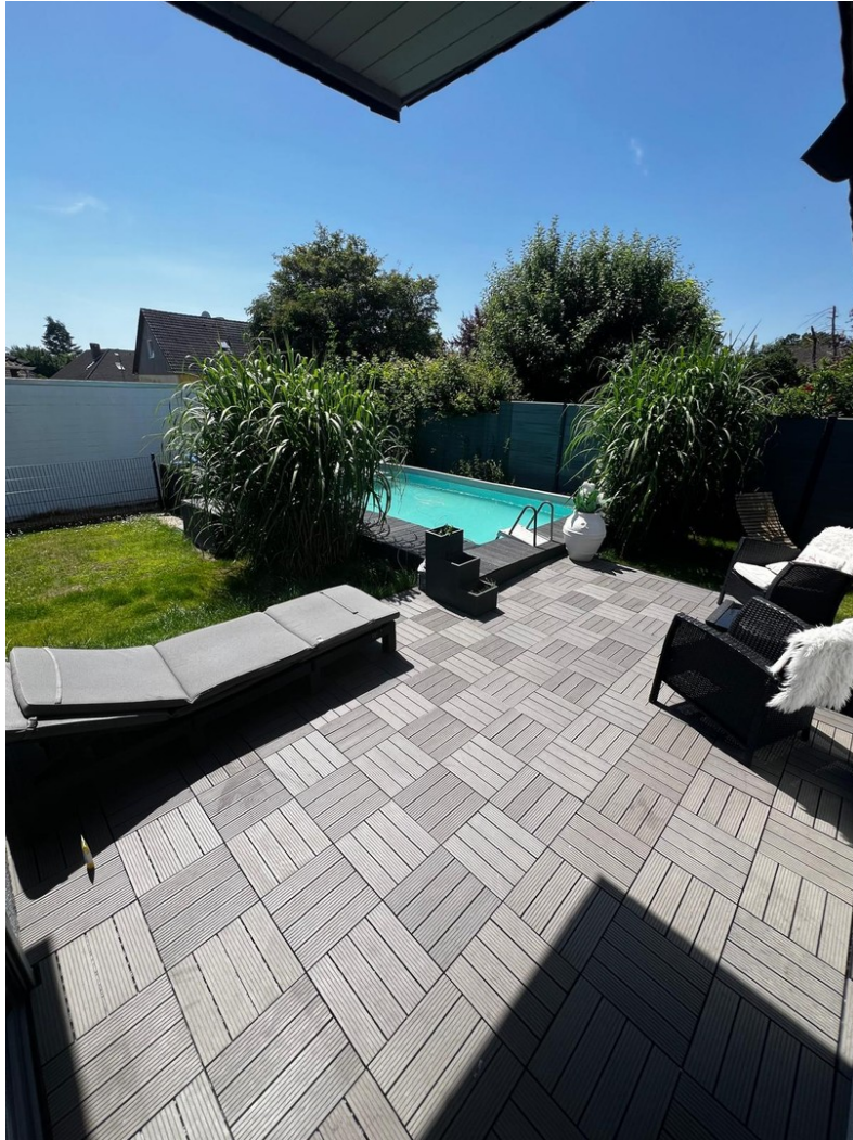
Terrasse und Pool