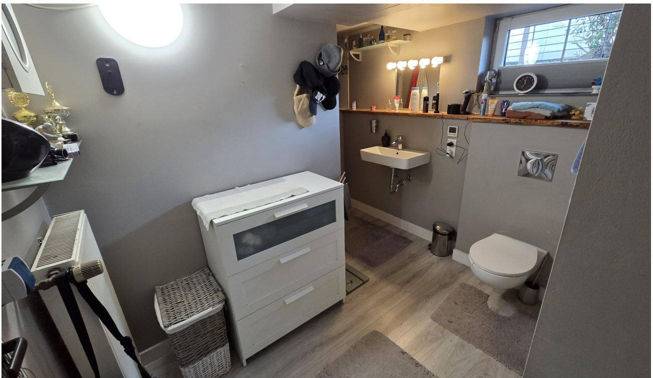
Bad im Keller