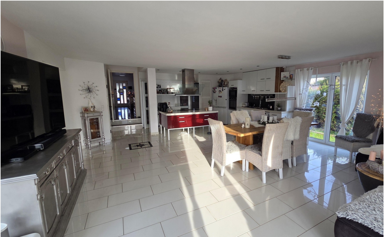
Wohn- und Essbereich 2