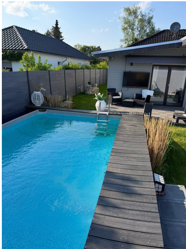
Pool mit Terrasse