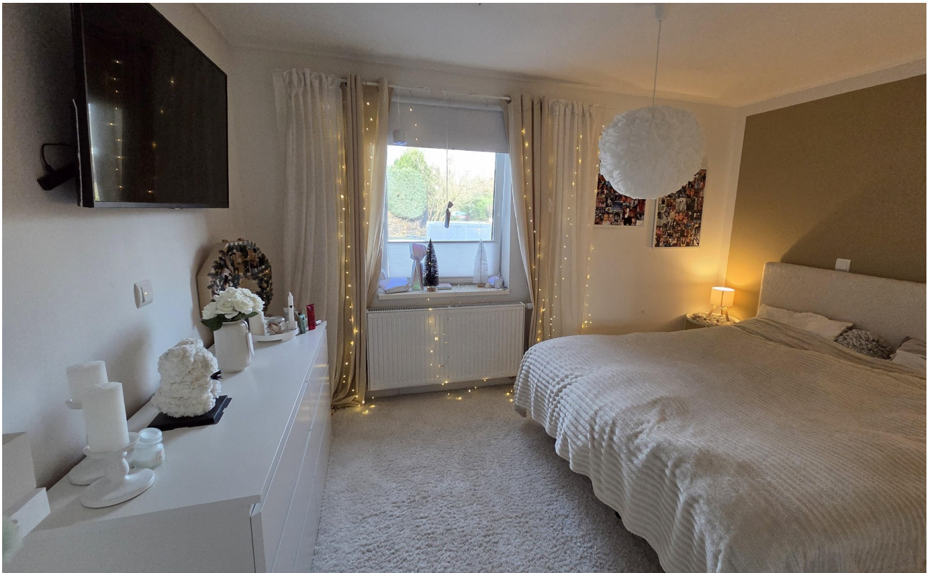
Schlafbereich Kind 1