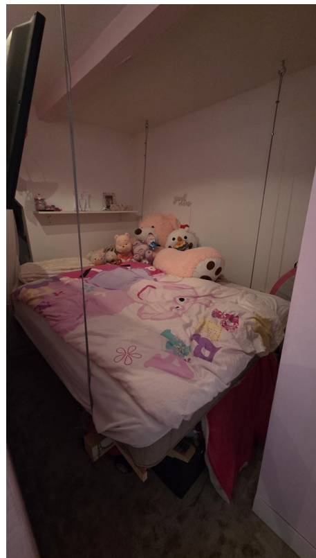
Schlafbereich Kind 2