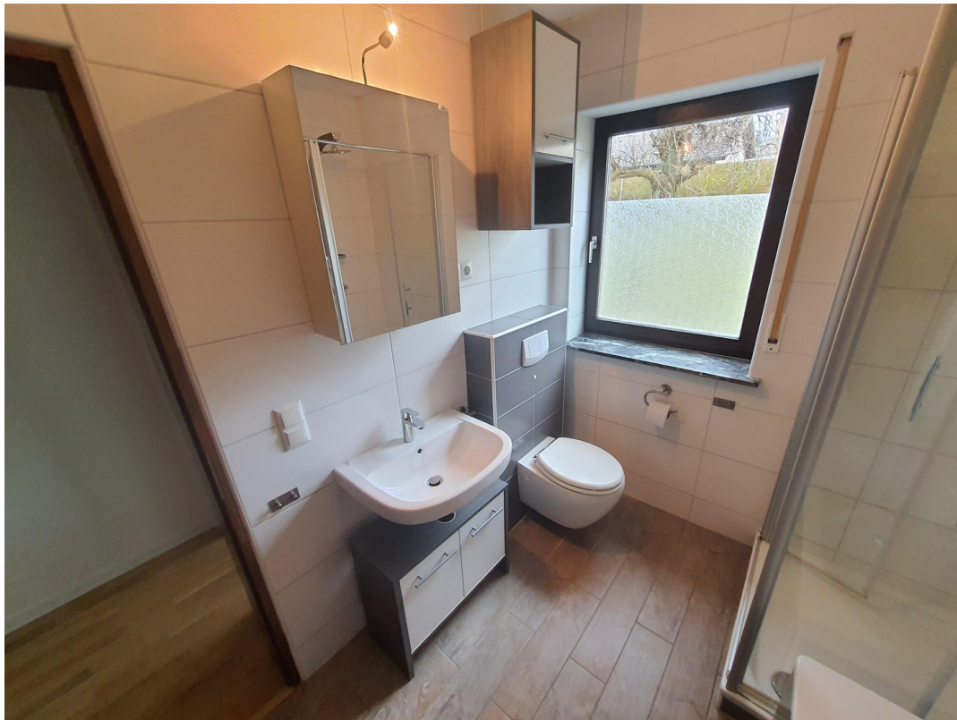
OG Badezimmer a