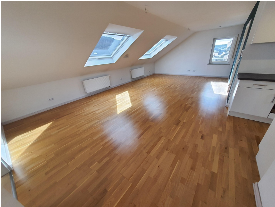
DG Wohnen a