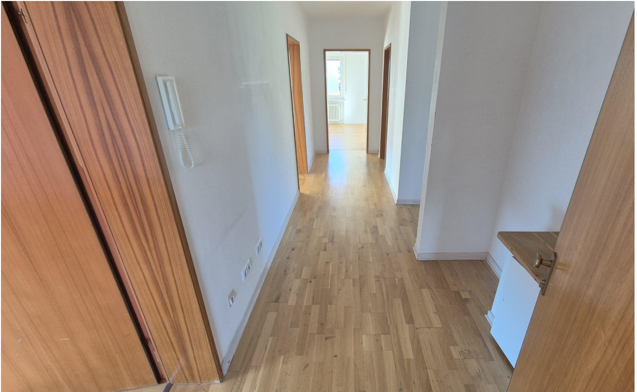
2.OG Flur Parkett