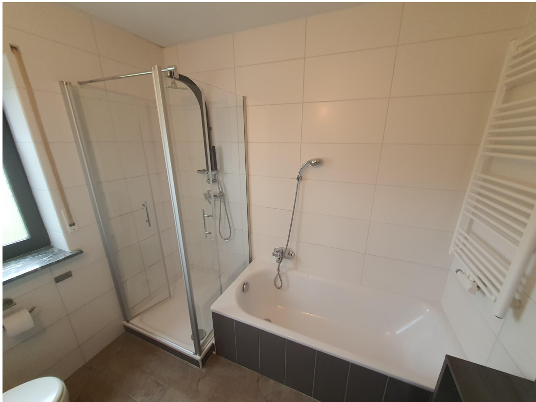
OG Badezimmer b