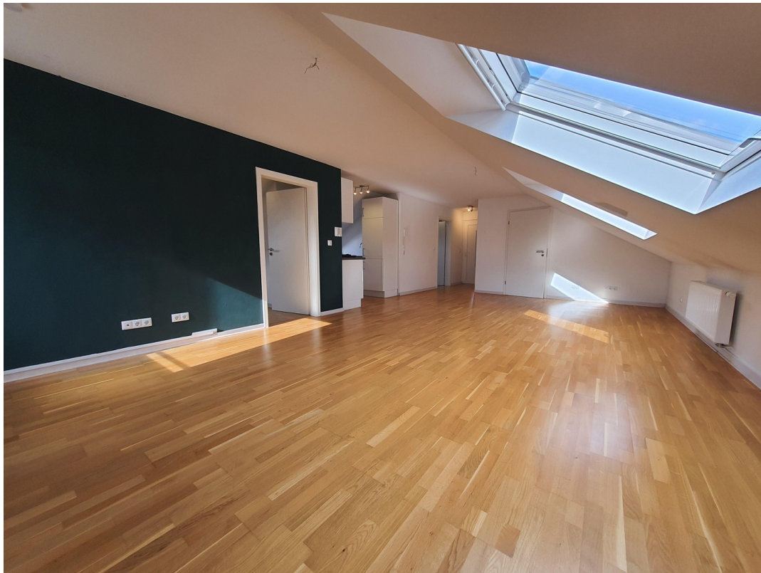
DG Wohnen b