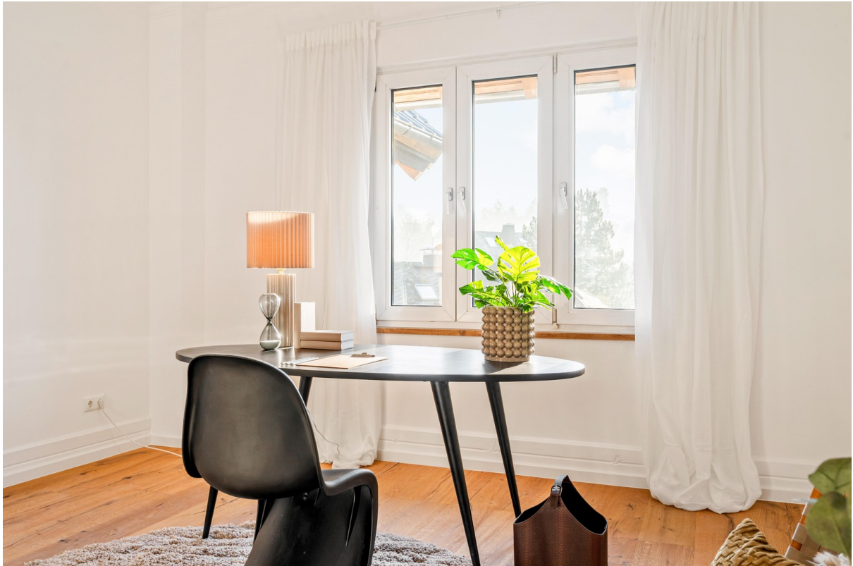
Arbeitszimmer / Kinderzimmer