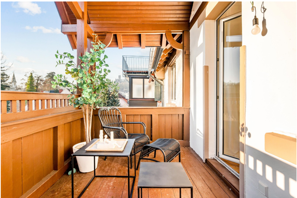
Balkjon mit Blick auf die Burg