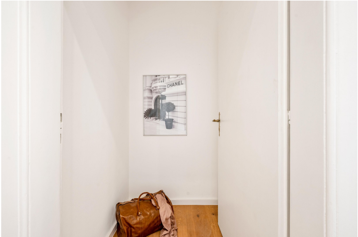
Abstellraum alt. Garderobe