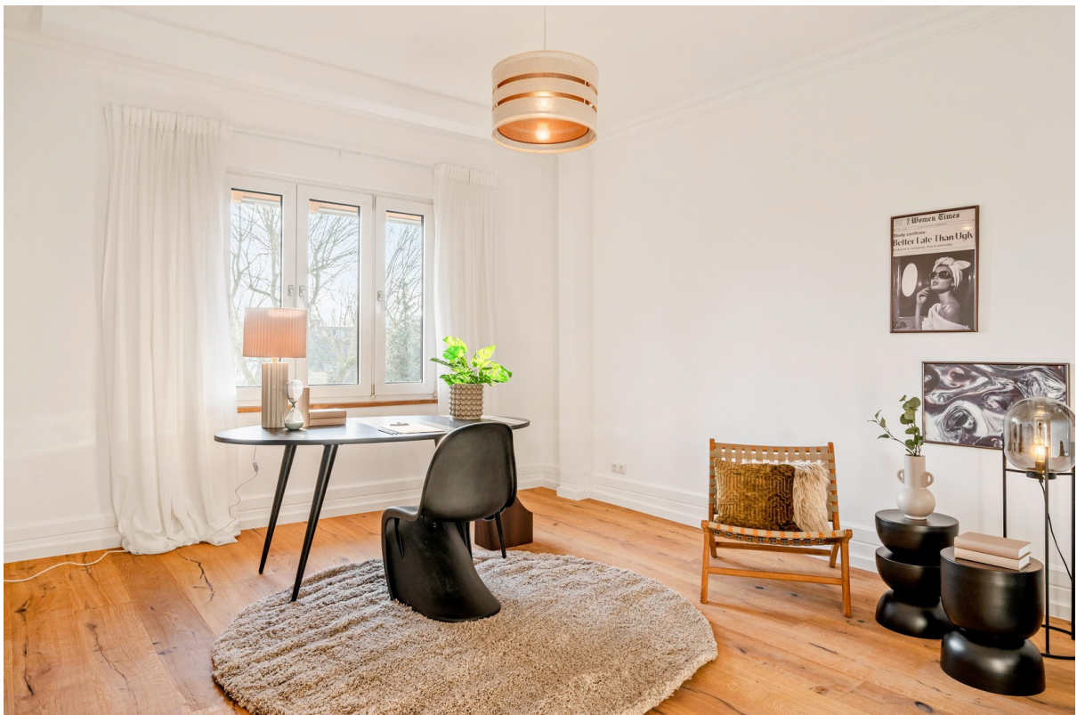
Arbeitszimmer / Kinderzimmer