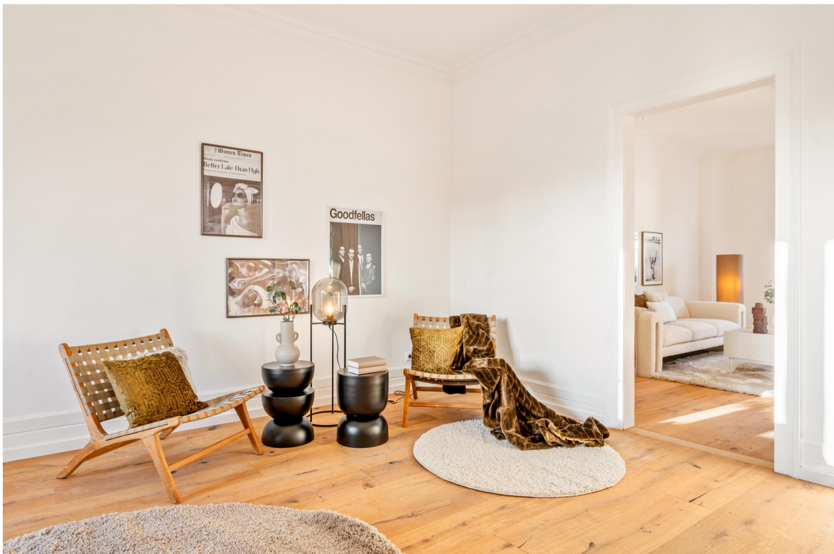
Arbeitszimmer / Kinderzimmer