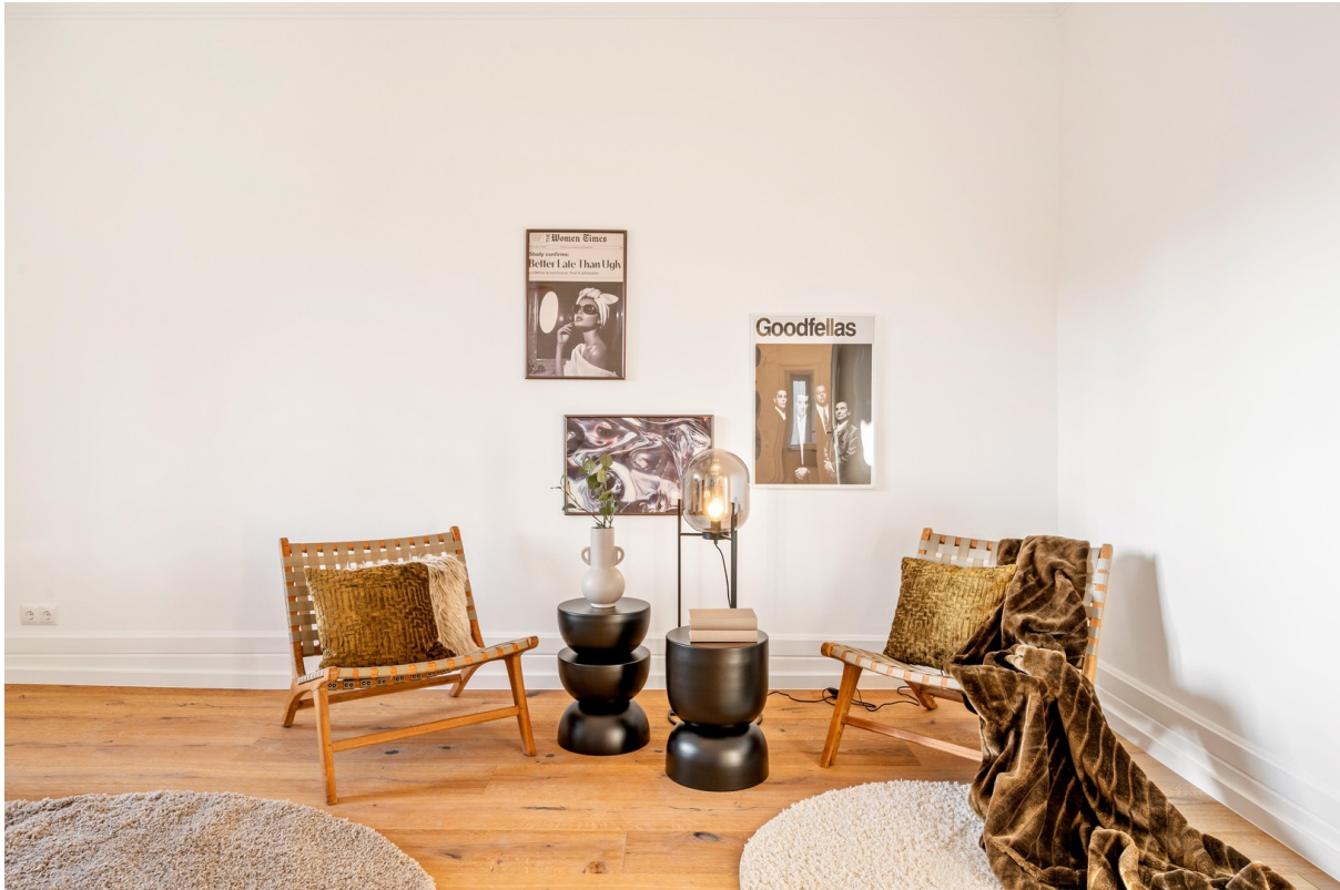
Arbeitszimmer / Kinderzimmer