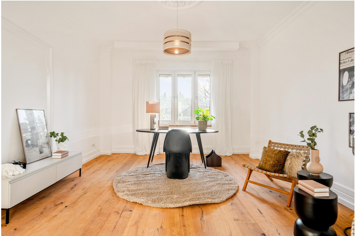
Arbeitszimmer / Kinderzimmer