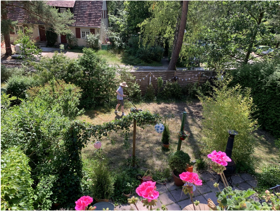
Summer in the city