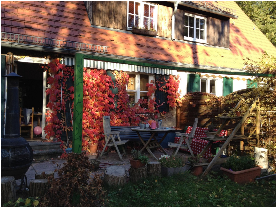
Leben in der Natur