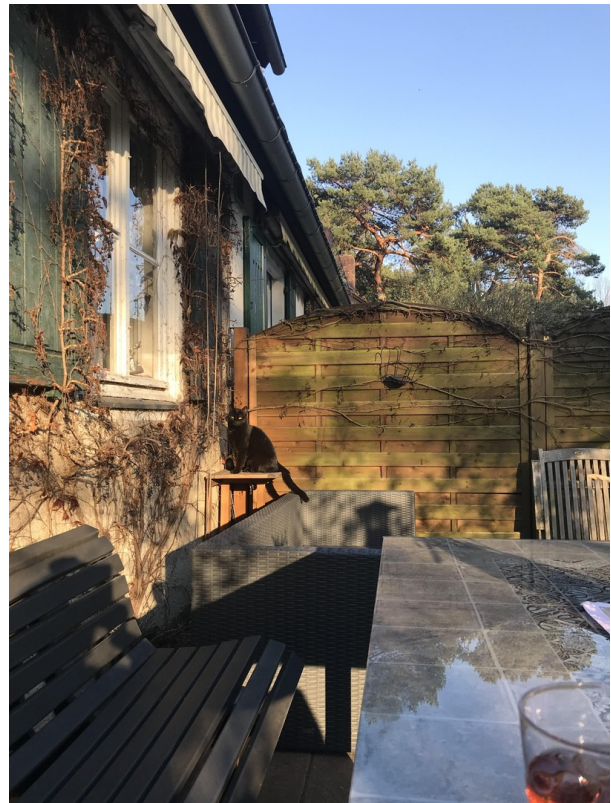
ein Zuhause für alle