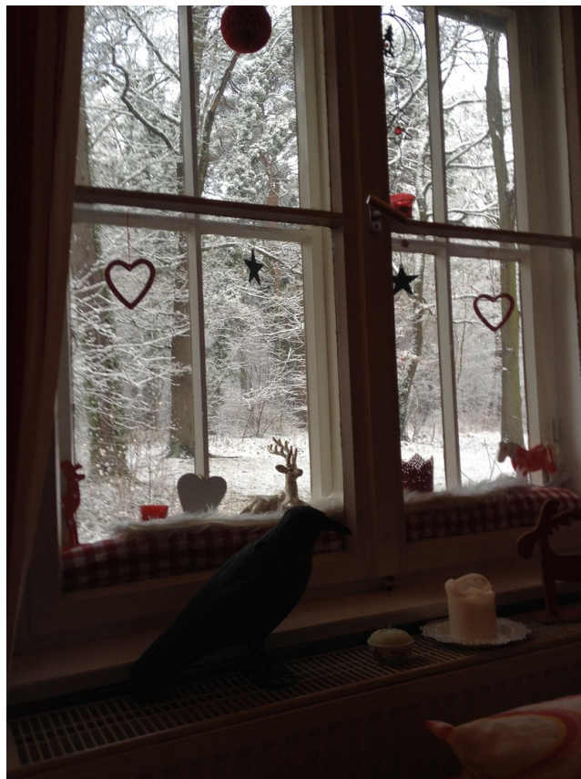
auf der Couch im Winter