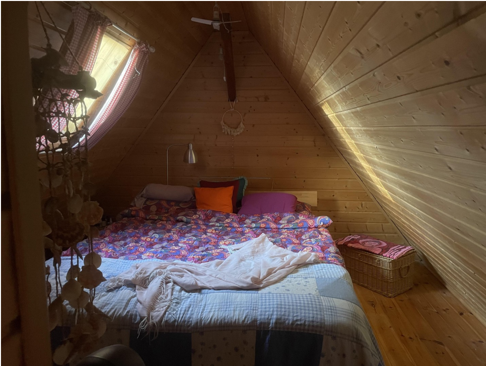
Schlafen im Mondschein