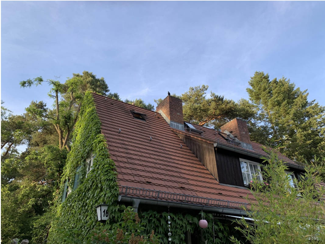
von der Sonnenseite