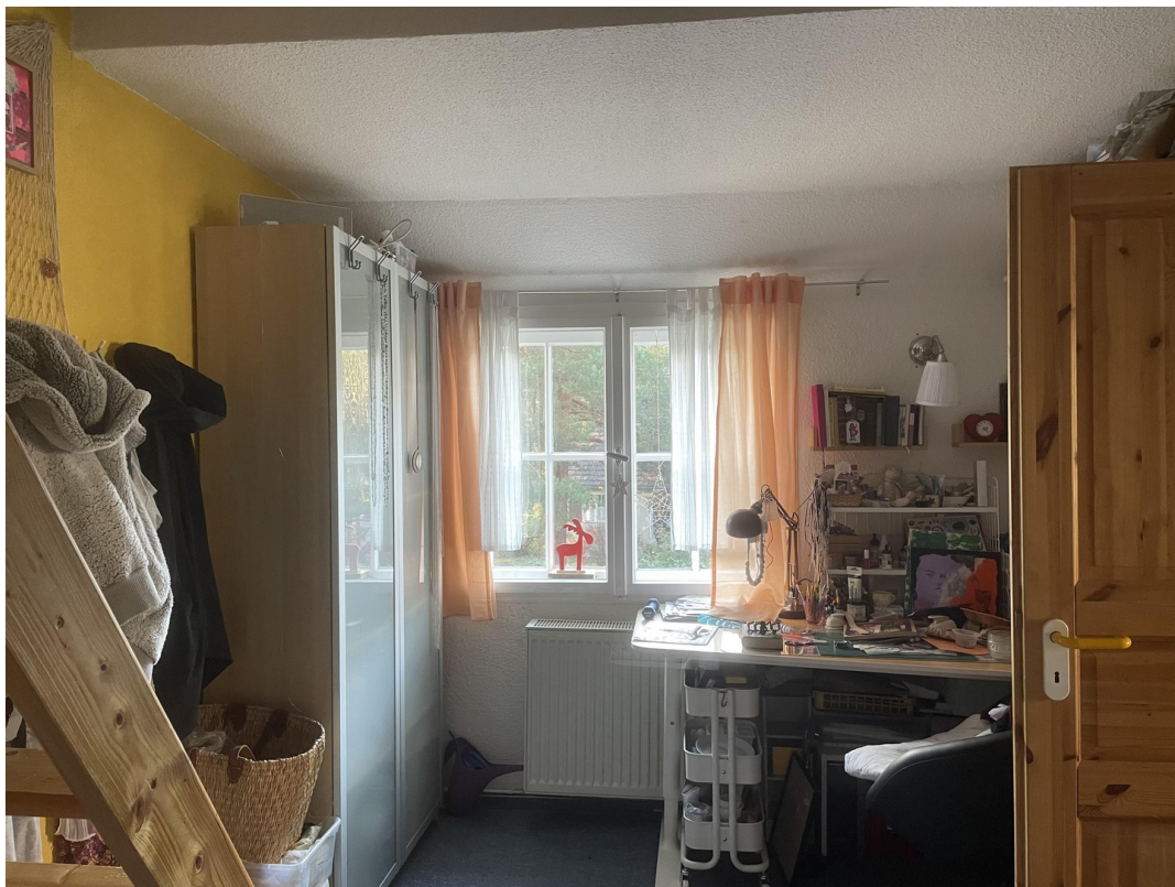
Treppenzimmer zum Dach