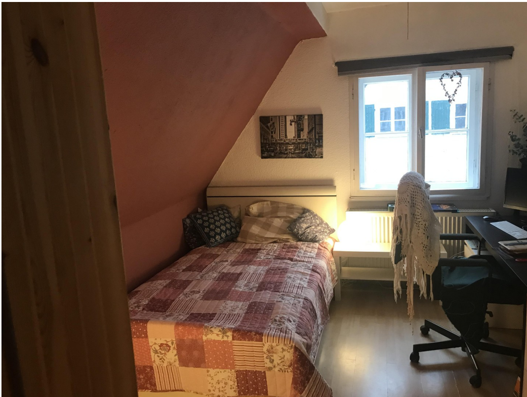
Büro und Gästezimmer