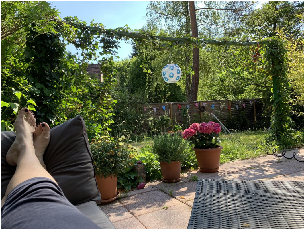
ein Ort zum Wohlfühlen