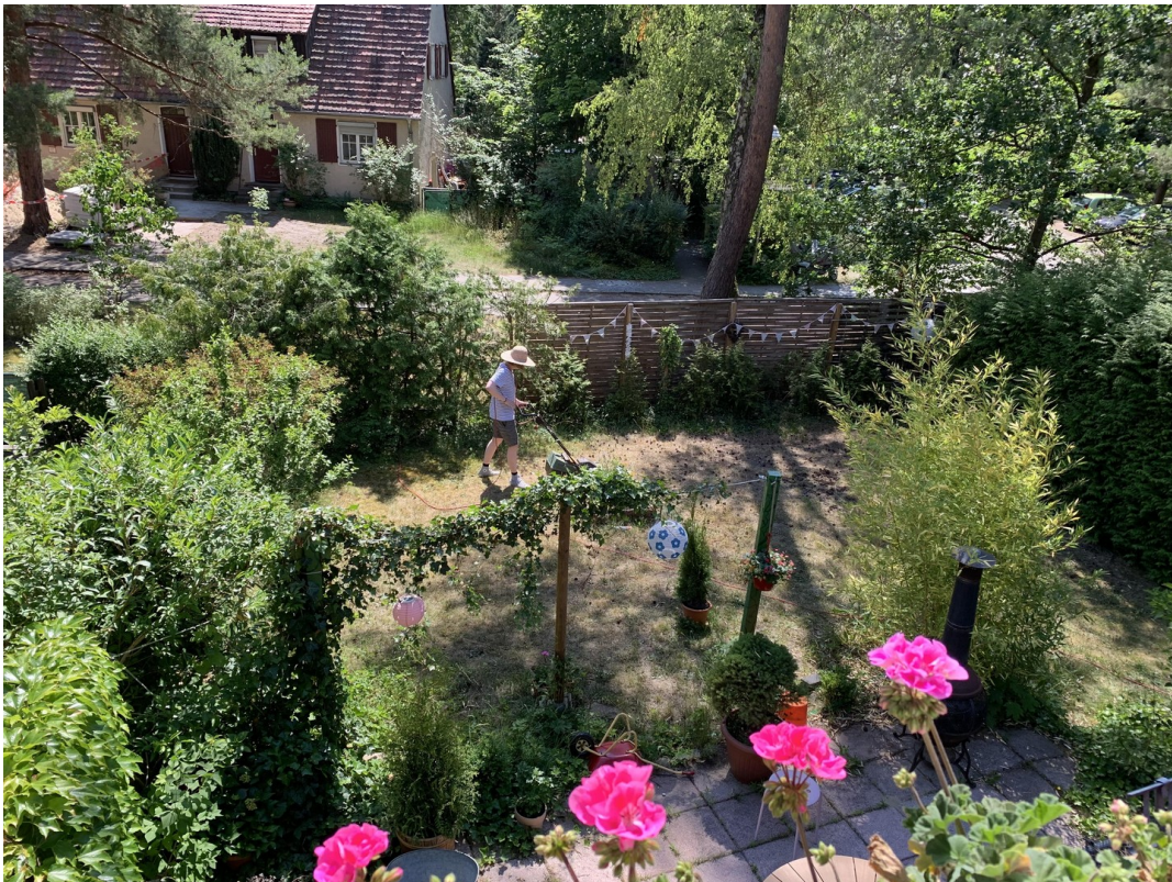
Summer in the city