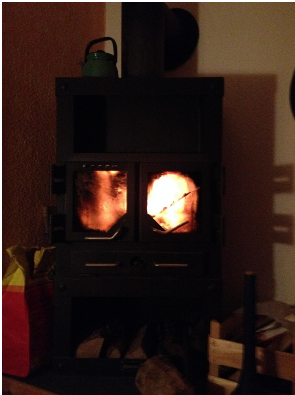
für die Gemütlichkeit