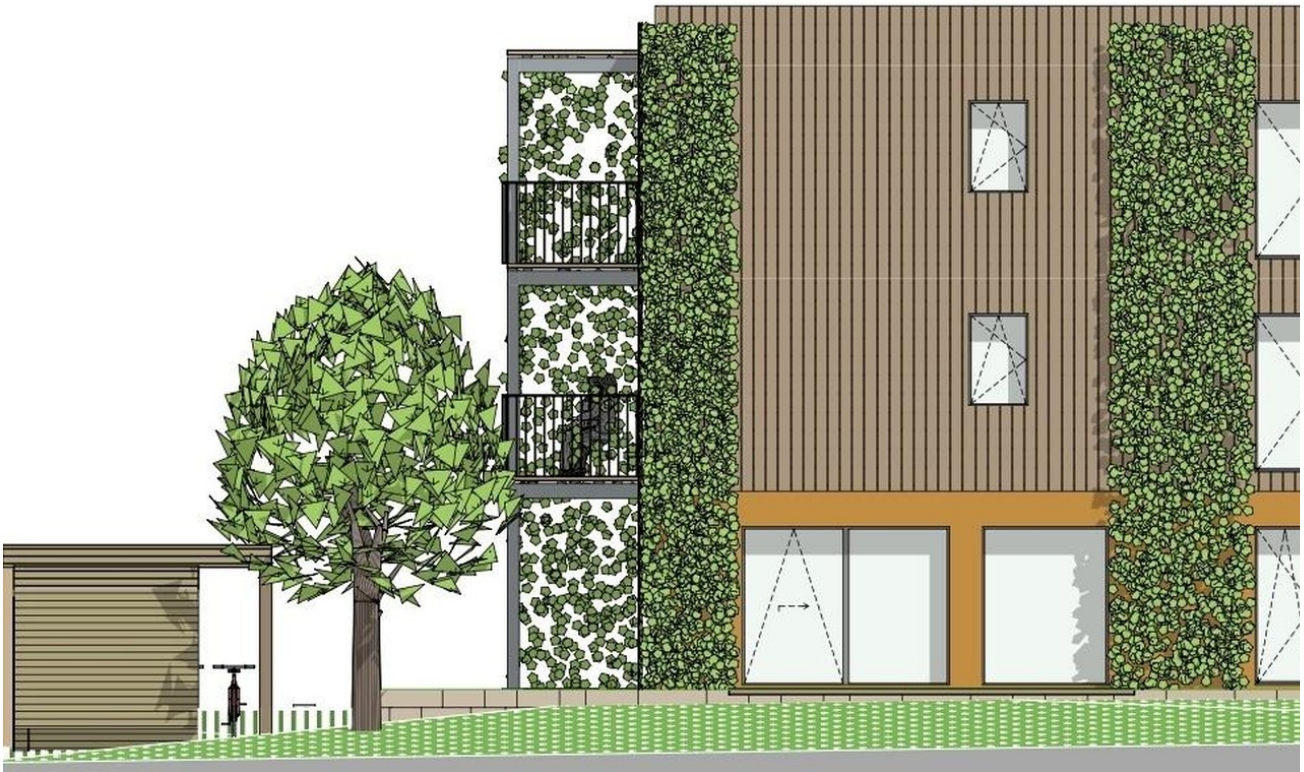
Entwurf Fassade Ost