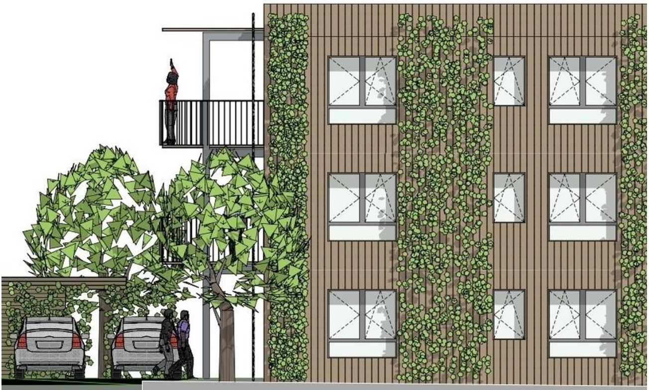
Entwurf Fassade West