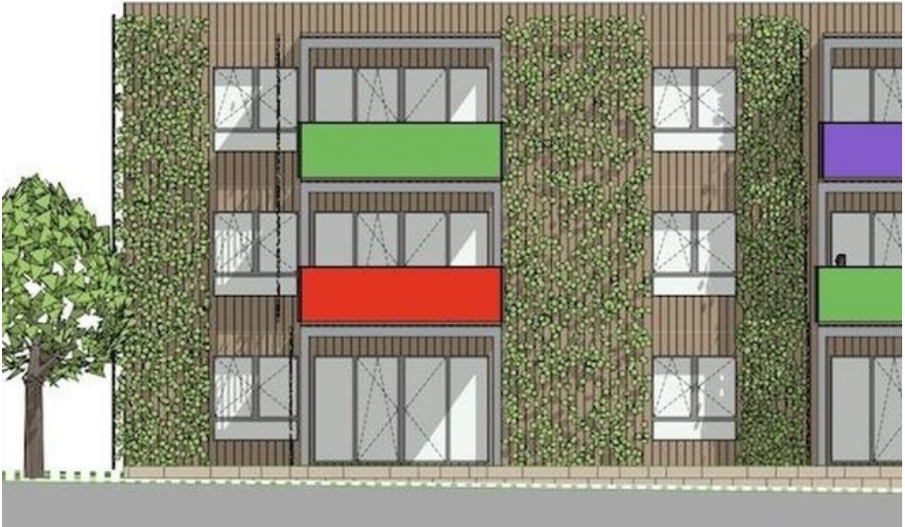
Entwurf Fassade Süd