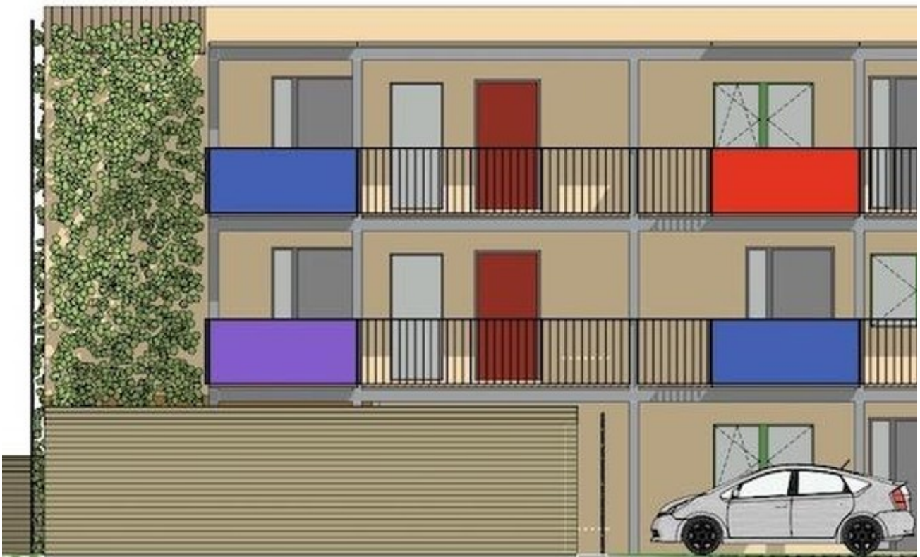
Entwurf Fassade Nord