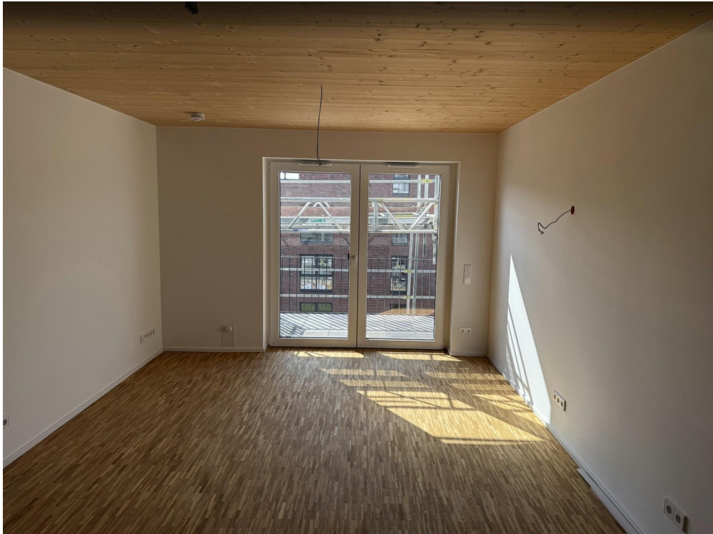
Ess- und Wohnzimmer