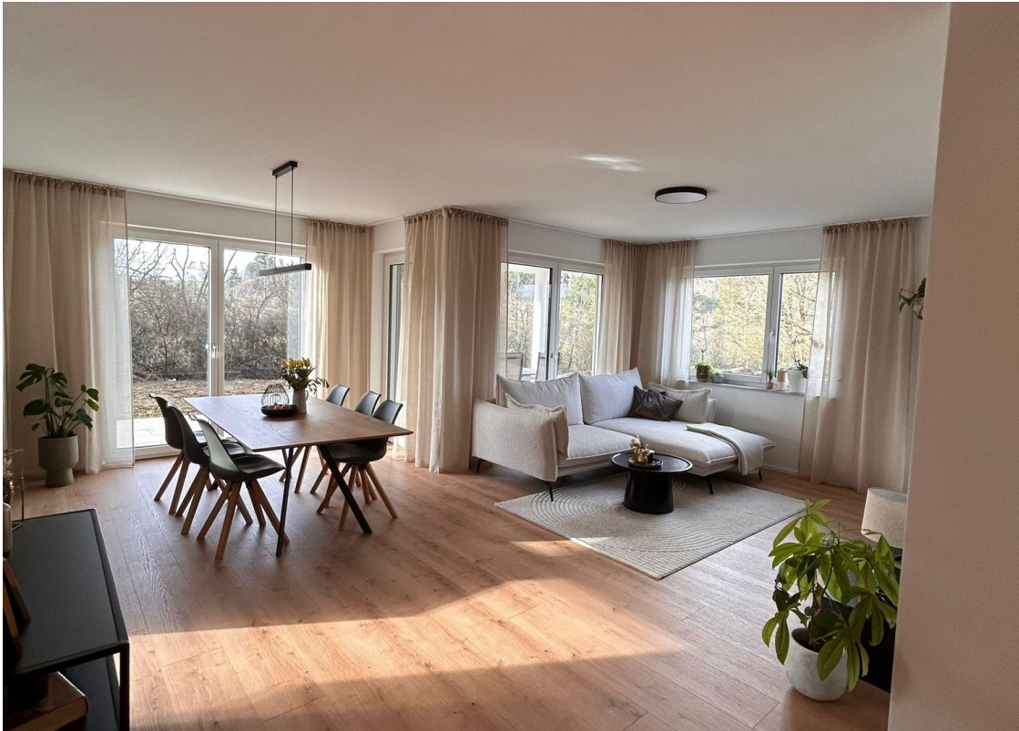
Musterfoto / nicht möbliert