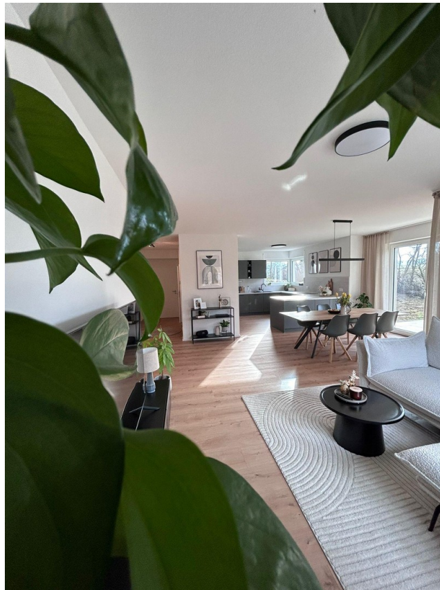
Musterfoto / nicht möbliert