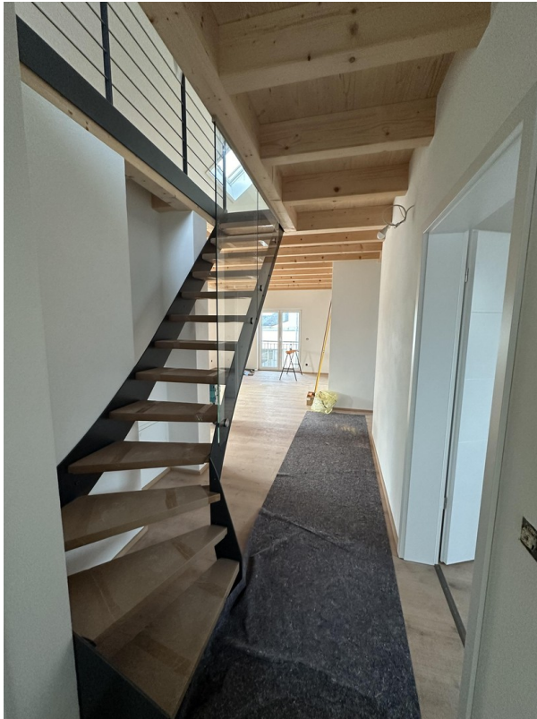
Musterfoto / Beispielbild