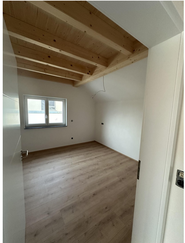
Musterfoto / Beispielbild