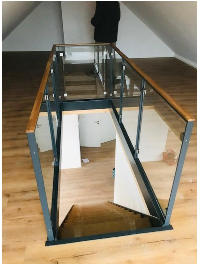
Musterfoto / Beispielbild