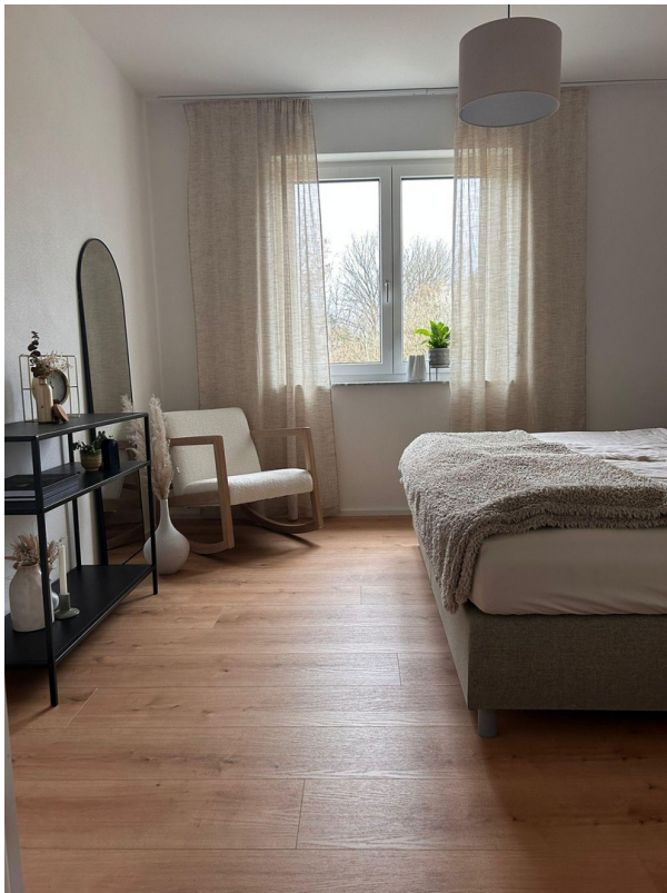
Musterfoto / nicht möbliert