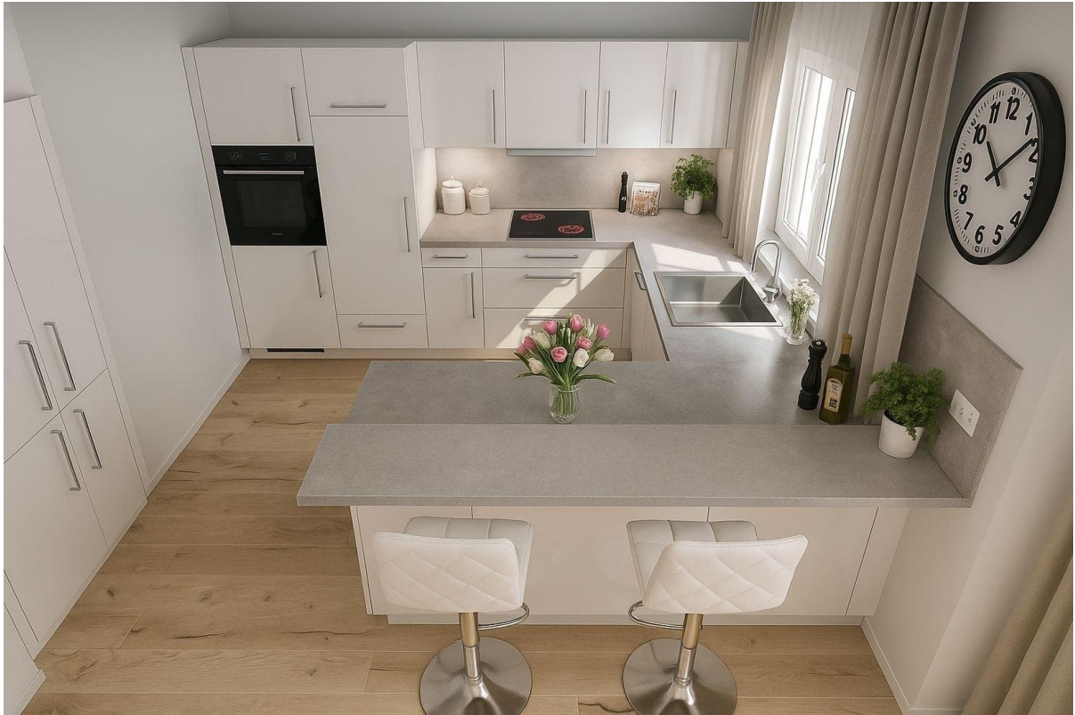
Musterfoto / nicht möbliert