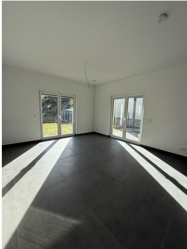
Wohnzimmer EG Muster