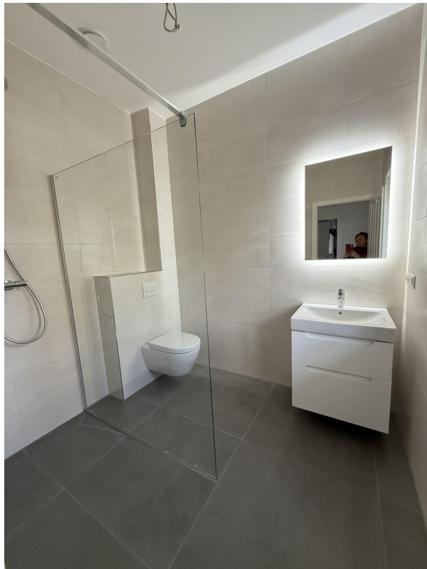
Gäste WC EG