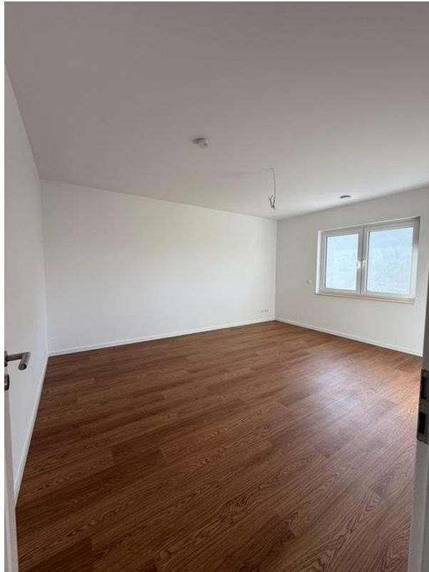
Schlafzimmer 2 Muster