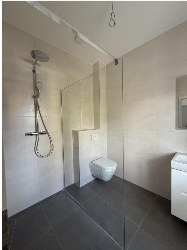
Gäste WC mit Dusche Muster