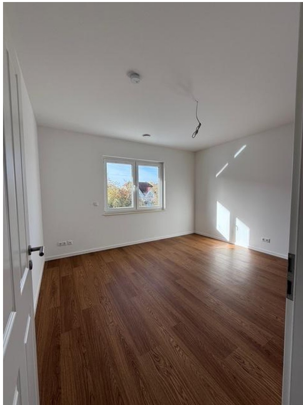
Schlafzimmer 3 Muster