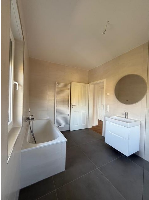
Bad oben, Muster