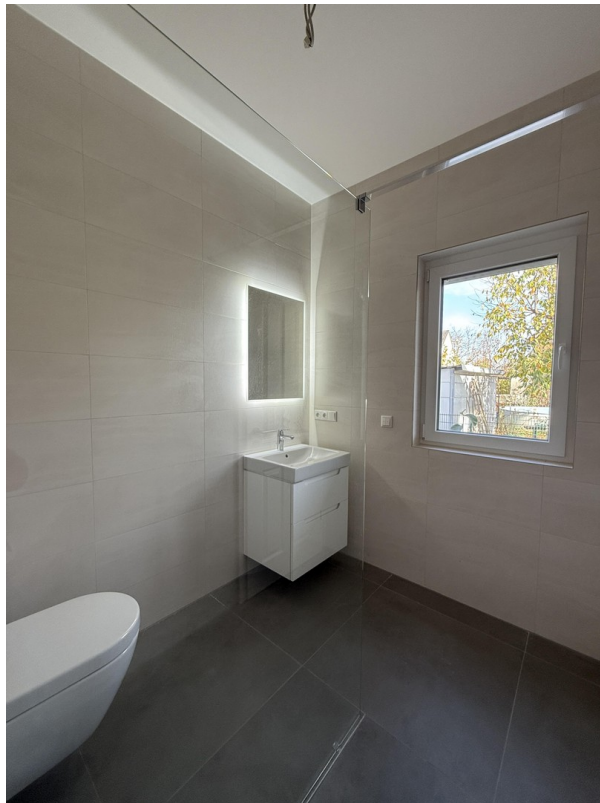
Gäste WC EG