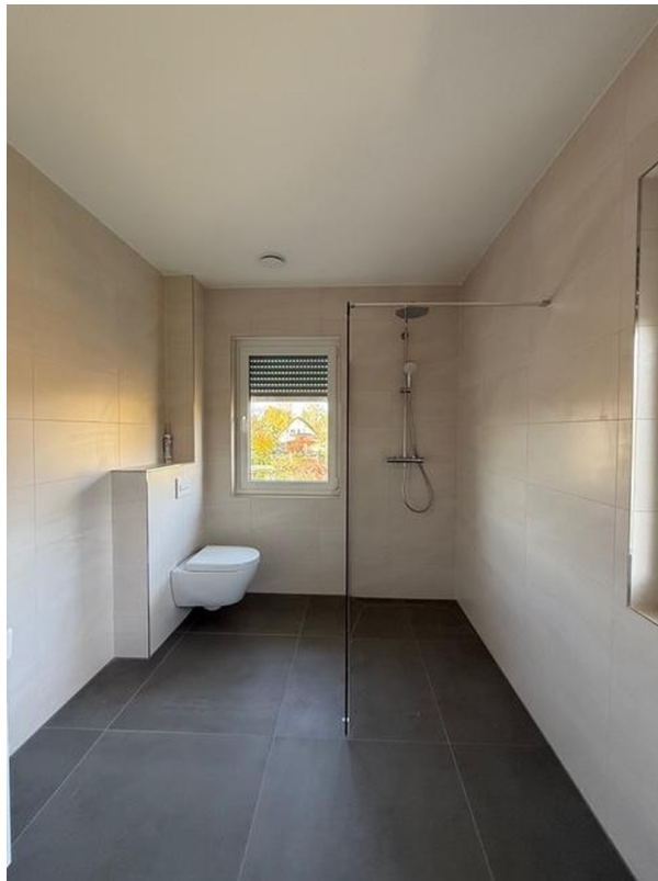
Bad oben, Muster