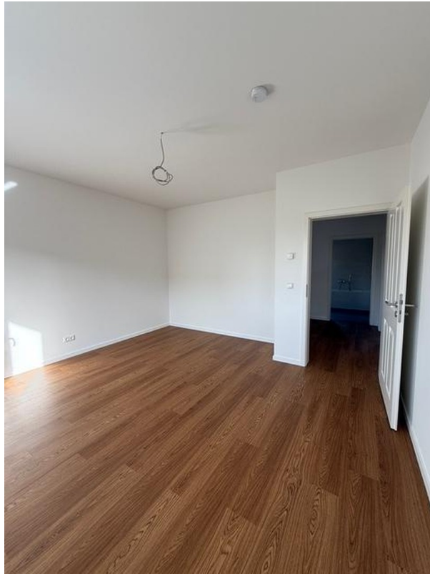
Schlafzimmer 3 Muster