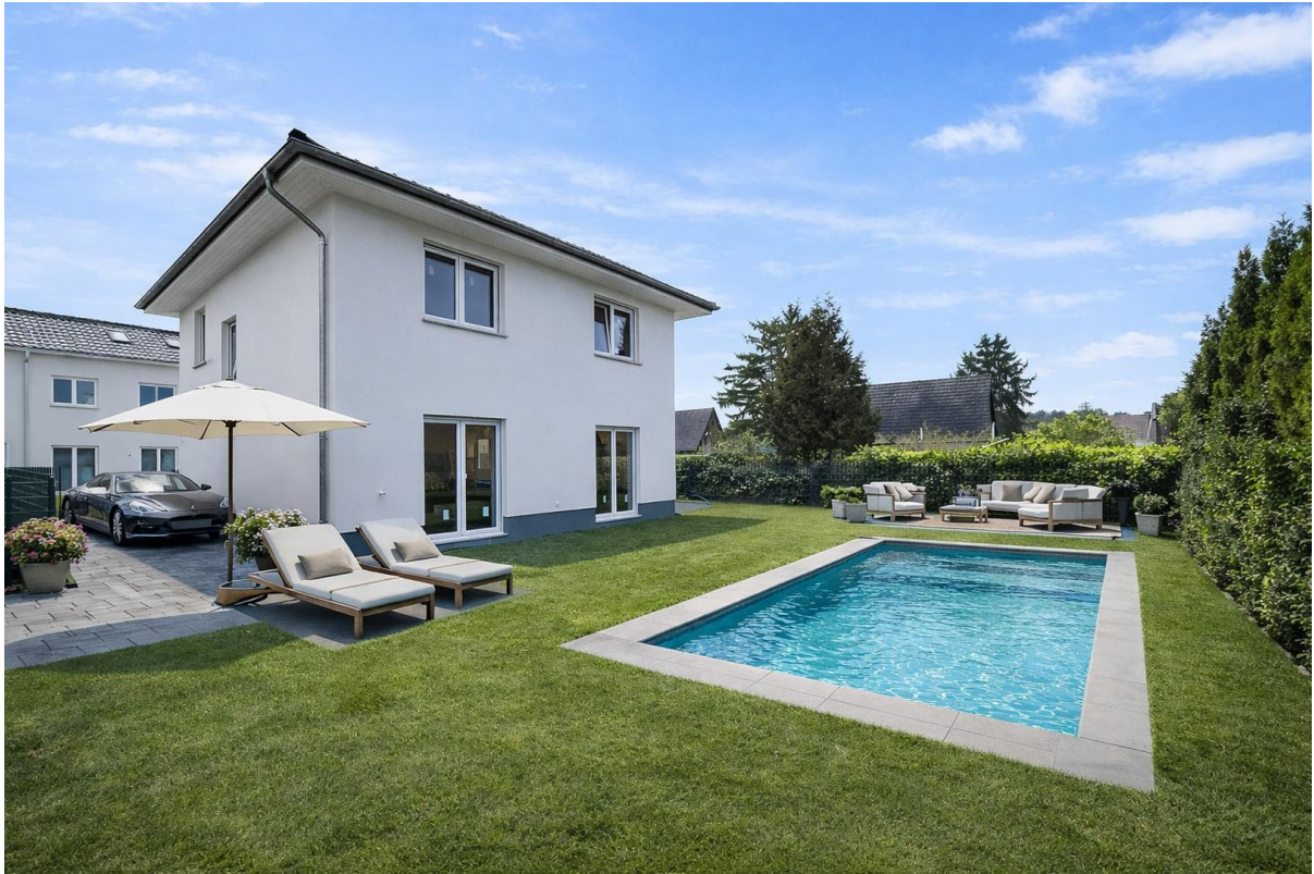
Ansicht Beispiel mit Pool