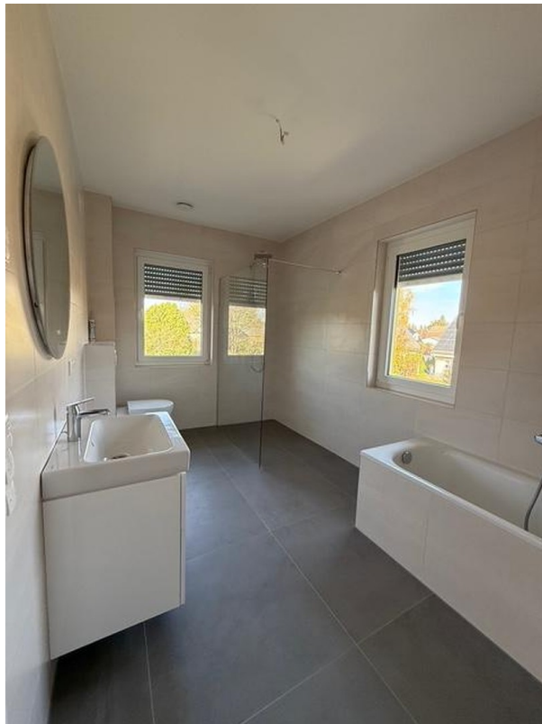
Bad oben, Muster