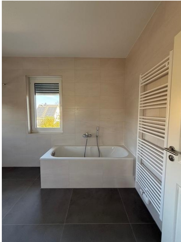
Bad oben, Muster