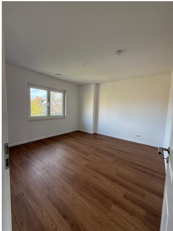
Schlafzimmer 1 Muster