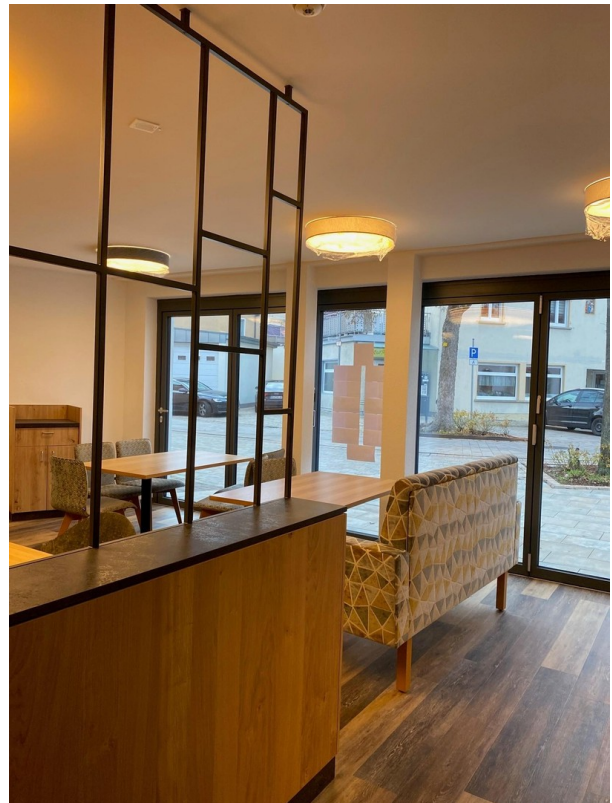
Glasfront mit Schiebeelementen