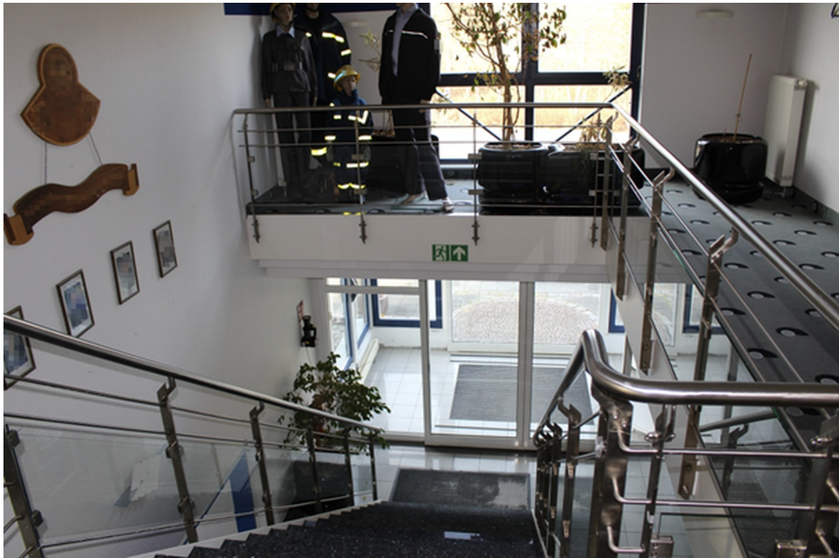
Eingangsbereich 2 - Werkshalle