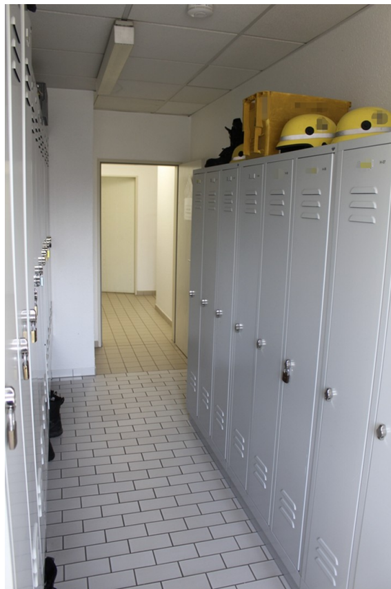
Werkshalle - Umkleiden