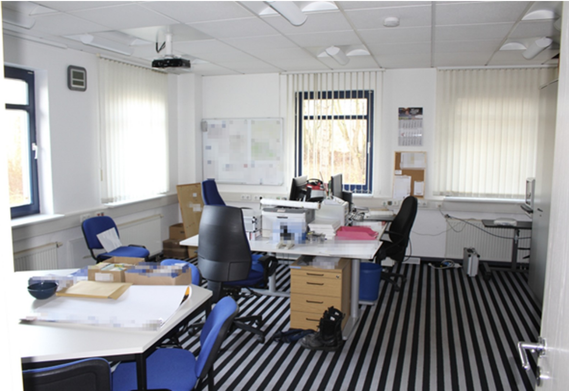
Büros - Werkshalle