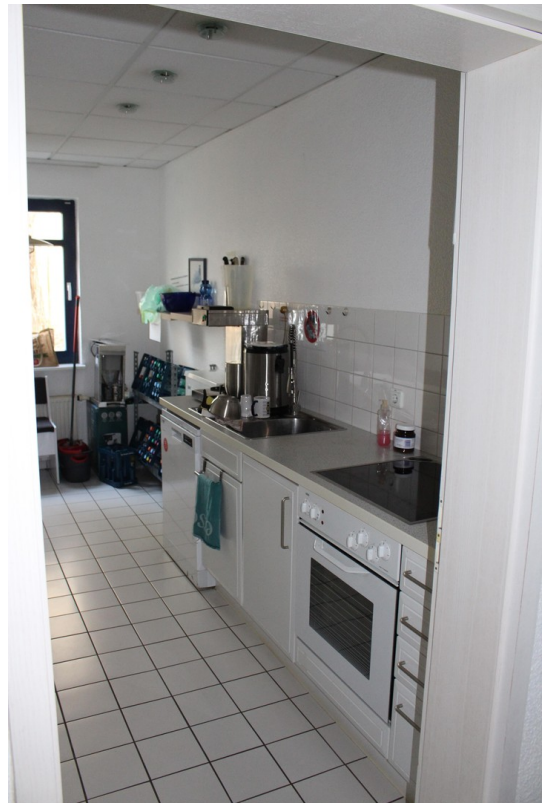
Werkshalle - 1 der 2 Küchen