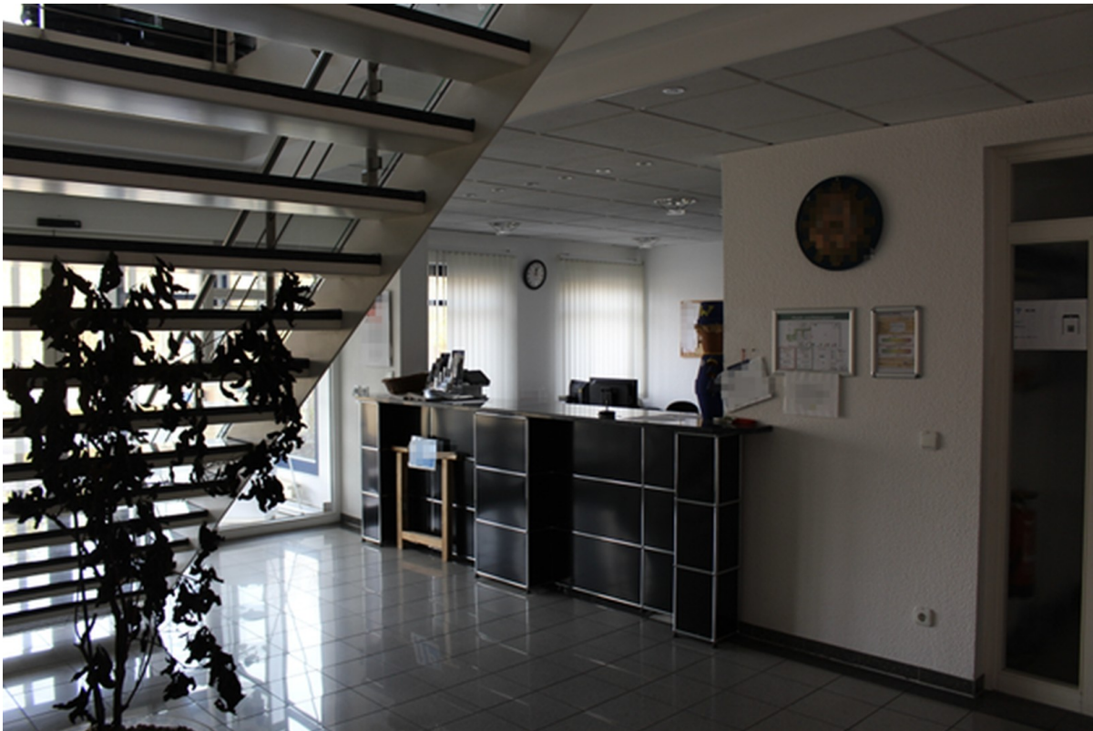
Eingangsbereich 1 - Werkshalle