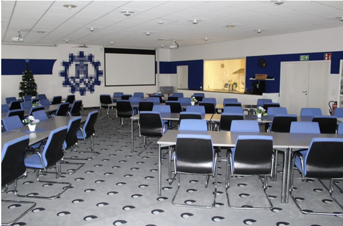
Werkshalle - Versammlungsraum