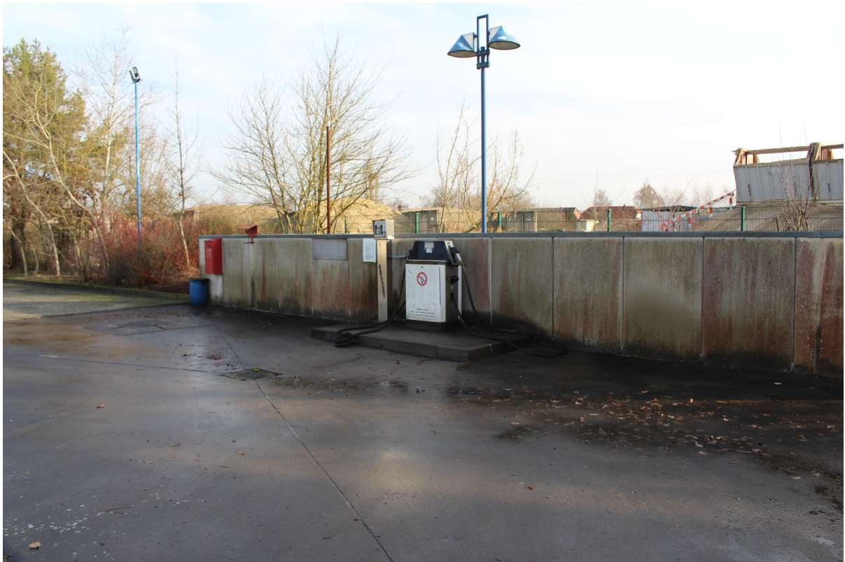
Werkplatz - Tankstelle