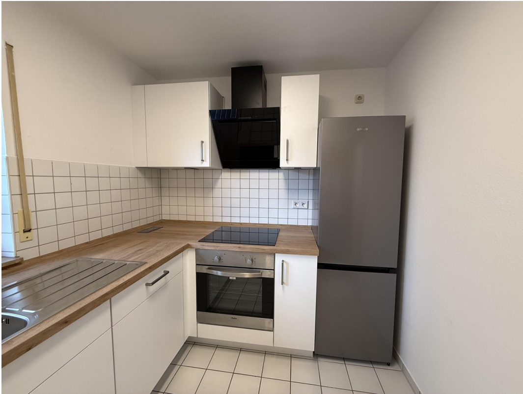
Küchenbereich mit Einbauküche