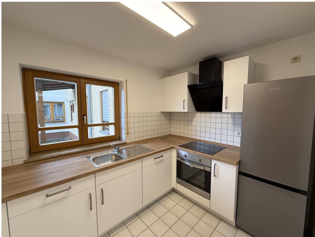
Küchenbereich mit Einbauküche