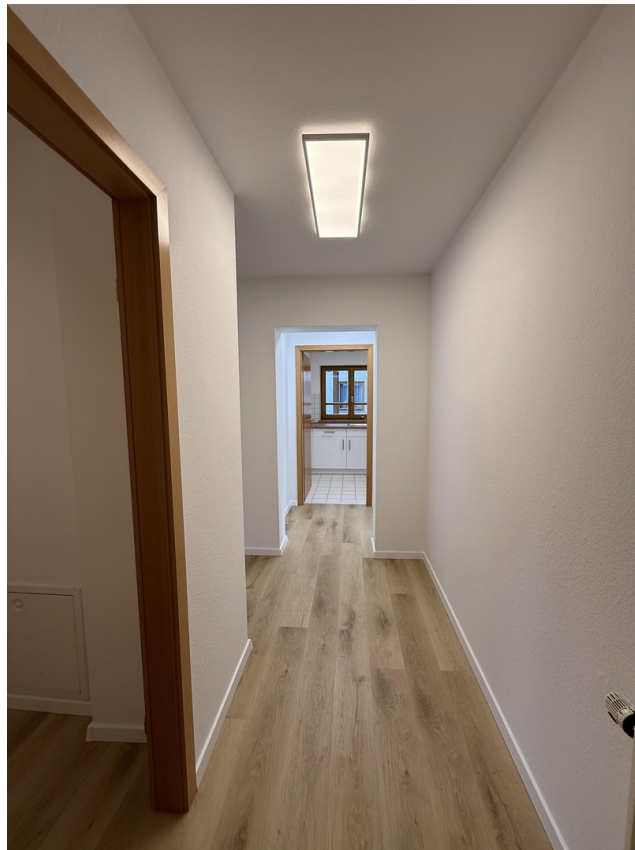
Eingangsbereich / Flur