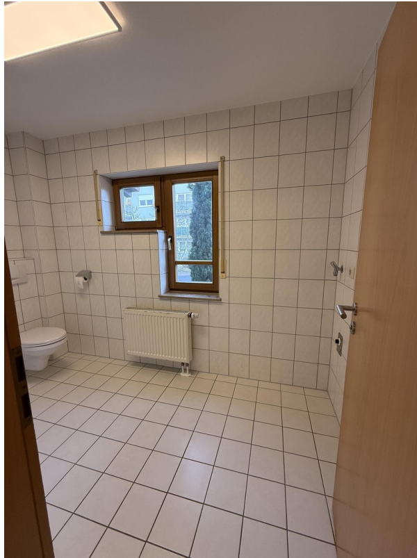
Tageslichtbad mit Fenstern