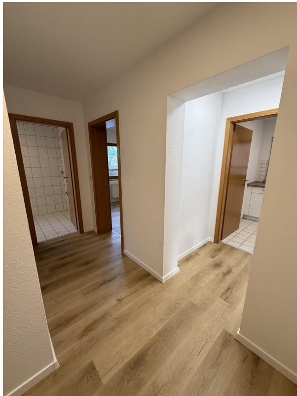
Eingangsbereich / Flur