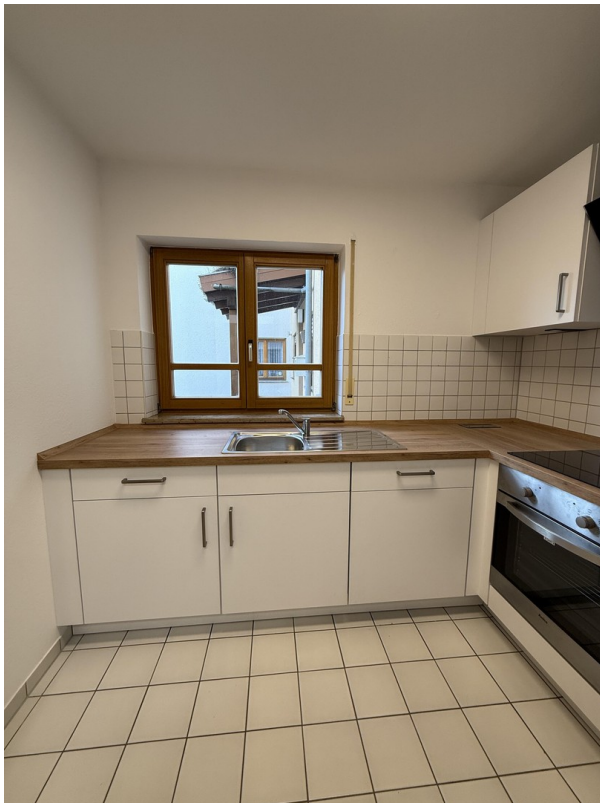
Küchenbereich mit Einbauküche