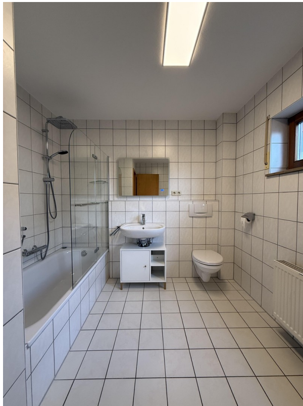
Tageslichtbad mit Fenstern