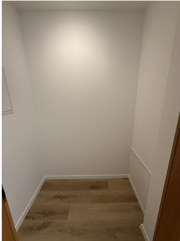
Abstellraum im Eingangsbereich