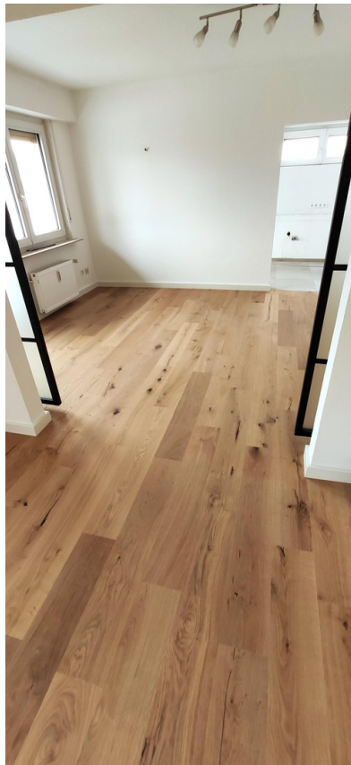
Wohnz., Blick auf Essbereich