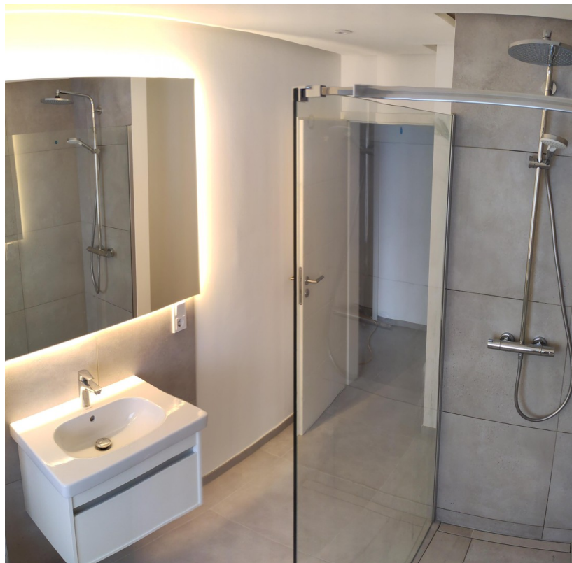
Bad / Dusche