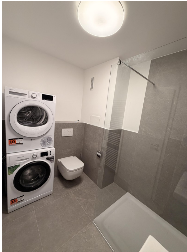
Waschmaschine & Trockner