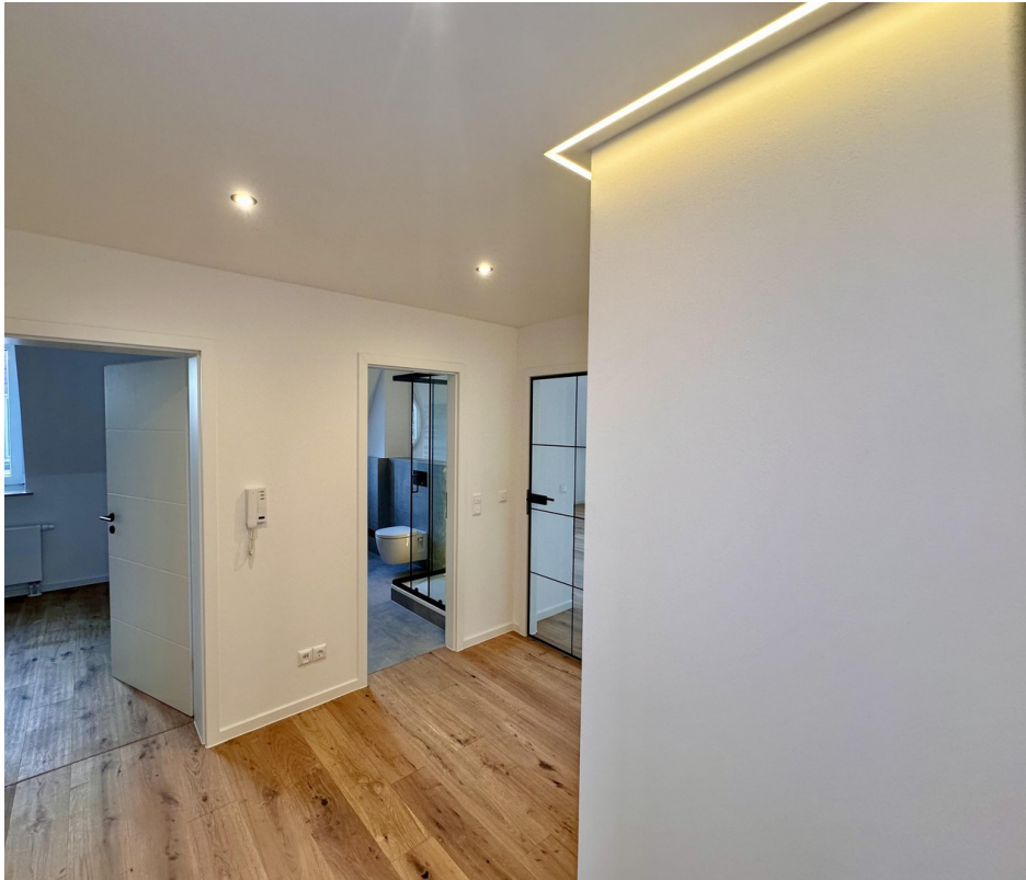
Flur Richtung Wohnzimmer