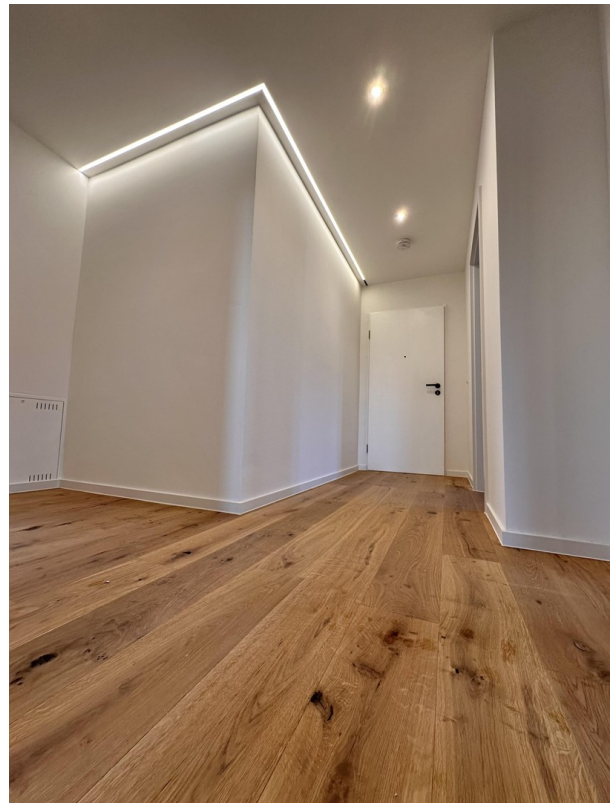
Flur Richtung Ein/Ausgangstür