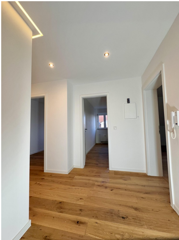
Wohnzimmer Richtung Flur