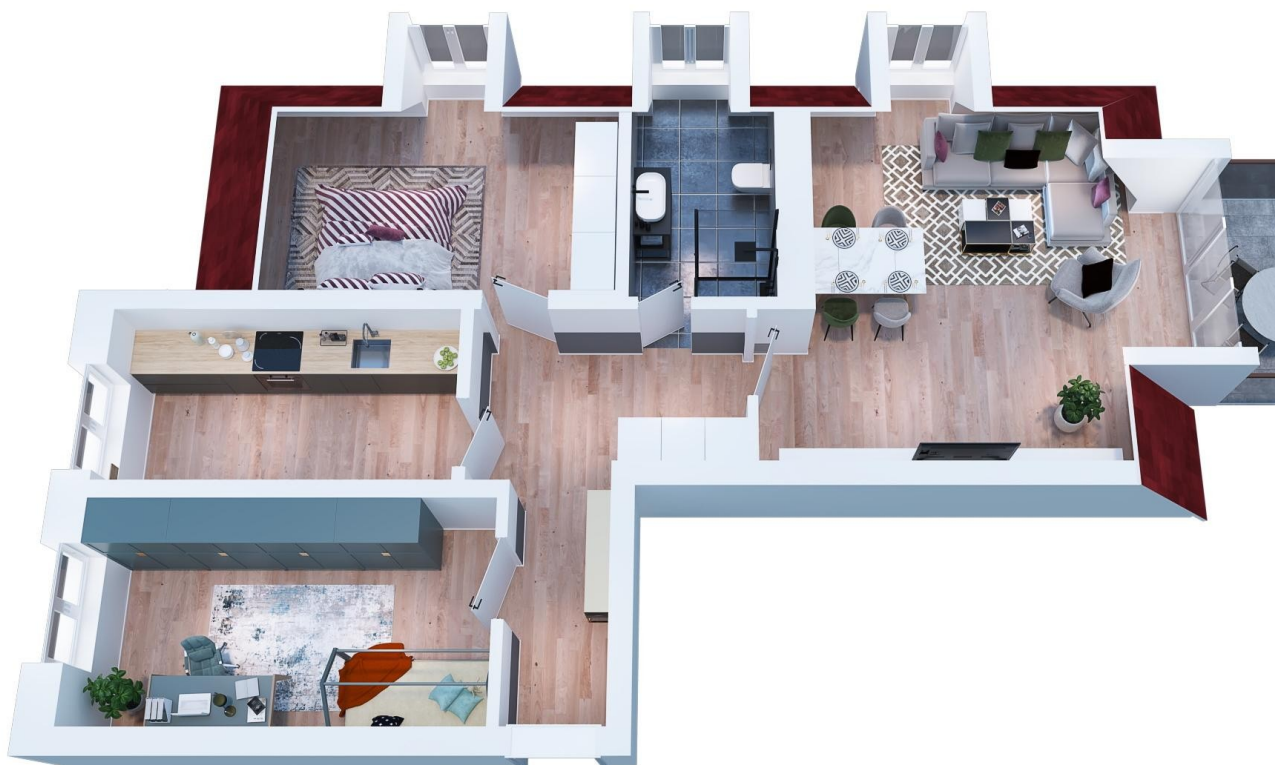
Grundriss mit Einrichtung