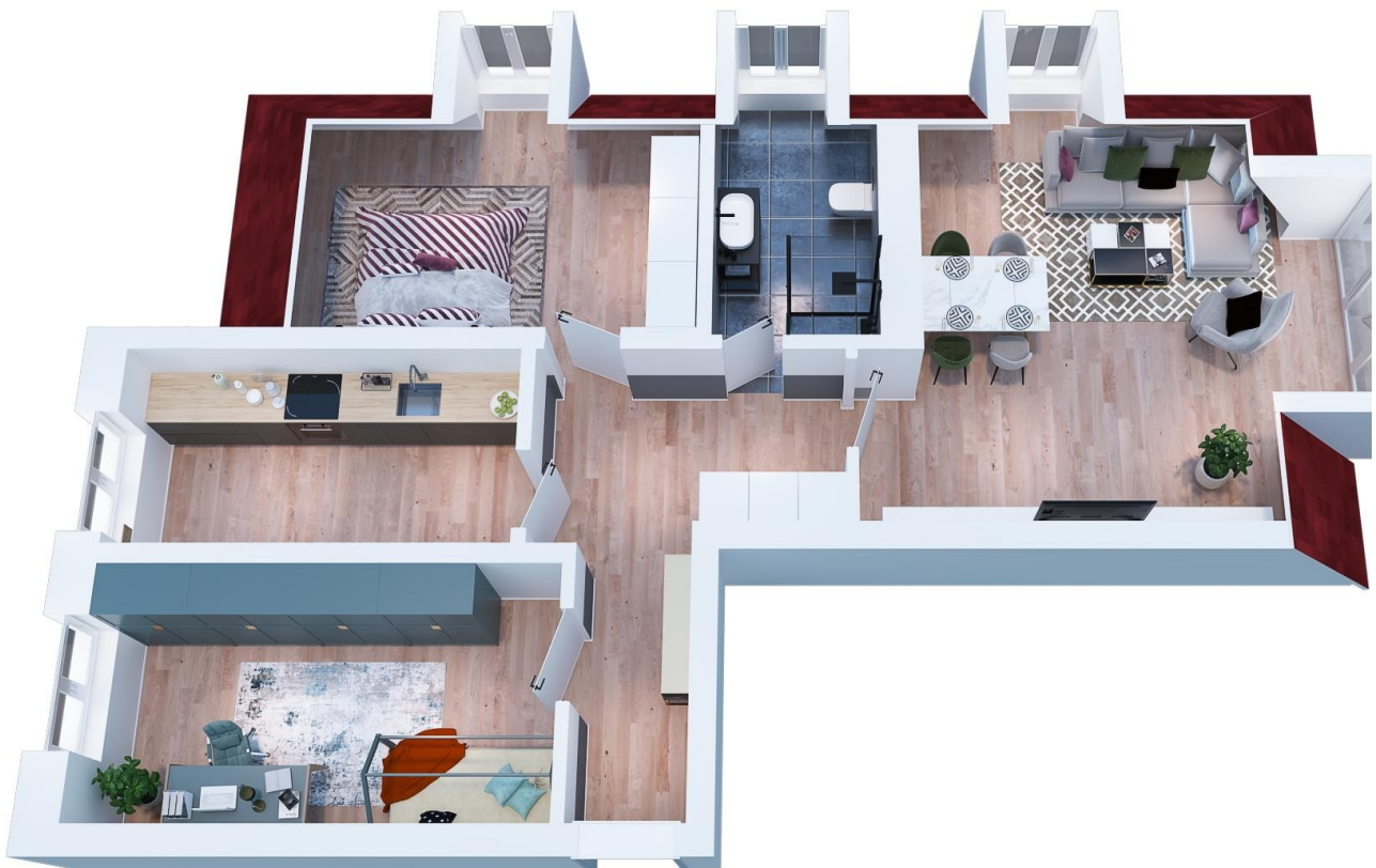
Grundriss mit Möbel