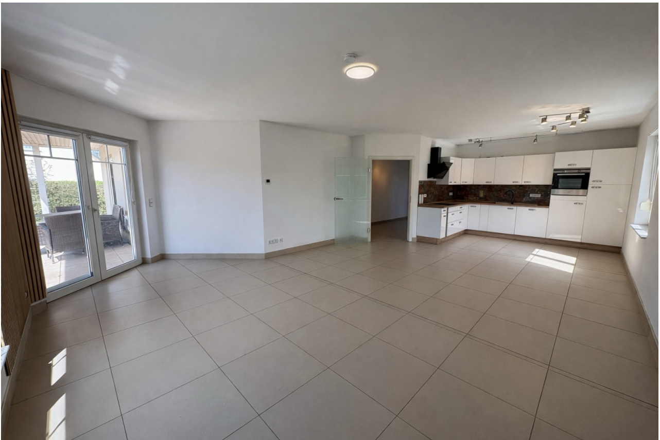
Wohnzimmer mit offener Küche