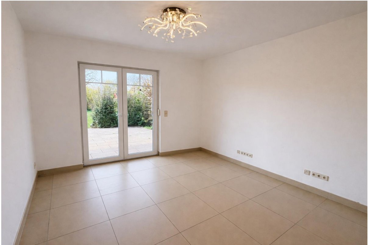
Zimmer 2 mit Terrassenzugang