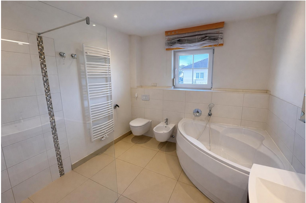
Badezimmer mit Bidet