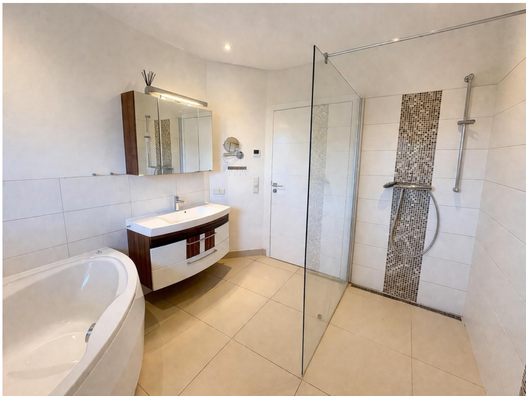
Bad mit Badewanne und Dusche