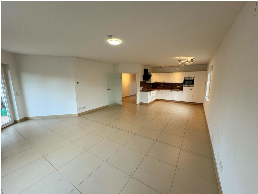
Wohnzimmer mit offener Küche