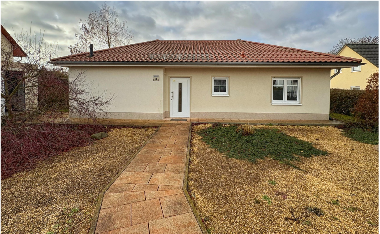
Hausansicht mit Vorgarten