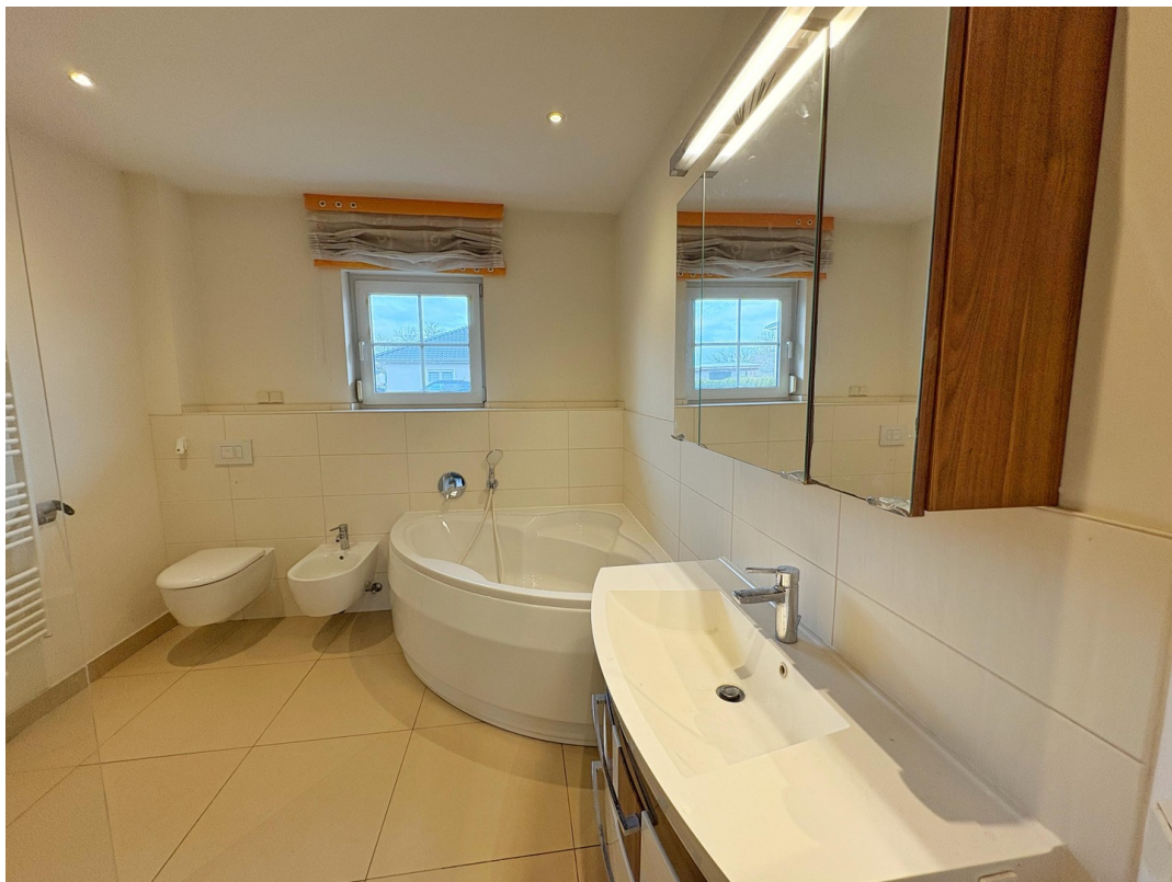
Badezimmer mit Bidet