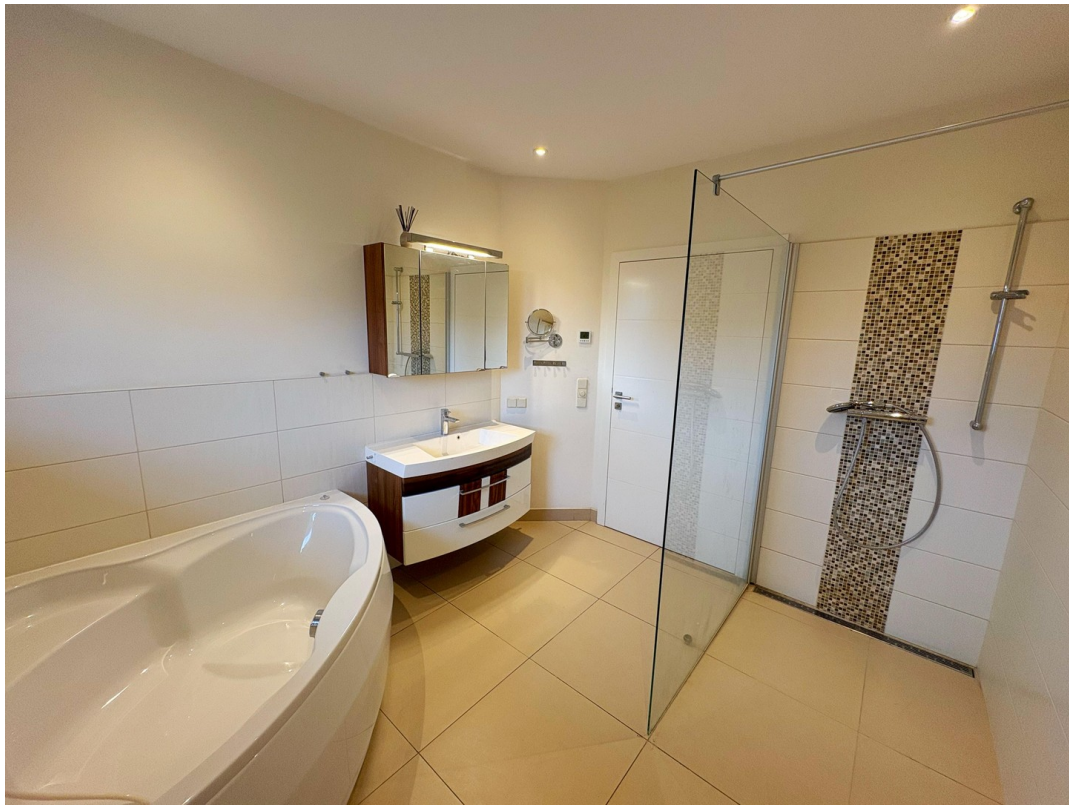
Bad mit Dusche und Badewanne