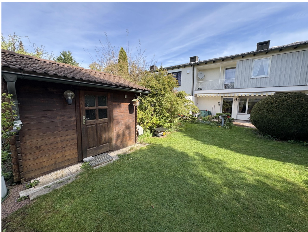
Rückansicht mit Gartenhütte