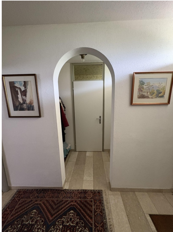
Blick auf Garderobe u. Toilette