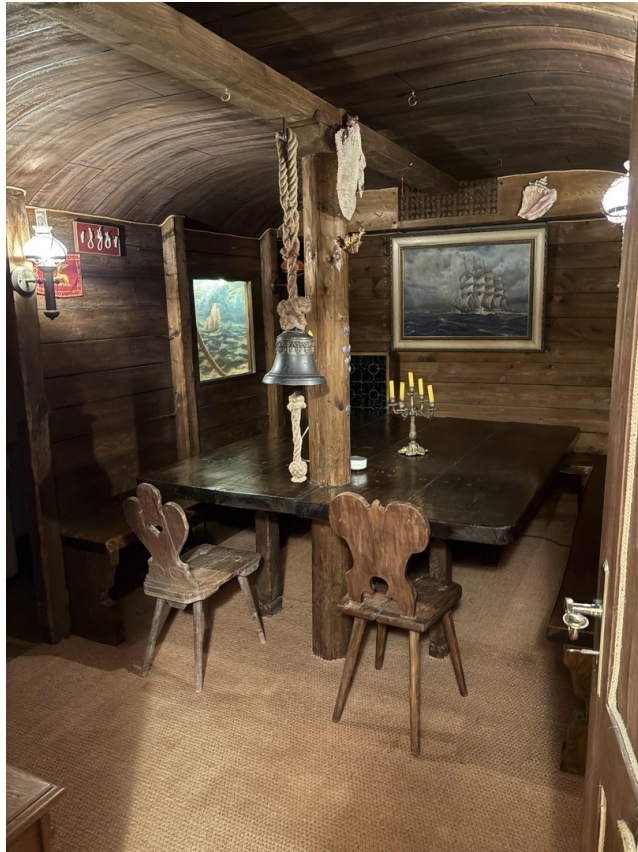
Hobby-/ Partyraum im UG