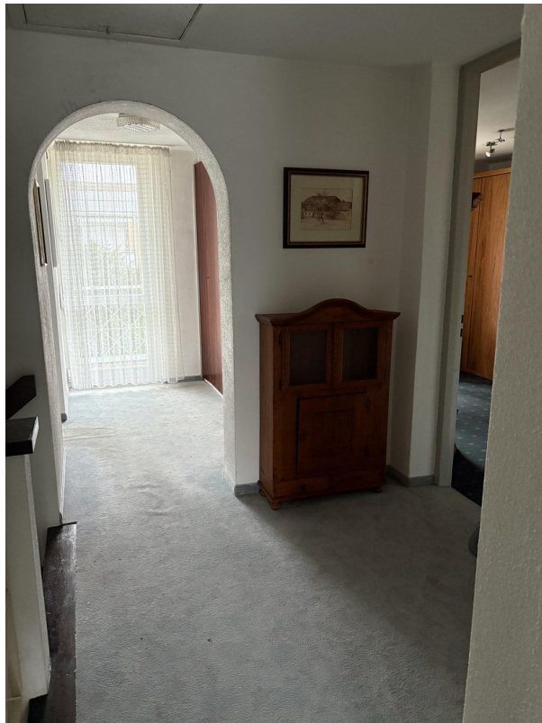
Gang 1. OG