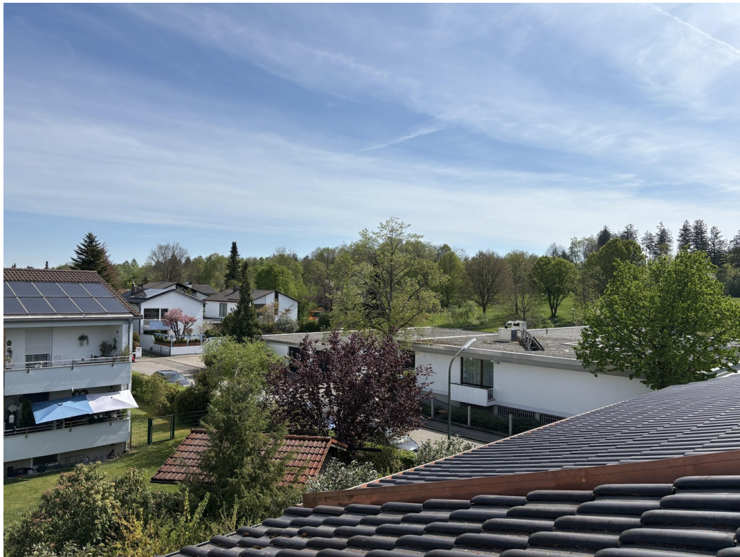
Blick aus Dachfenster