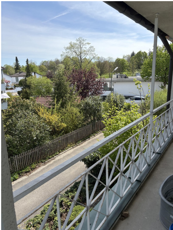
Blick aus Badfenster