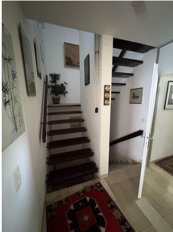
Treppenauf- und abgang