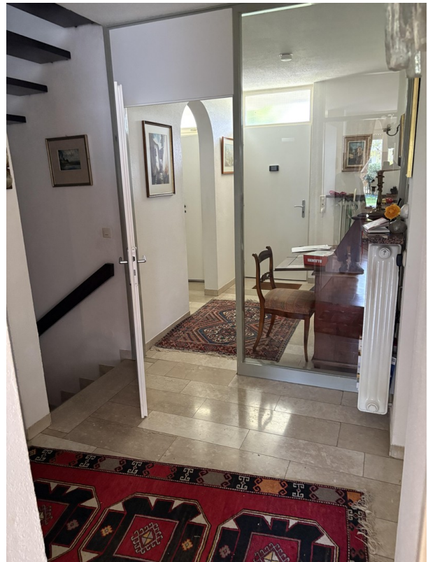
Eingangsbereich mit Windfang