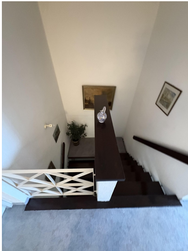
Treppe Blick von oben