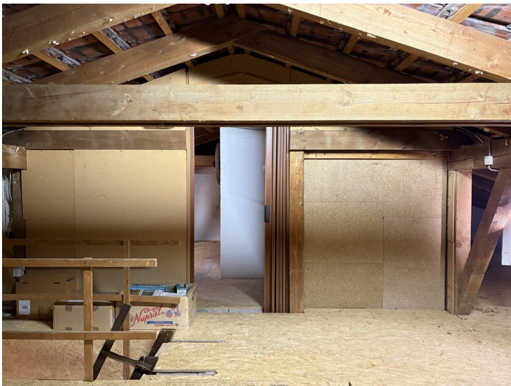
Speicherboden - 12cm Styropor