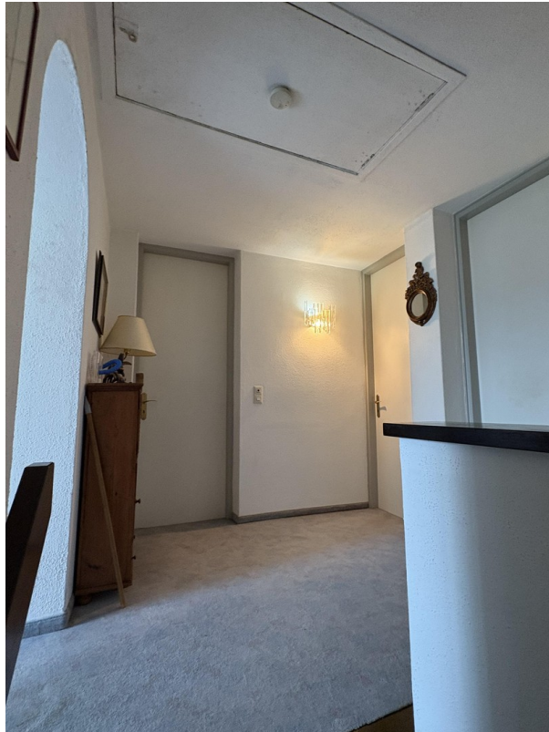
Gang 1. OG