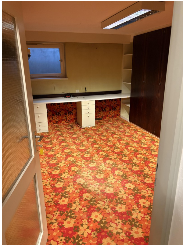
Büro im UG