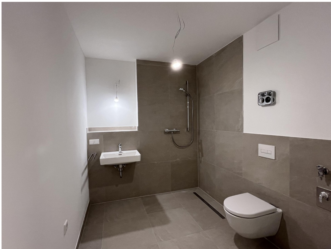
Bad mit Dusche