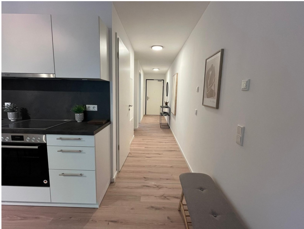
Flur / Eingangsbereich