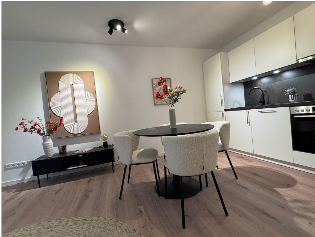
Wohnen & Essen