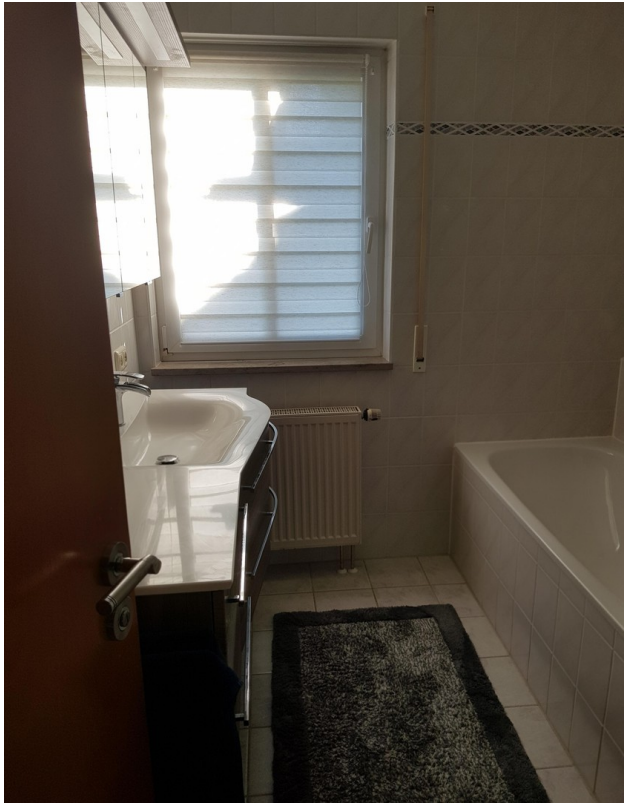
Bad mit Badewanne & Dusche