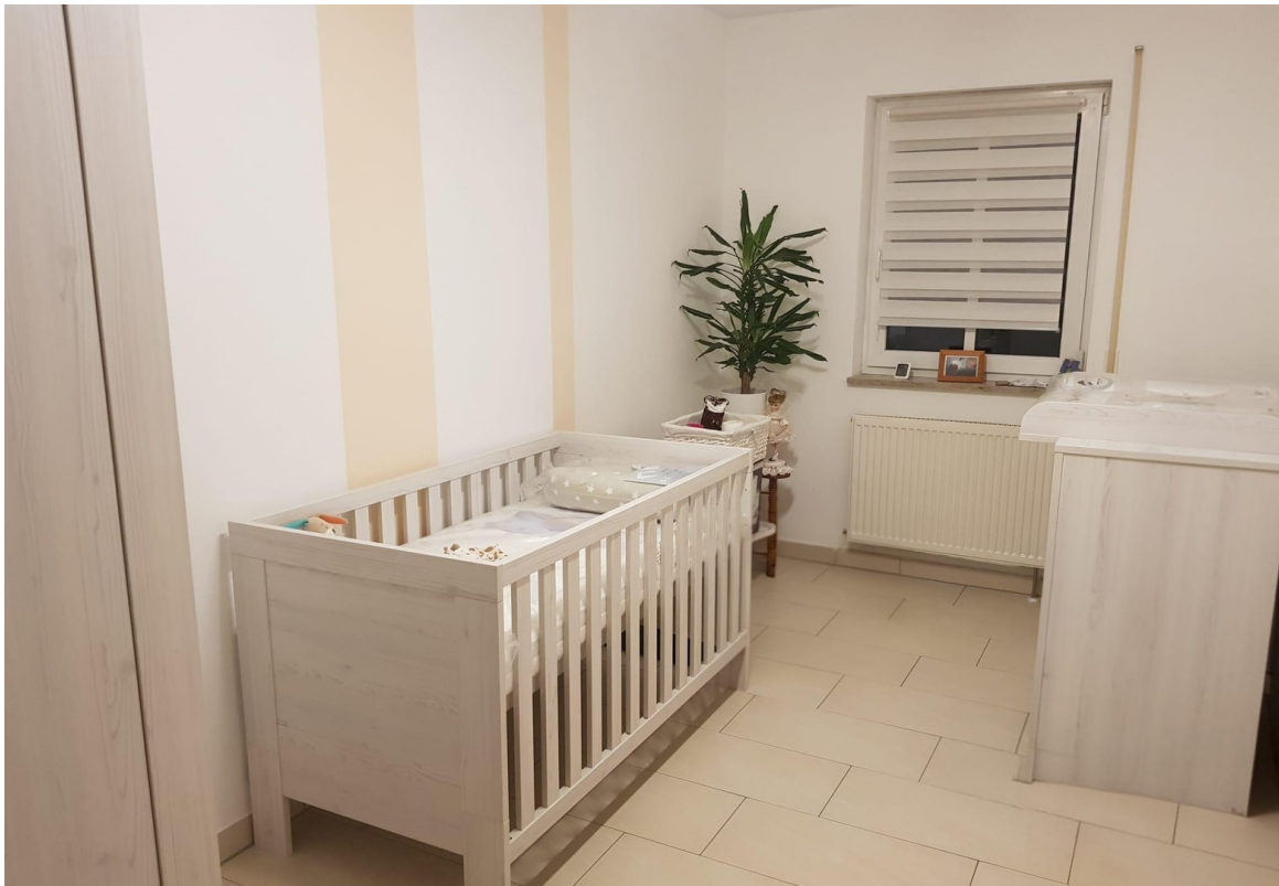
Kinder-/Schlafzimmer bzw. Büro