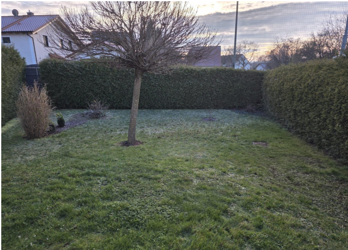
direkter Zugang Garten