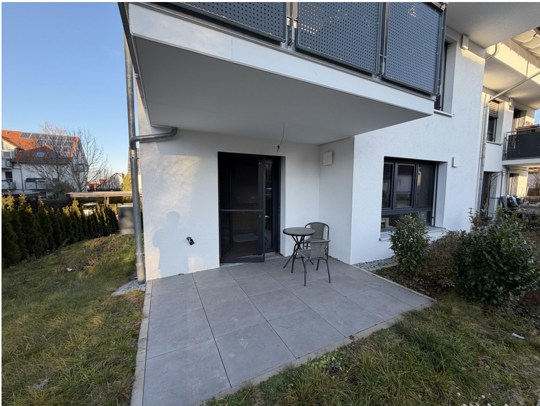
Terrasse mit Garten