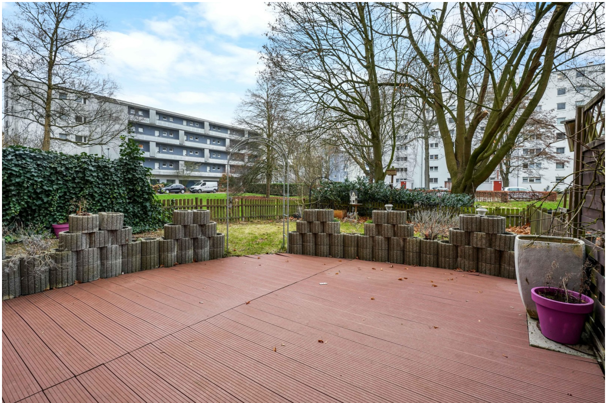
Terrasse mit Garten