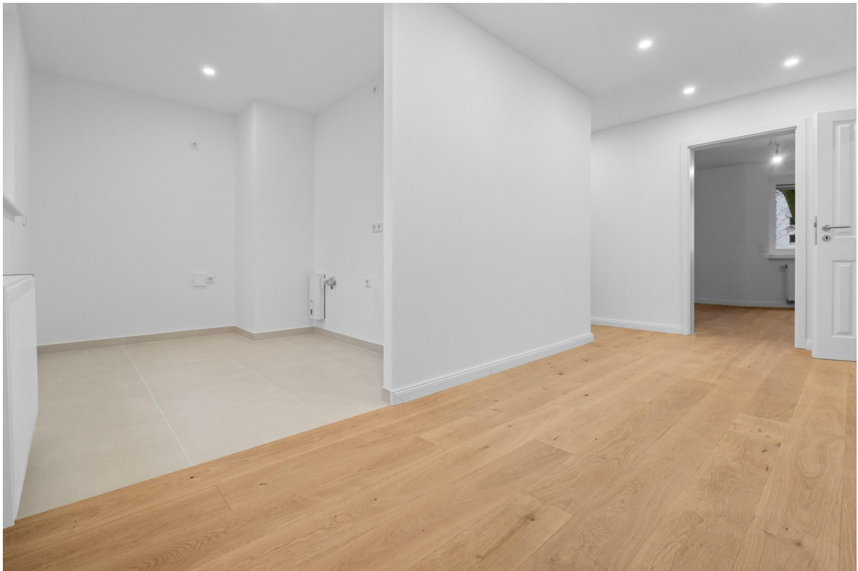
Küche zum Flur