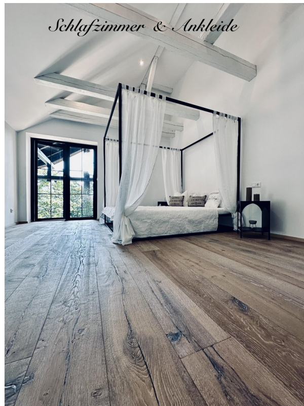
Schlafzimmer 1 mit Ankleideraum