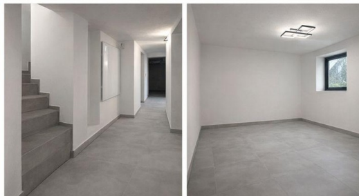
Kellerräume / Flur