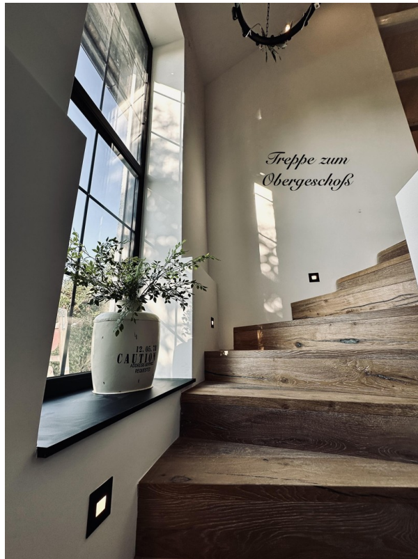
Treppe zum OG