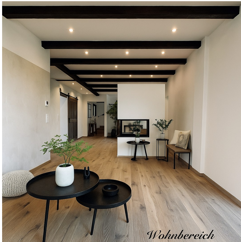
Wohnzimmer mit Kaminecke