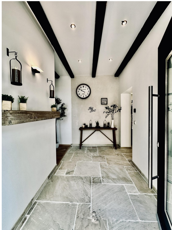
Flur & Eingangsbereich