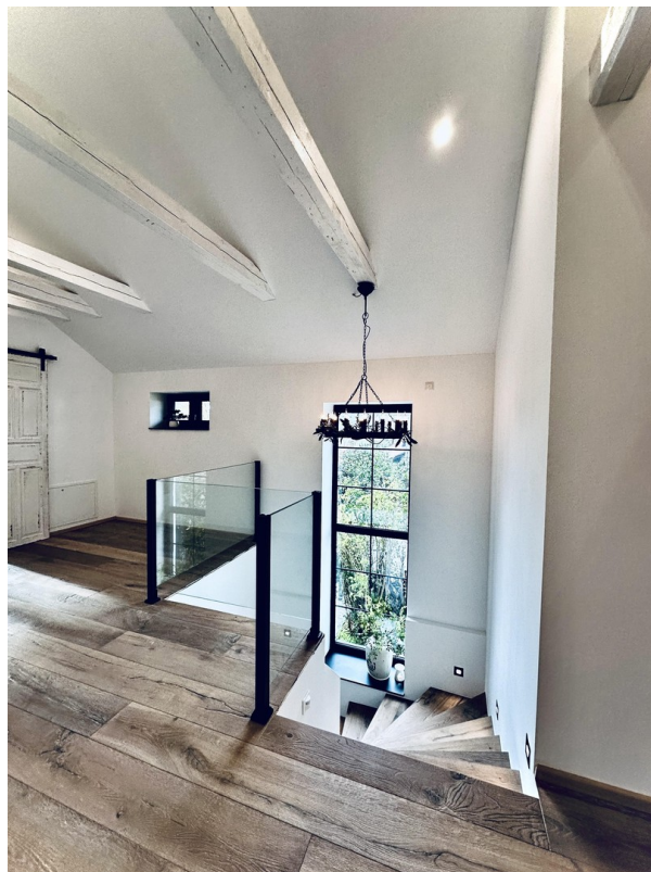
Flur im OG