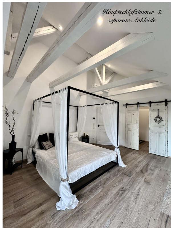
Schlafzimmer mit Ankleideraum