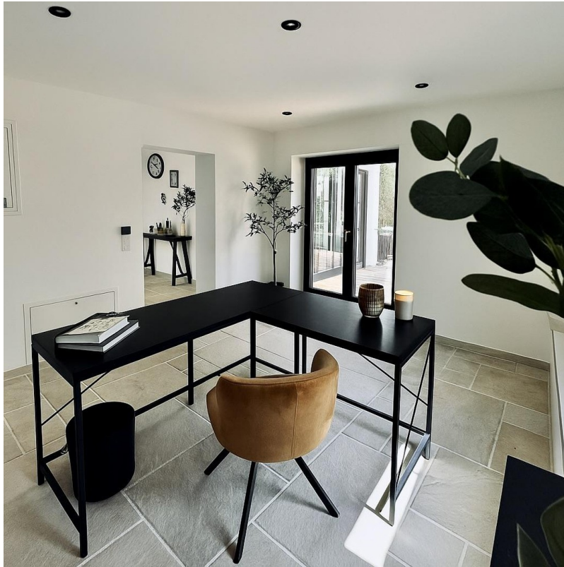
Office im EG