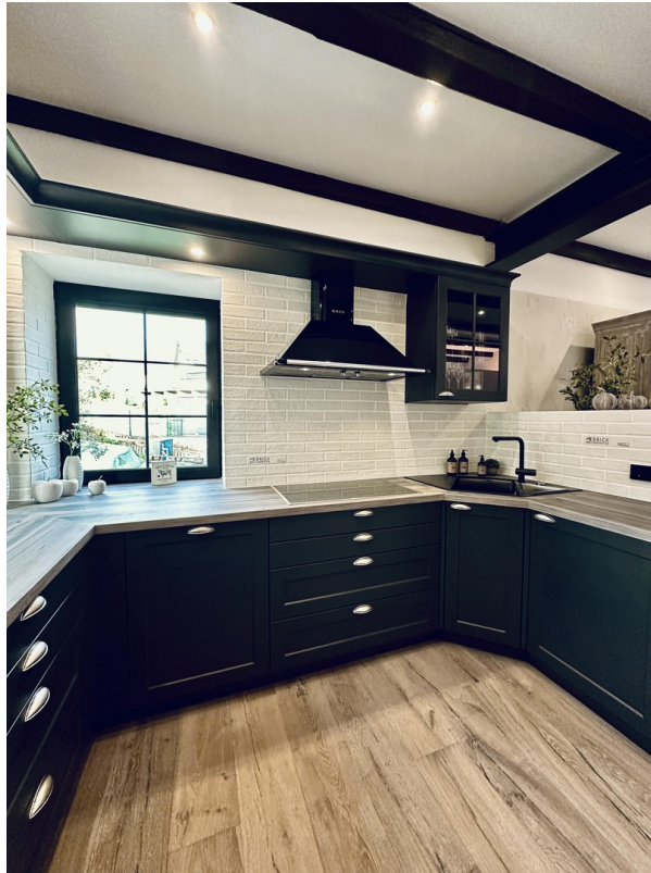
Einbauküche ( Global )