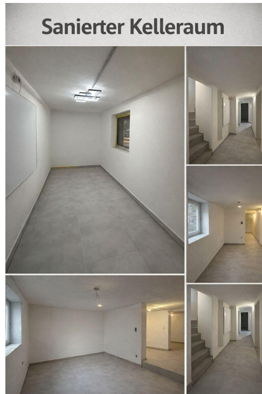
Kellerräume mit Tageslicht