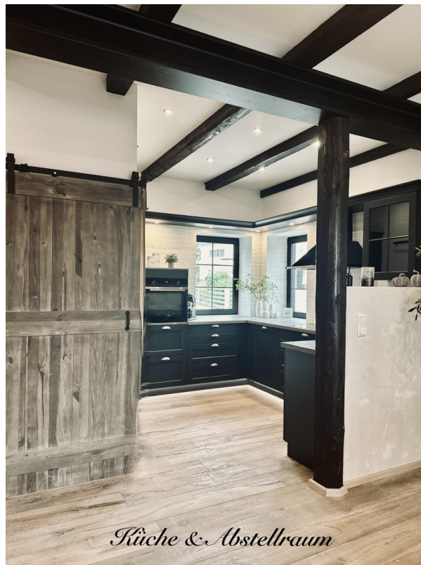
Küche & Abstellraum