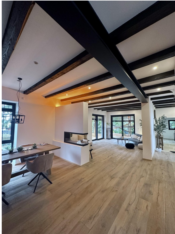
Wohn - Essbereich