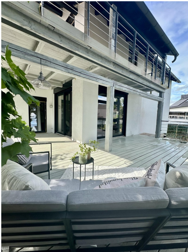
Terrasse im OG