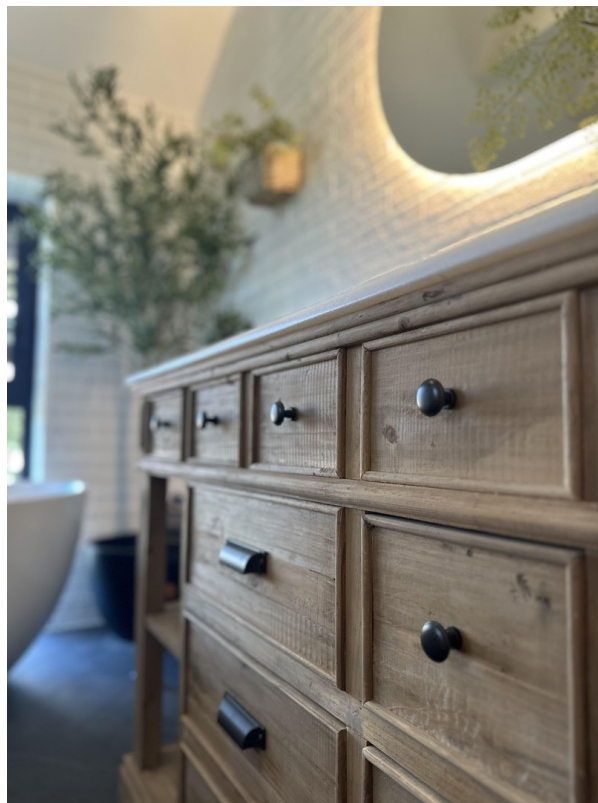
Waschtisch Marmor und Eiche