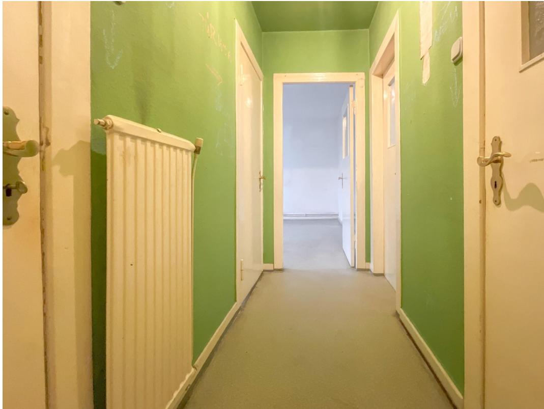
Flur im OG, funktionell