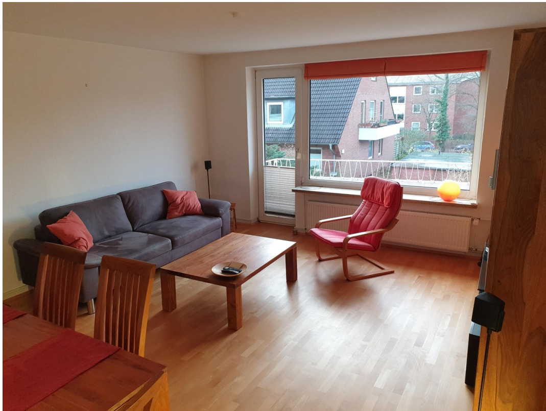
Wohnzimmer Ansicht 1