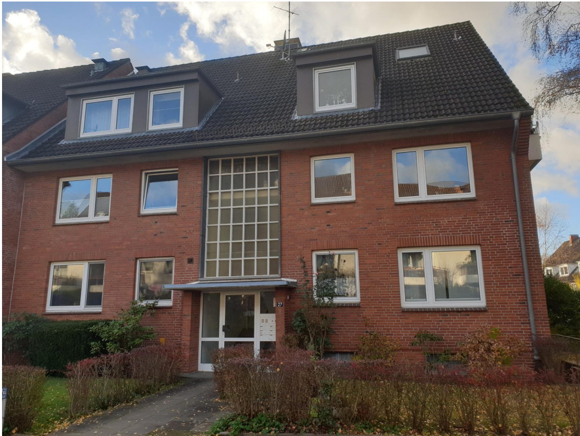
Haus Ansicht 2