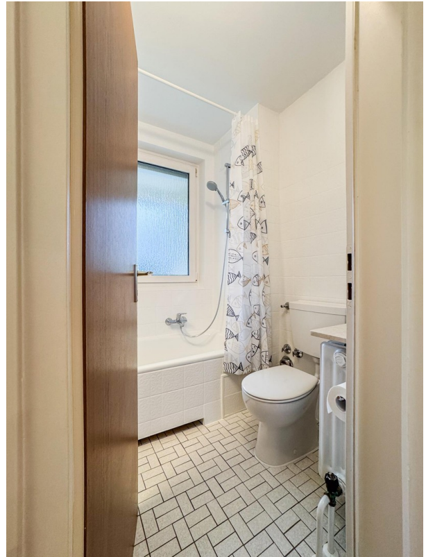
Bad - Bild a